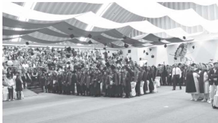
Con el llamado a luchar y perseguir sus sueños, el plantel Conalep Zitácuaro 240 despidió a más de 300 alumnos de la generación 2023-2026 en emotiva ceremonia de graduación.