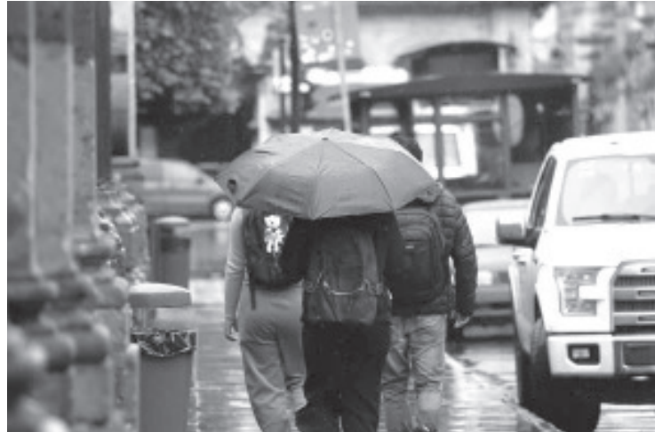
La Secretaría de Salud de Michoacán (SSM) exhorta a la ciudadanía a extremar precauciones ante el pronóstico de lluvias persistentes durante todo el día en el territorio estatal, en especial en el caso de niñas, niños y personas adultas mayores, quienes componen grupos vulnerables.

Soto recalcó que no existe vacuna ni medicamento contra el gusano barrenador, la única forma de combatirlo es la cura directa y el reporte oportuno.