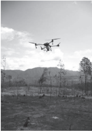
La Comisión Forestal del Estado (Cofom) continúa con el desarrollo del programa "Bio Renace: Dispersando Vida", mediante el cual se han restaurado hasta el momento 26 hectáreas de superficie forestal con la dispersión aérea de 92 mil germoesferas a través de drones en cinco municipios de Michoacán.

- Se han dispersado 92 mil germoesferas en cinco municipios, llevando semillas justo a las zonas devastadas por incendios