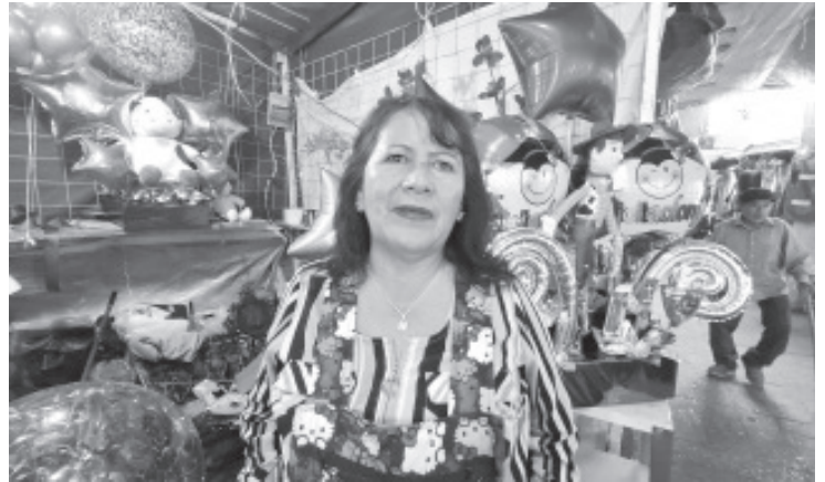
El Jardín Constitución ya se llenó de color y creatividad. Desde el 21 de junio y hasta el 21 de julio, los comerciantes de temporada están instalados con arreglos para graduaciones y clausuras, y reportan que las ventas ya empiezan a repuntar.

Hizo una invitación a la población para que se den una vuelta por el Jardín Constitución, vean todo lo que tienen y lleven el detalle perfecto para celebrar a los graduados de este año.