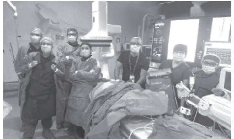
Un hombre procedente de Toluca, con una oclusión o taponamiento total en la arteria coronaria derecha y a punto de morir, salvó su vida en el Hospital Regional de Alta Especialidad (HRAE) del Instituto de Seguridad y Servicios Sociales (ISSSTE) de Morelia.