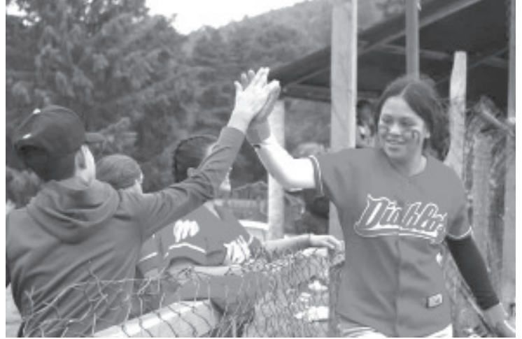
El representativo del municipio de Ocampo se consagró campeón del Cuadrangular Estatal de Sóftbol Femenil "Jonrón por la Paz", celebrado en el marco de la Copa Plan Michoacán Conade K'eri Ireta en Tlalpujahua, informó la Comisión Estatal de Cultura Física y Deporte (Cecufid).