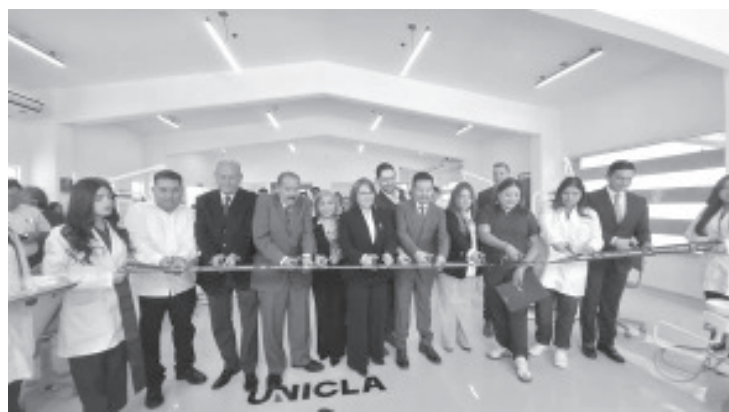
Con nuevas instalaciones para la práctica clínica, la Universidad Contemporánea de Las Américas, campus Zitácuaro, abrió las puertas de su Clínica Odontológica lunes. El proyecto busca elevar la preparación de sus alumnos y, al mismo tiempo, ofrecer atención bucal accesible a la población.