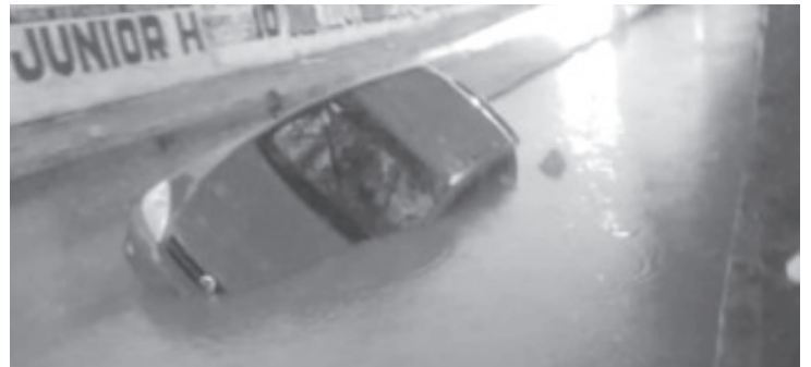
Inundaciones, encharcamientos, vehículos varados y un accidente vehicular fueron el resultado de la intensa lluvia que se registró durante la tarde-noche de este lunes en diferentes vialidades y colonias de Morelia, informaron fuentes policiales y de rescate.

A los peatones se les exhortó a no cruzar calles, avenidas o drenes con niveles elevados de agua, utilizar pasos seguros y mantenerse alejados de alcantarillas, registros y corrientes pluviales, debido al riesgo de ser arrastrados o caer en áreas no visibles bajo el agua.