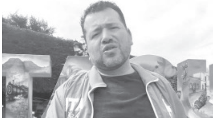
Este domingo se llevará a cabo una jornada masiva de reforestación en el municipio, donde la meta es plantar 7 mil árboles de pino ocote y pino michoacano en las zonas de Lechuguillas, Cerro del Melgo así como un predio cercano.