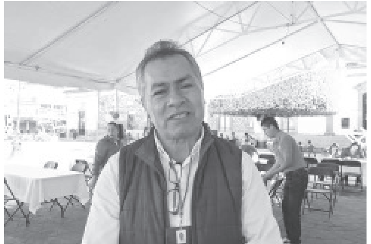
Este jueves el Servicio Nacional del Empleo (SNE) llevó a cabo su tercera feria de empleo del año en el centro de la ciudad. En un horario de 9:00 de la mañana a 2:00 de la tarde, un total de 21 empresas ofertaron más de 200 empleos.

La composición ya fue aprobada en días anteriores por el Cabildo como himno oficial del municipio, por lo que este izamiento representa su debut histórico ante la ciudadanía.