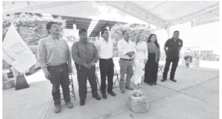
El Gobierno Municipal a través de la Secretaría de Inversión y Negocios llevó a cabo la entrega de 130 rollos de alambre de púas, beneficiando a 40 campesinos de distintos puntos del municipio.