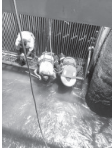
La noche del jueves se reportó la caída de un hombre en la presa del municipio de Tuxpan. El aviso se recibió a las 20:07 horas del 25 de junio y las labores de búsqueda se extendieron hasta las 00:30 horas del día siguiente.

Este hecho refleja la dificultad de las labores de rescate acuático y la importancia de extremar precauciones en presas y cuerpos de agua de la región.