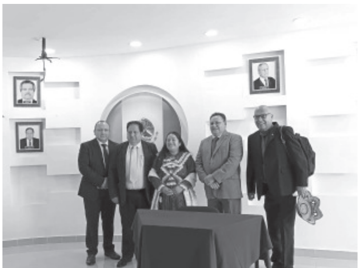
La Universidad Pedagógica Nacional Unidad 164 continúa avanzando con paso firme en uno de los procesos más importantes de la vida académica: la titulación profesional de sus estudiantes.

- Hoy, jueves 25, la UPN 164 vive su novena jornada de titulaciones