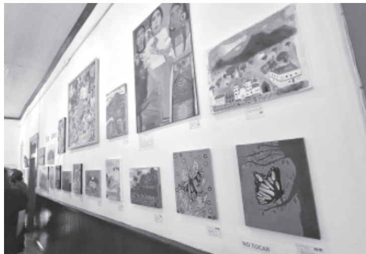
Como parte de la celebración de los 500 años de Zitácuaro, fue inaugurada la exposición "Expresión Histórica: Zitácuaro, 5 siglos" en el museo Casona "de la Estación. La actividad fue encabezada por el Presidente Municipal de Zitácuaro.