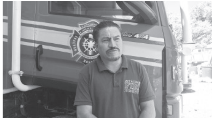
Durante la madrugada del lunes se registró un intento de suicidio en la carretera Zitácuaro-Morelia, a la altura del puente de Fierro. El reporte se recibió a la 01:57 horas y las labores concluyeron a las 02:20 horas.

Este hecho recuerda la importancia de atender la salud mental y buscar apoyo oportuno. Si tú o alguien cercano atraviesa una situación difícil, hablar con familiares, amigos o profesionales de la salud puede marcar la diferencia.