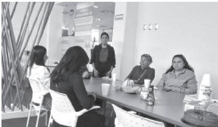
Con el objetivo de crear un espacio seguro, participativo y democrático para la toma de decisiones, enfocado en el bienestar de las mujeres y la erradicación de la violencia, se conformó el Comité “El LIBRE es nuestro”.