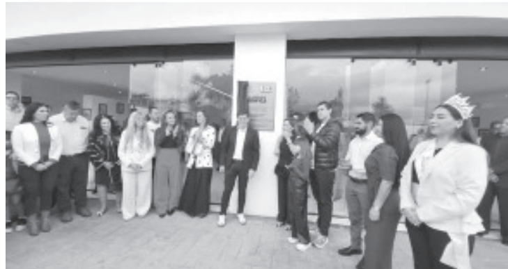
Para la realización de diferentes actividades culturales y artísticas que sean del disfrute de la población, fue reinaugurado el Centro Cultural, antes Centro de Convenciones. Esta actividad se enmarca en los eventos que se realizan por los 500 años de Zitácuaro.