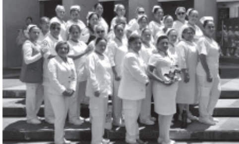
¡FELICITACIONES! A Todas las ENFERMERAS EN SU DÍA De la Clínica Hosp. del ISSSTE-ZITÁCUARO Quienes laboran Con VOCACIÓN, ENTREGA, HUMANIDAD Y RESPONSABILIDAD.