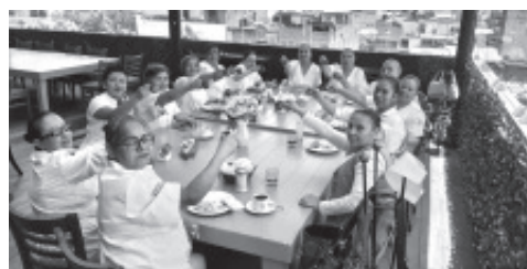
CELEBRANDO Y FESTEJANDO EL DÍA INTERNACIONAL DE LA ENFERMERA. Con una comida ENFERMERAS De la Clínica Hospital del ISSSTE- ZITÁCUARO. ¡FELICIDADES A TODAS!