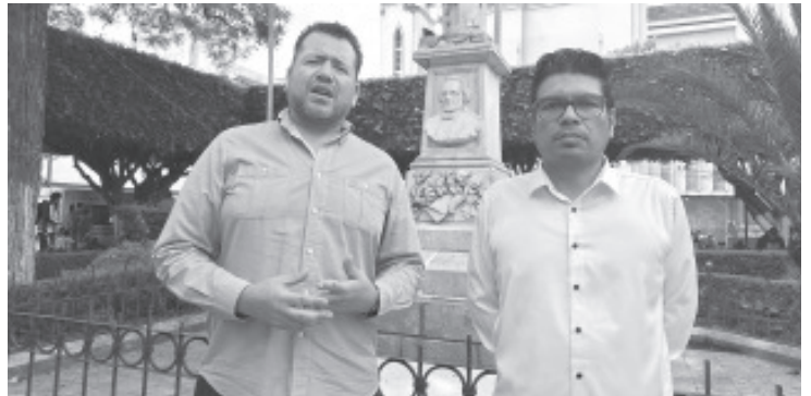
Con el objetivo de impulsar el autoempleo y mejorar la calidad de vida de la población, el colectivo RM27, en conjunto con Fuerza Mujeres Michoacán, realizará una serie de talleres gratuitos en municipios del oriente del estado. Se denominan "Ideas de negocio".

Para mayores informes e inscripciones, los interesados pueden comunicarse al 715-130-9850.