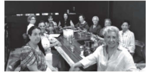
SESIÓN En Reunión de trabajo del CLUB ROTARY-MONARCA-ZITÁCUARO” UNIDOS PARA HACER EL BIEN” Compañerismo, Amistad y trabajo en equipo ¡FELICITACIONES A TODAS!