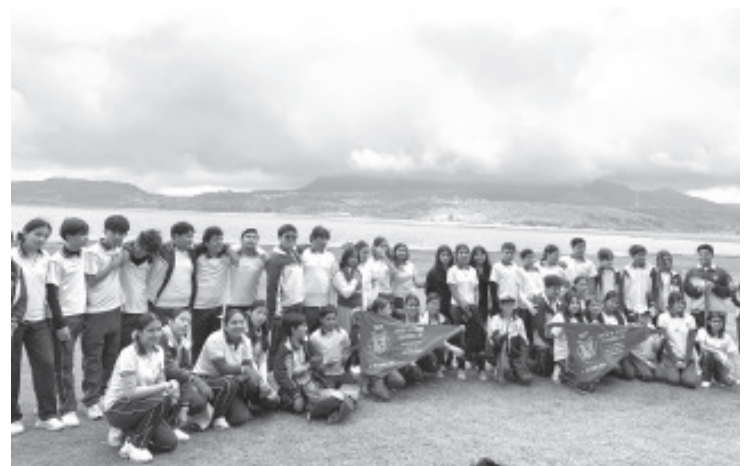
En un esfuerzo conjunto por promover el desarrollo sustentable y la participación comunitaria, la Universidad Centro Panamericano de Estudios Superiores (UNICEPES)—a través de las estudiantes del sexto semestre de la Licenciatura en Trabajo Social—, en colaboración con la Secretaría de Medio Ambiente y Recursos Naturales del Gobierno Municipal de Zitácuaro, llevaron a cabo con total éxito la Jornada de Limpieza Masiva.