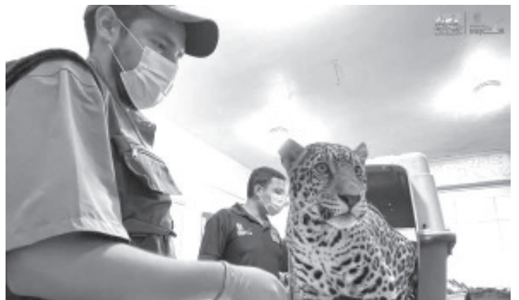
El Zoológico de Morelia brindará resguardo y atención especializada al cachorro de jaguar asegurado por la Fiscalía General del Estado (FGE) en Zitácuaro, como parte de una investigación relacionada con presuntos delitos contra la biodiversidad y maltrato animal.

De igual forma, reconoció la labor de las autoridades encargadas de la procuración de justicia y protección ambiental, y refrenda su disposición para seguir colaborando en acciones que contribuyan a salvaguardar la fauna silvestre y fortalecer la cultura de respeto y protección hacia las especies que forman parte del patrimonio natural de México.