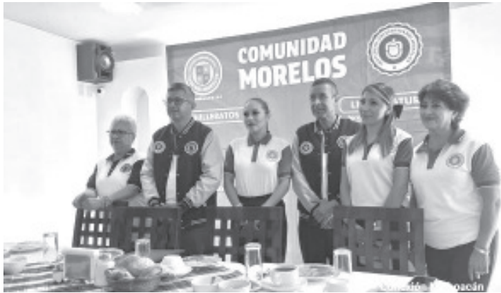
Con nuevas ofertas educativas en nivel de maestrías, el próximo 29 de agosto el Instituto Universitario Morelos inicia su ciclo escolar 2026-2027 consolidándose como la mejor opción para que jóvenes continúen sus estudios en nivel medio superior y superior.