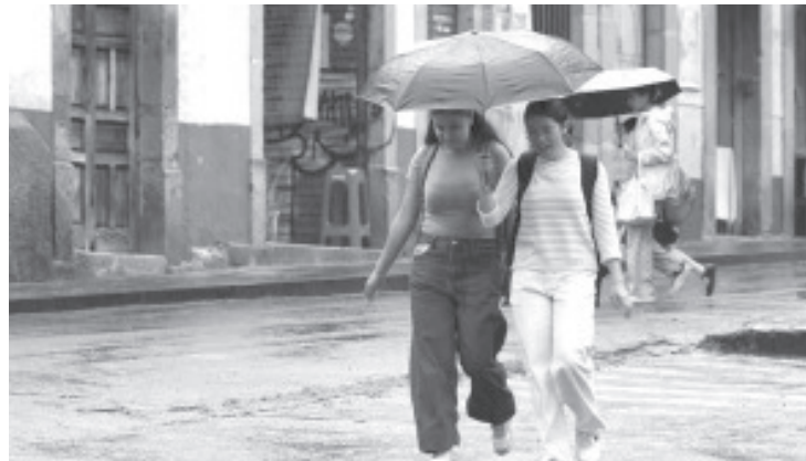
La Secretaría de Salud de Michoacán (SSM) emite una serie de recomendaciones a la población para fortalecer las medidas preventivas que protejan la salud de todos los integrantes de la familia durante la temporada de lluvias.

La SSM recuerda a las y los michoacanos que todos los centros de salud del estado cuentan con el personal para atender de manera oportuna y completamente gratuita cualquier padecimiento respiratorio. Para conocer el centro más cercano a su domicilio, la población puede consultar la plataforma oficial michoacan.gob.mx/ubica-tu-modulo/