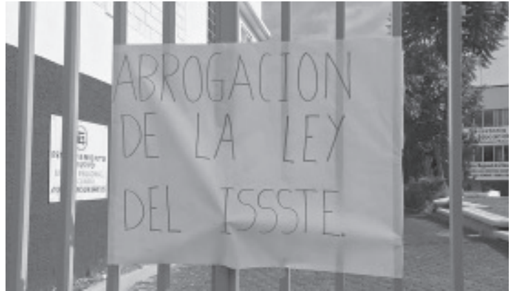
Integrantes de la Coordinadora Nacional de Trabajadores de la Educación, (CNTE), de la expresión "Por la unificación del magisterio", tomaron lunes las instalaciones de Servicios Regionales Educativos en Zitácuaro como parte de las acciones del paro nacional.