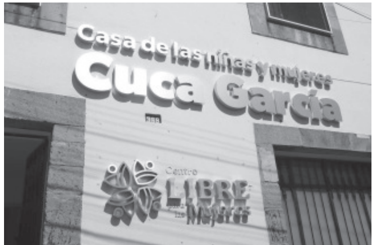
La atención integral para las mujeres se fortalece mediante los Centros LIBRE, espacios comunitarios que brindan acompañamiento, protección y herramientas para construir autonomía, bienestar y una vida libre de violencias, informó la Secretaría de Igualdad Sustantiva y Desarrollo de las Mujeres Michoacanas (Seimujer).