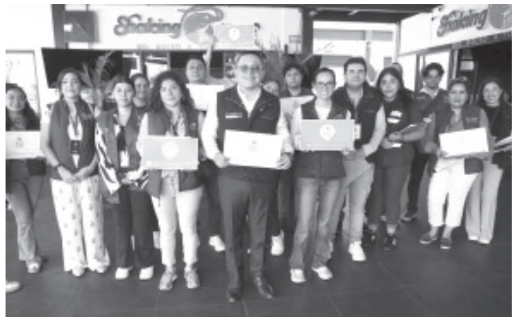
Con motivo del Día Mundial sin Tabaco, que se conmemora cada 31 de mayo, la Secretaría de Salud de Michoacán, a través de la Comisión Estatal para la Protección contra Riesgos Sanitarios (Coepris), desplegó acciones de fomento sanitario y verificación en puntos de alta afluencia, como plazas comerciales y el Aeropuerto Internacional de Morelia.

Asimismo, la Coepris invitó a quienes luchan contra esta adicción a acercarse a los Centros Comunitarios de Salud Mental y Adicciones (Cecosama) a fin de no enfrentar el proceso solos. Los centros se ubican en Morelia, Zitácuaro, Uruapan, Zamora, Lázaro Cárdenas y Huetamo, y brindan orientación y tratamiento integral gratuito.