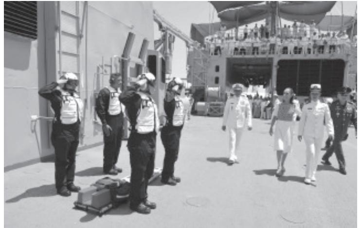
En el marco de la conmemoración del Día de la Marina Nacional, el gobernador Alfredo Ramírez Bedolla encabezó junto a la presidenta de la República, Claudia Sheinbaum Pardo, la ceremonia oficial para honrar a quienes conforman esta institución que ha sido clave en la estrategia de seguridad implementada en Michoacán.