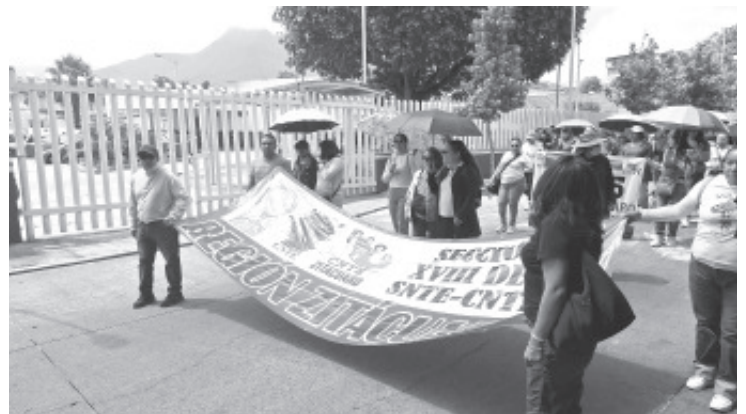
Integrantes de la Coordinadora Nacional de Trabajadores de la Educación (CNTE) realizaron una marcha que partió de la clínica del ISSSTE hacia el centro de la ciudad, donde desarrollaron una actividad sindical en el marco de la jornada de lucha nacional.