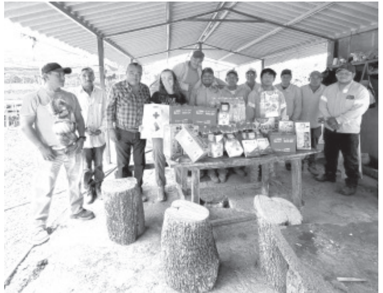
La Alianza por la Conservación del Bosque, Suelo y Agua A.C. entregó víveres y apoyos en especie a integrantes de brigadas contra incendios forestales de varios municipios de la región Oriente de Michoacán.

“Queremos que El Cerrito siga siendo un lugar bonito para todos, el personal hace su trabajo, pero necesitamos que los ciudadanos nos ayuden a conservarlo limpio”, concluyó.