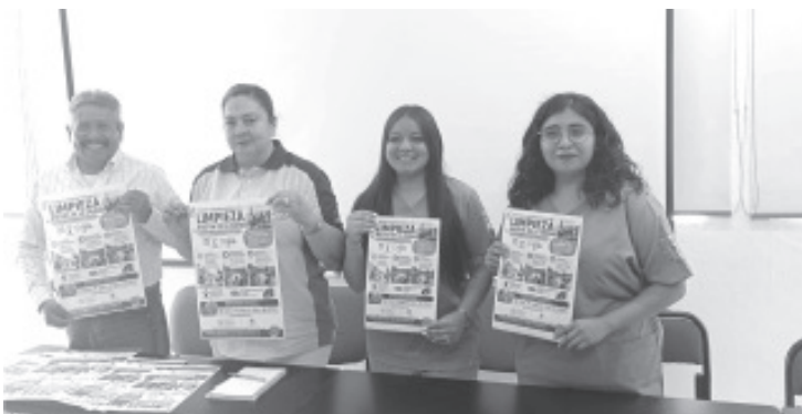
Con motivo del Día Mundial del Medio Ambiente, estudiantes de la Universidad Centro Panamericano de Estudios Superiores (UNICEPES), de Trabajo Social, en coordinación con la Secretaría de Medio Ambiente y Recursos Naturales, realizarán una jornada masiva de limpieza el próximo 5 de junio a partir de las 10:00 de la mañana.

Con esta jornada, los estudiantes de UNICEPES refrendan su compromiso con la comunidad y el cuidado del entorno, invitando a los habitantes a sumarse a este esfuerzo colectivo bajo el mensaje: "Involúcrate y sé el cambio que quieres ver. Por nosotros, por nuestras familias y por Zitácuaro."