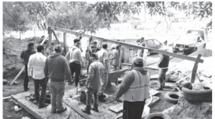
Elementos de Bomberos Zitácuaro recuperaron los cadáveres de dos hombres que fueron localizados dentro de un pozo de aproximadamente 30 metros de profundidad, ubicado en la colonia Rincón de Dolores, en la cabecera municipal de Ciudad Hidalgo. De acuerdo con fuentes policiales, hasta el momento se desconoce cómo las víctimas terminaron en el fondo de la citada cavidad.

Después, los especialistas de la Fiscalía Regional acudieron al lugar e iniciaron las investigaciones respectivas para esclarecer las circunstancias en que ocurrieron los hechos. Por último, los difuntos fueron llevados a la morgue para la práctica de la necropsia de ley.