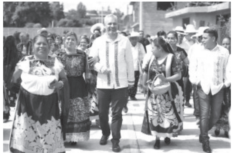
Con el compromiso de garantizar el derecho a una vida libre de violencia y brindar atención integral a las mujeres, el gobernador Alfredo Ramírez Bedolla informó que 22 comunidades indígenas con autogobierno ya cuentan con Centros Libre.

El mandatario refirió que hoy en día ya operan un total de 127 centros en todo el territorio estatal, con los cuales se busca impulsar la autonomía, la libertad y el fortalecimiento de las redes de apoyo comunitario para todas las michoacanas.