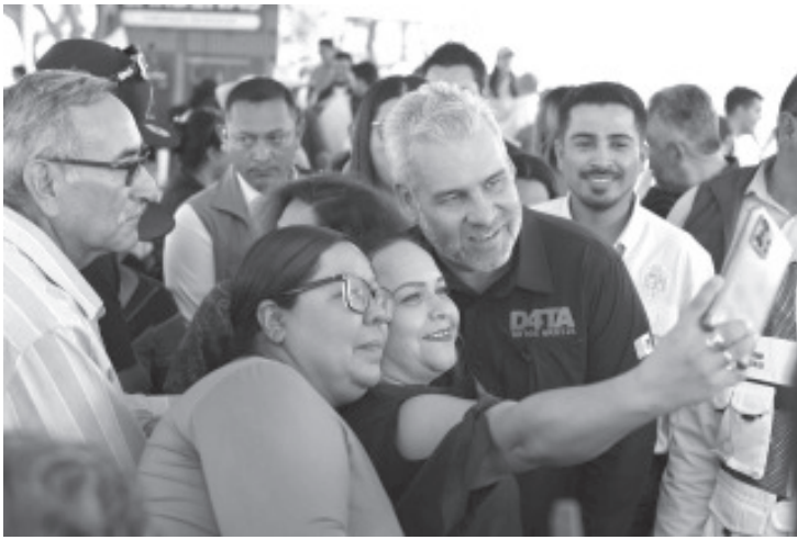
En el marco del encuentro “Diálogo, Así se Vive la Transformación” en el Instituto Tecnológico de Estudios Superiores de Zamora (ITESZ), el gobernador Alfredo Ramírez Bedolla anunció que en el mes de agosto se abrirá nuevamente la convocatoria para inscribirse al programa Data Datos Gratis.

Zamora, Michoacán, 29 de mayo de 2026.- En el marco del encuentro “Diálogo, Así se Vive la Transformación” en el Instituto Tecnológico de Estudios Superiores de Zamora (ITESZ), el gobernador Alfredo Ramírez Bedolla anunció que en el mes de agosto se abrirá nuevamente la convocatoria para inscribirse al programa Data Datos Gratis.