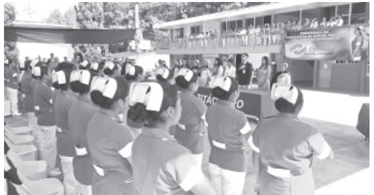
Un total de 240 alumnos de segundo y cuarto semestre de la carrera de Enfermería del Conalep Zitácuaro 240 recibieron este martes sus cofias y fistles, como parte del acto que marca el inicio de sus prácticas en campos clínicos.