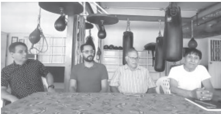
Como parte de los festejos por el aniversario del Salón de la Fama, el próximo 1 de agosto se realizará en esta ciudad el torneo "Ingeniero Virgilio Esquivel Nateras".