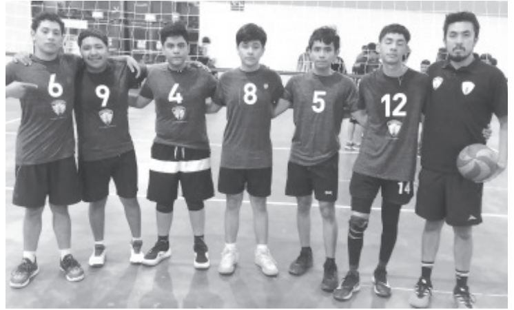
Los equipos de Tapatíos y Tapatías Zitácuaro tuvieron una destacada participación el pasado fin de semana en la Copa Nacional Libertadores, celebrada en la ciudad de San Luis Potosí, donde enfrentaron a representativos de distintos estados de la República Mexicana.