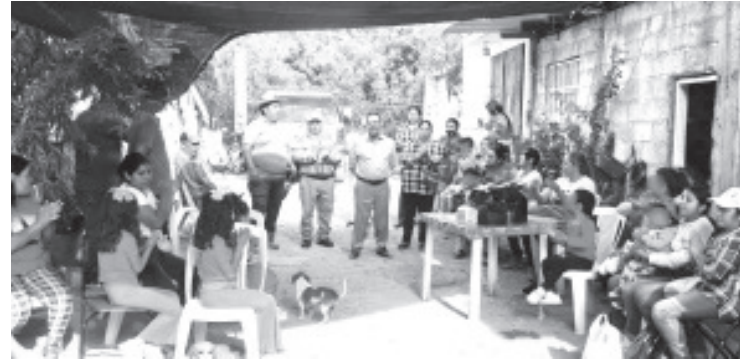
Hay momentos que demuestran que los cambios comienzan desde la mesa de un hogar. Eso se vivió recientemente en la Colonia Santa Fe, donde se llevó a cabo una grata convivencia vecinal marcada por la calidez, las buenas pláticas y un ambiente de sincera camaradería.