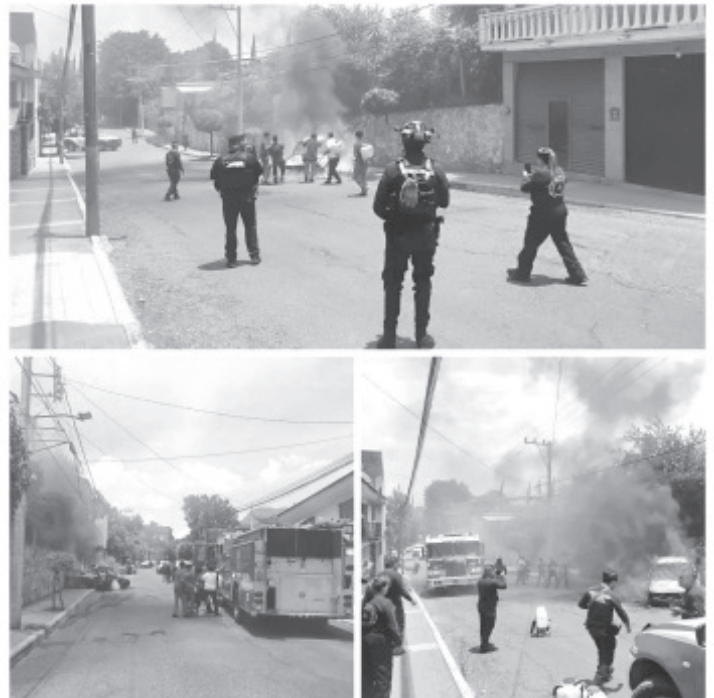
Un vehículo del servicio público tipo taxi se incendió este miércoles en la colonia Flor de Liz, presuntamente a causa de una falla mecánica, sin que se registraran pérdidas humanas.

Asimismo, las corporaciones de seguridad y auxilio destacaron la importancia de evitar especulaciones y atender únicamente la información emitida por fuentes oficiales.