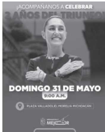
El gobernador Alfredo Ramírez Bedolla hizo un llamado a las y los michoacanos para reunirse el próximo domingo 31 de mayo en el Centro Histórico de Morelia, con el objetivo de acompañar a la presidenta Claudia Sheinbaum Pardo en la celebración de los dos años del triunfo del Segundo Piso de la Cuarta Transformación.

Destacó el compromiso permanente que la presidenta de México ha mantenido con la entidad, resaltando los históricos apoyos económicos y sociales que se han brindado a las familias michoacanas a través de los diferentes Programas para el Bienestar.