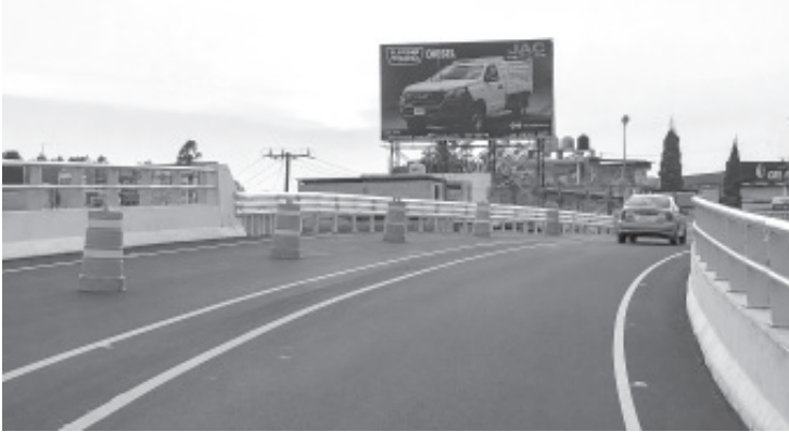
Autoridades municipales dieron a conocer el pasado miércoles la apertura parcial del segundo distribuidor vial de la ciudad de Zitácuaro, ubicado en el libramiento Francisco J. Mújica, a la altura donde anteriormente se encontraba el monumento ecuestre a Ignacio López Rayón, conocido popularmente como el “Caballito”.

- Este segundo paso elevado de la ciudad mejorará el tránsito vehicular en la zona