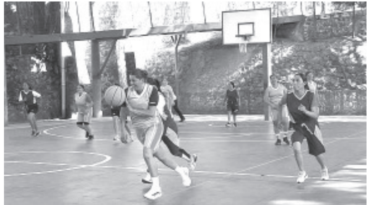
Como parte de la celebración del Día del Maestro y para impulsar la unidad a través del deporte, arrancaron los juegos magisteriales 3ra Copa Do-CNTE que reúne a las diferentes expresiones de toda la región oriente.