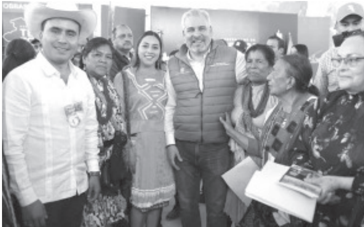
En un paso decisivo para garantizar el bienestar y la seguridad de las mujeres en Michoacán, el gobernador Alfredo Ramírez Bedolla informó que ya operan 127 Centros LIBRE, distribuidos estratégicamente en los 113 municipios de la entidad y en comunidades con autogobierno.

autonomía y la identidad de los pueblos originarios. Por ello, la infraestructura actual incluye 18 espacios ubicados en comunidades de autogobierno.