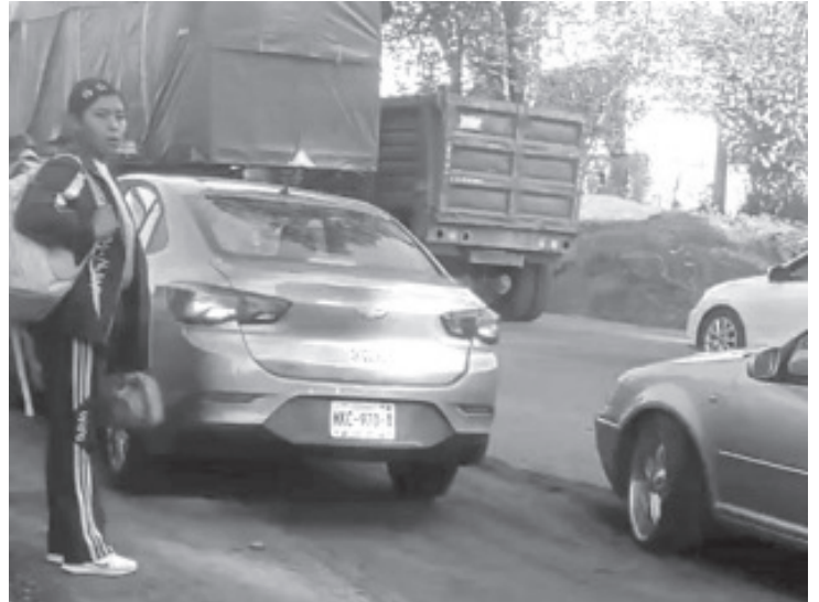
El tráfico pesado que se genera todos los días en la carretera Zitácuaro-Morelia pone en riesgo a peatones, entre ellos estudiantes que tienen que cruzar diariamente para ir a la escuela.

En reciente visita al municipio, el gobernador del estado, Alfredo Ramírez Bedolla, señaló que la obra de modernización de esta vía concluirá hasta el mes de diciembre, por lo que todavía restan varios meses con esta situación.