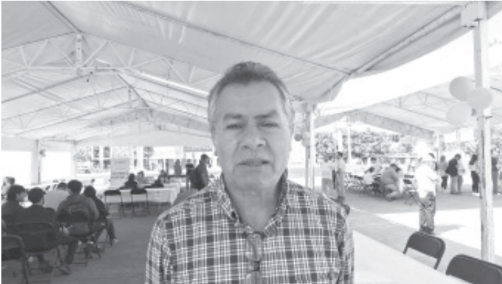
En el centro de Zitácuaro se llevó a cabo la Feria del Empleo, de 9:00 a 14:00 horas, con la participación de 21 empresas que ofertaron más de 240 vacantes de diferentes niveles.

H. Zitácuaro Michoacán, 21 de mayo de 2026. - En el centro de Zitácuaro se llevó a cabo la Feria del Empleo, de 9:00 a 14:00 horas, con la participación de 21 empresas que ofertaron más de 240 vacantes de diferentes niveles.