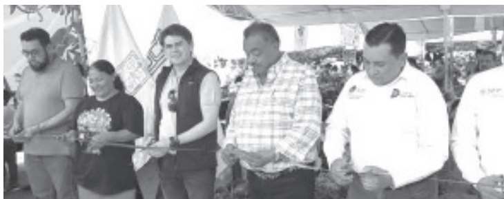
Con el objetivo de acercar a la población al cuidado del medio ambiente y mostrar la riqueza vegetal de la región, sábado se inauguró el primer Festival Floral de Primavera en la Plaza Cívica Licenciado Benito Juárez, que estará este 16 y 17 de mayo.

El festival se realiza los días 16 y 17 de mayo y ofrece exposición y venta de plantas ornamentales, exóticas, suculentas, cactáceas, orquídeas y medicinales. Además, incluye talleres gratuitos, artesanías, productos locales, serpentario y una exposición de reptiles.