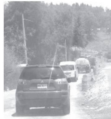
Después de décadas de ser uno de los puntos más peligrosos de la región, las Curvas del Gato quedaron cerradas de manera definitiva al mediodía de este lunes. En su lugar entró en operación un nuevo tramo carretero que conecta Zitácuaro con Morelia, el cual por ahora funcionará a un solo carril mientras se concluyen los trabajos de señalización y compactación.

La carretera Zitácuaro-Morelia es una de las rutas más transitadas del oriente michoacano, por lo que la modificación en este punto era considerada prioritaria para mejorar la conectividad y reducir los tiempos de respuesta de servicios de emergencia.