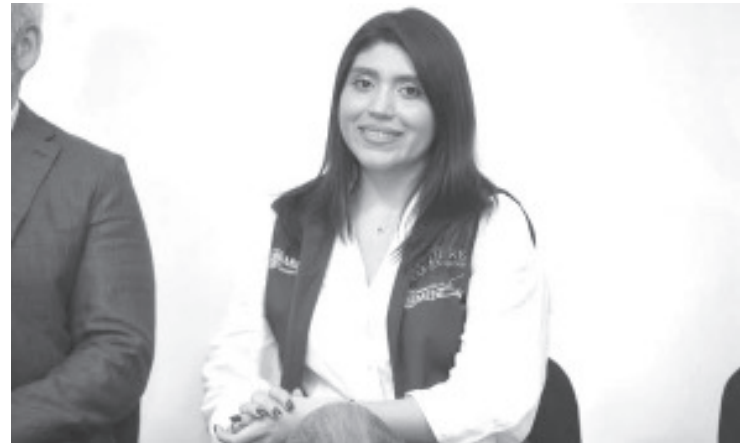
Michoacán hace historia al convertirse en el primer estado del país en establecer los Centros LIBRE en la totalidad de su territorio, con cobertura en municipios, comunidades indígenas y autogobiernos.