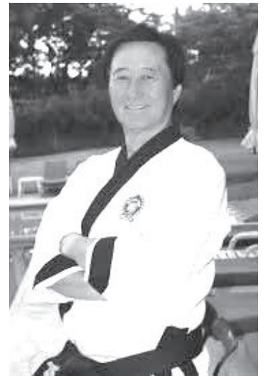
El taekwondo mexicano despidió este sábado a su fundador. El Gran Maestro Dai Won Moon falleció a los 83 años en San Miguel de Allende, Guanajuato, según confirmó la Federación Mexicana de Taekwondo.

Con su fallecimiento, el taekwondo mexicano pierde a su figura fundacional, pero deja un legado que sigue vigente en cada escuela, en cada examen y en cada alumno que pisa un doyang bajo los principios que él estableció.