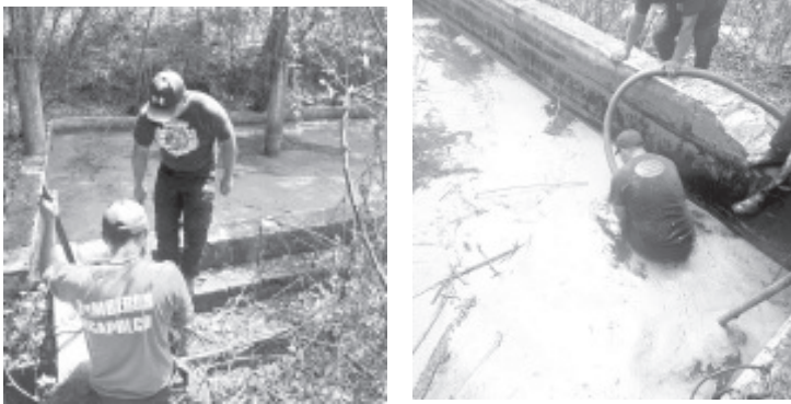
El Heroico Cuerpo de Bomberos de Zitácuaro realizó un desasolve total de aguas negras en una alberca ubicada en la zona de Quintas La Carolina. La llamada de apoyo se recibió a las 11:00 horas y las labores concluyeron a las 18:00 horas.

En el proceso se localizaron restos de un canino, sin que se reportaran más novedades. Tras finalizar las maniobras, los elementos retornaron a base para quedar pendientes de cualquier emergencia.