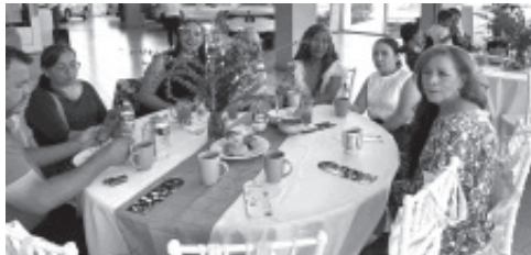
CELEBRARON y FESTEJARON EL DÍA DE LA MADRE A Todas las MAMÁS Los trabajadores de la AGENCIA VOLKSWAGEN Con un CONVIVIO y partieron su Pastel. ¡FELICITACIONES!