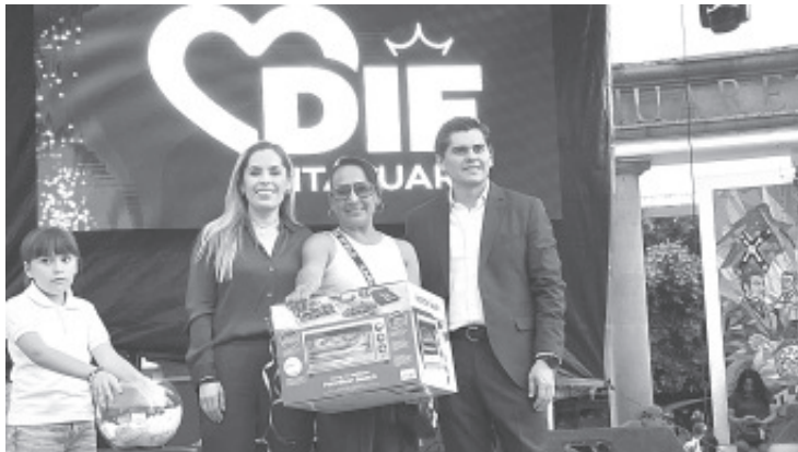
El corazón de la ciudad se llenó de alegría y desde las 2 de la tarde, la explanada del Jardín Central fue sede del gran festejo del Día de las Madres, organizado por el Gobierno Municipal y el DIF Zitácuaro para reconocer a miles de mamás del municipio.

El festejo reunió a mamás de colonias y comunidades, quienes agradecieron el detalle y la convivencia. El Ayuntamiento reafirmó su compromiso de seguir generando espacios para honrar a quienes son el centro de cada hogar.