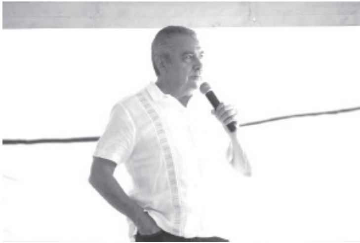
Raúl Morón Orozco se consolida como el favorito para asumir el rol de coordinador estatal en Defensa de la Transformación, así lo señala la más reciente encuesta de Cripeso, que lo coloca con un 30.58% de las preferencias en la disputa por la candidatura de Morena a la gubernatura de Michoacán en el 2027.

- El más reciente ejercicio de la encuestadora coloca al legislador como el amplio favorito en la carrera por la candidatura a la gubernatura con el 30.58%