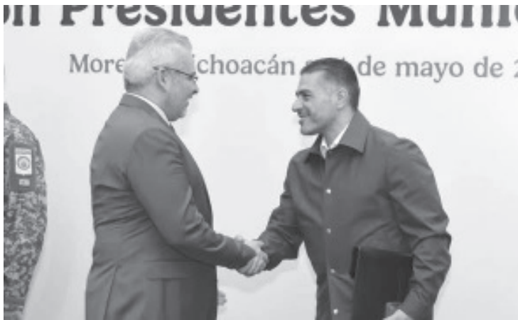
El secretario de Seguridad y Protección Ciudadana de México, Omar García Harfuch, destacó que la coordinación permanente con el Gobierno de Michoacán y las instituciones en materia de seguridad y procuración de justicia, han generado buenos resultados para bajar la incidencia delictiva en la entidad.

En tanto el secretario de la Defensa, Ricardo Trevilla Trejo, reiteró disposición para reforzar la capacitación, reclutamiento y aplicación de exámenes de confianza para policías municipales, así como de evaluación a infraestructura para elementos de seguridad, entre otras solicitudes que externaron los alcaldes participantes.