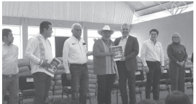
Autoridades estatales y municipales entregaron mas de 469 toneladas de cemento para 11 comunidades del Programa Obras por Cooperación, para la rehabilitación de canales de riego, destacando que nunca antes se habían intervenido tantos canales como en los últimos años.