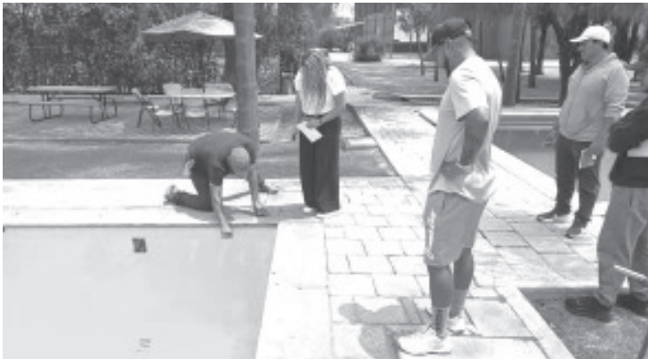
La Secretaría de Salud de Michoacán (SSM), a través de la Comisión Estatal para la Protección contra Riesgos Sanitarios (Coepris), intensificó la supervisión, capacitación y saneamiento para garantizar la calidad del agua, como parte de las acciones de la Cuarta Semana Nacional contra Riesgos Sanitarios.

- Se realizaron talleres de cloración, charlas informativas y una jornada de limpieza en playa Eréndira