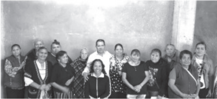
En un ambiente de alegría, respeto y reconocimiento, la asociación Creciendo Juntos Con Amor Y Servicio A.C. llevó a cabo un festejo especial con motivo del Día de las Madres, evento que destacó por su calidez humana y por la presencia de invitados que comparten la visión de servicio a la comunidad.

Zitácuaro, Michoacán. – En un ambiente de alegría, respeto y reconocimiento, la asociación Creciendo Juntos Con Amor Y Servicio A.C. llevó a cabo un festejo especial con motivo del Día de las Madres, evento que destacó por su calidez humana y por la presencia de invitados que comparten la visión de servicio a la comunidad.