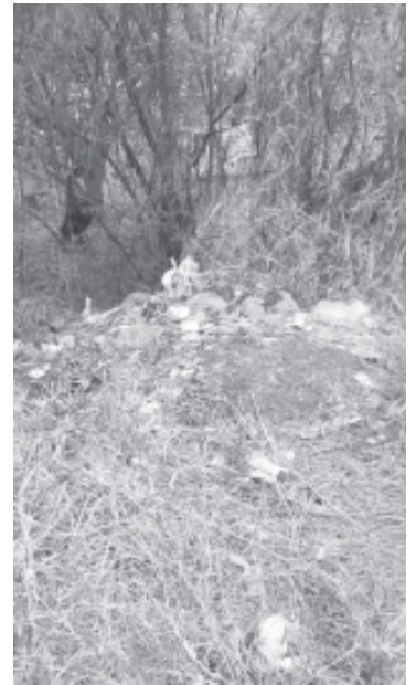
Habitantes del Módulo Revolución denunciaron que el predio ubicado a un costado de la salida a Tuzantla, sobre el boulevard Suprema Junta Nacional Americana, fue convertido en un tiradero a cielo abierto que crece día con día.

documentarán con fotos y videos a quienes tiren basura en la zona para exhibirlos en redes sociales y etiquetar a las autoridades. Insistieron en que no se debe normalizar vivir entre desechos y urgieron una respuesta inmediata del Ayuntamiento