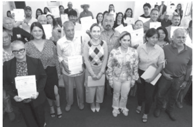
La Secretaría de Desarrollo Económico (Sedeco) entregó 40 registros de marca a las y los emprendedores de Zitácuaro, como parte de la estrategia para fortalecer la protección legal de sus productos y servicios.

El Gobierno de Michoacán, a través de la Sedeco, impulsa una visión en la que el crecimiento económico se construye mediante el fortalecimiento de proyectos locales, los cuales, con su registro de marca, avanzan hacia la formalidad y generan mayor proyección en nuevos mercados.