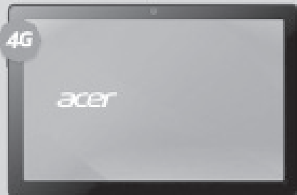
ACER Sospiro AS10L

Las mejores Tablets para navegar con la Red de mayor Cobertura y Velocidad