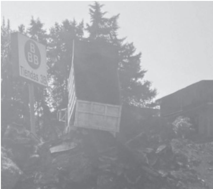
Vecinos de la calle Congreso de Chilpancingo, que esta ubicado a un costado de la unidad Deportiva La Joya, camino a San Miguel Chichimequillas exigen que no se siga tirando escombros en la parte alta de la calle, ya que a corto plazo puede ocasionar alguna tragedia.

H. Zitácuaro, Michoacán, 24 de abril de 2026.- Por: Guadalupe Solache Rebollo.- Vecinos de la calle Congreso de Chilpancingo, que esta ubicado a un costado de la unidad Deportiva La Joya, camino a San Miguel Chichimequillas exigen que no se siga tirando escombros en la parte alta de la calle, ya que a corto plazo puede ocasionar alguna tragedia.