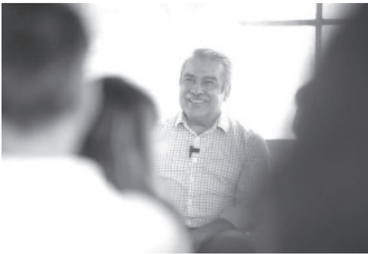
De cara al proceso electoral de 2027, el panorama político en Michoacán arroja un claro favorito, Raúl Morón Orozco, esto de acuerdo a los datos más recientes de la casa encuestadora Statistical Research Corporation (SRC), que lo posiciona como el perfil que supera con amplitud a cualquier adversario de la oposición y consolida la continuidad de la Cuarta Transformación en la entidad.

Finalmente, la encuesta de SRC midió la intención de voto por partido político, que reafirmó que MORENA es la fuerza política hegemónica en Michoacán con un 40.4% de simpatías. Muy por debajo se encuentran las candidaturas independientes (16.8%) y el PAN (11.3%), mientras que partidos como el PRI y MC no logran superar el umbral del 5%.