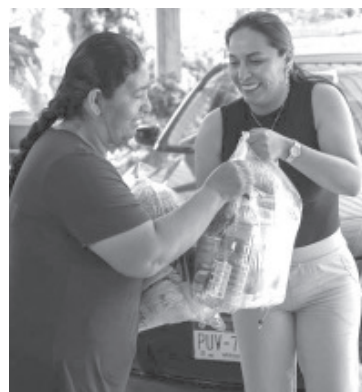
La Diputada Federal Mary Carmen Bernal Martínez continúa apoyando a la ciudadanía del Distrito 03 con programas que apoyan la economía familiar.

Para mayores informes sobre el programa 'Barriguita Llena corazón contento' pueden acudir a la casa de gestión de la diputada ubicada en Zitácuaro en la calle 5 de mayo norte #110 o a través de sus redes sociales.