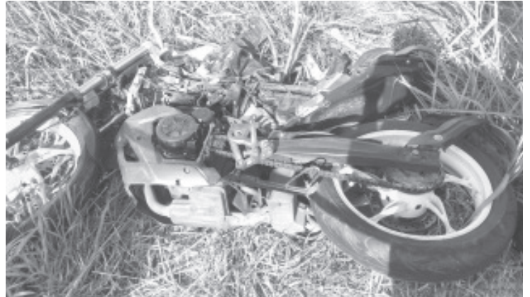
Un motociclista perdió la vida tras ser impactado por una camioneta en la comunidad de Zirahuato de los Bernal, ubicada en el municipio de Zitácuaro, informaron autoridades policiales.