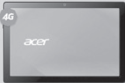
ACER Sospiro AS10L

Las mejores Tablets para navegar con la Red de mayor Cobertura y Velocidad