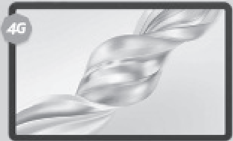
HONOR Pad X9A