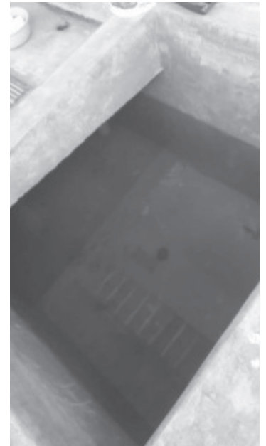
Habitantes de diferentes puntos de la ciudad denunciaron que el agua que llega a sus domicilios a través de la red del Sistema de Agua Potable y Alcantarillado de Zitácuaro SAPA presenta olor a drenaje, coloración turbia y residuos, situación que persiste desde hace al menos 15 días.

Por parte del Gobierno Municipal, emitieron un comunicado informando la situación así como el aviso de que no habrá servicio en diferentes colonias mientras se hacen los trabajos de reparación que se necesitan, asimismo invitaron a afectados a que el agua al almacenada que tenga esta condición a no usarla para actividades de aseo personal.