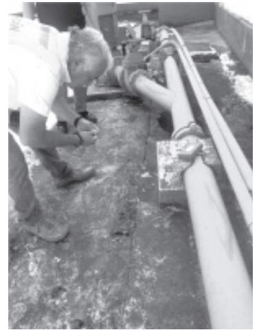
La Comisión Estatal para la Protección contra Riesgos Sanitarios (COEPRIS) trabaja de forma conjunta con el SAPA para atender el problema que existe en el manantial El Cedano que ha afectado a diferentes colonias.

Arriaga Mondragón señaló que el área jurídica de COEPRIS intervendrá conforme corresponda para proteger a la población, mientras tanto pidió a los ciudadanos reportar cualquier anomalía: