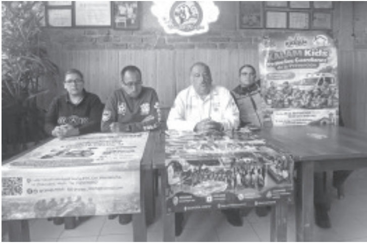
Para reforzar la seguridad y reducir riesgos ante emergencias, el Agrupamiento Kalam, integrado por Protección Civil Estatal y grupos de auxilio, puso en marcha una estrategia integral que busca “blindar” al municipio con capacitación, respuesta inmediata y participación ciudadana.

H. Zitácuaro, Michoacán, 22 de abril de 2026.- Para reforzar la seguridad y reducir riesgos ante emergencias, el Agrupamiento Kalam, integrado por Protección Civil Estatal y grupos de auxilio, puso en marcha una estrategia integral que busca “blindar” al municipio con capacitación, respuesta inmediata y participación ciudadana.