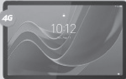
LENOVO Tab M11 + Case de regalo