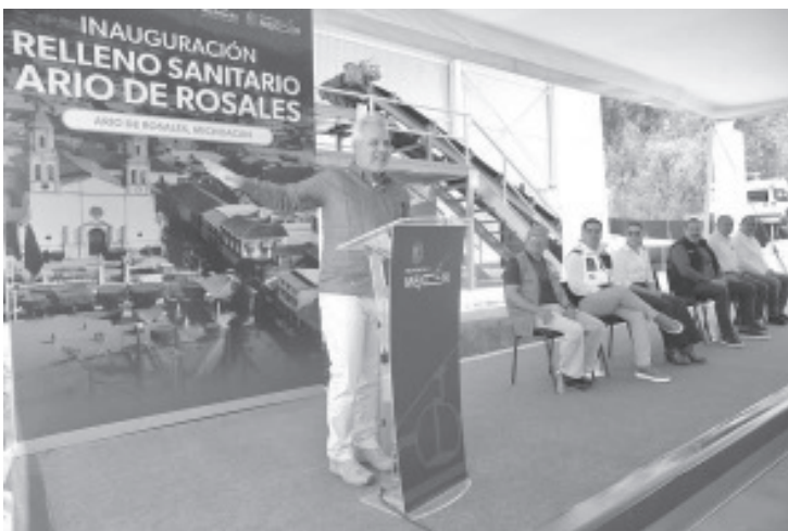
Lo que antes representaba un problema de contaminación, hoy se convierte en una fuente de empleo y oportunidades para el municipio de Ario, con el Centro Integral para el Tratamiento de Residuos Sólidos que inauguró el gobernador Alfredo Ramírez Bedolla.