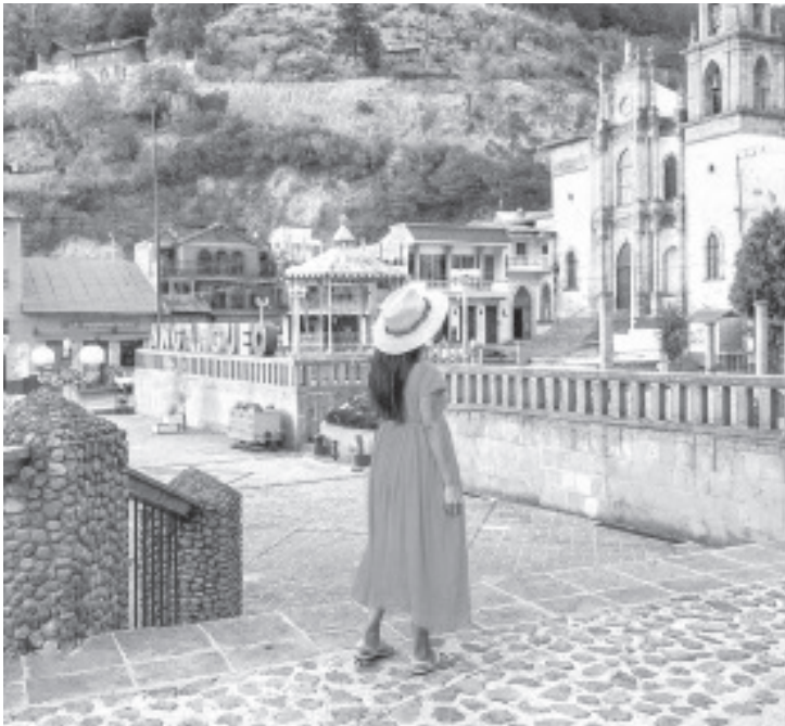
La Secretaría de Turismo de Michoacán (Sectur) en coordinación con el Centro Nacional de Evaluación para la Educación Superior (Ceneval) anunció la jornada de profesionalización “Inglés para el Turismo 2026”, orientada a fortalecer la competitividad del sector turístico en el ámbito internacional.

- Desde cocineras tradicionales hasta transportistas recibirán capacitación con validez oficial