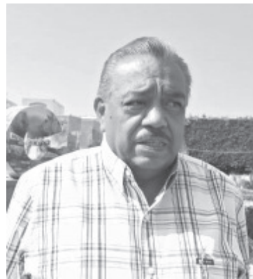
La coordinación con autoridades ejidales y comunales, junto con la aplicación de quemas prescritas y controladas, ha permitido mantener en casi cero los incendios forestales en el municipio, informó Pedro Mondragón López, titular de la Secretaría de Medio Ambiente y Recursos Naturales.

El funcionario reiteró el llamado a ejidatarios y comuneros a seguir reportando sus quemas agrícolas, pues la prevención conjunta ha dado resultados positivos para proteger los bosques del municipio.