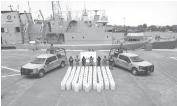
La Secretaría de Marina, a través de la Armada de México, logró el aseguramiento de una embarcación menor, con tres presuntos infractores, quienes no pudieron acreditar la procedencia legal de 103 bidones con combustible presuntamente ilegal.

Los tres presuntos infractores y lo asegurado fueron puestos a disposición de las autoridades competentes, con el fin de integrar la carpeta de investigación correspondiente.