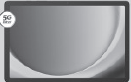
SAMSUNG Galaxy Tab A9+