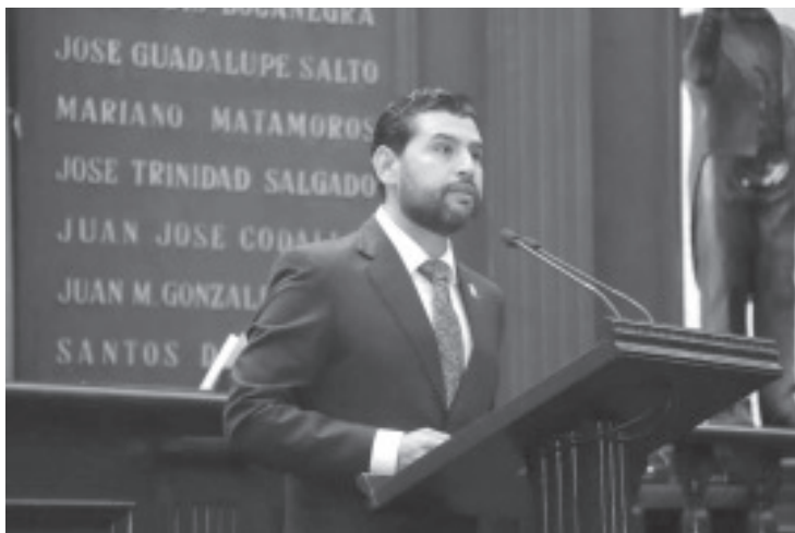
El diputado del PRD, Octavio Ocampo, presentó ante la 76 Legislatura del Congreso del Estado una iniciativa para evitar que personas servidoras públicas intervengan en la vida interna de los sindicatos y en la elección de sus dirigencias. La propuesta busca garantizar que las y los trabajadores tomen sus decisiones de manera libre, sin presiones ni uso de recursos públicos.

Octavio Ocampo destacó que la iniciativa no interviene en la vida interna de los sindicatos, sino que fortalece su autonomía y cumple con la obligación del Estado de armonizar su legislación. “Esta propuesta responde a un mandato federal y es obligación del Estado de Michoacán realizar esta armonización legislativa para garantizar la democracia sindical. Se busca que las decisiones de las y los trabajadores se tomen con libertad y sin intervención del poder público”, concluyó.