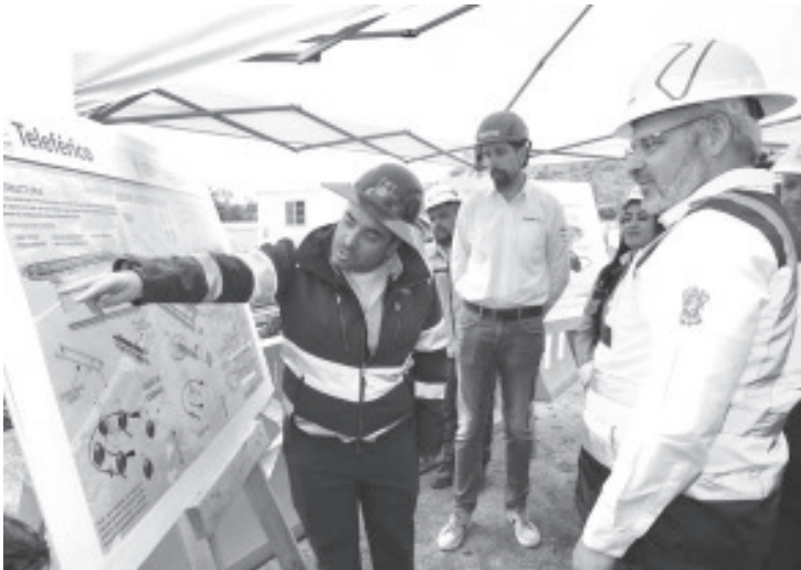
El gobernador Alfredo Ramírez Bedolla, anunció que la construcción del teleférico de Morelia presenta un 68 por ciento de avance, confirmando que el proyecto será inaugurado y entrará en operación este mismo año.

El gobernador adelantó que, una vez concluida esta fase, que conecta puntos estratégicos como la Central de Autobuses, las colonias Eduardo Ruiz y Primo Tapia Poniente, así como el Obelisco a Lázaro Cárdenas, Ciudad Universitaria y el Zoológico de Morelia, se tiene proyectada una segunda etapa que extenderá el servicio hasta la tenencia de Santa María, consolidando así un sistema de transporte integral y de vanguardia para las y los morelianos.