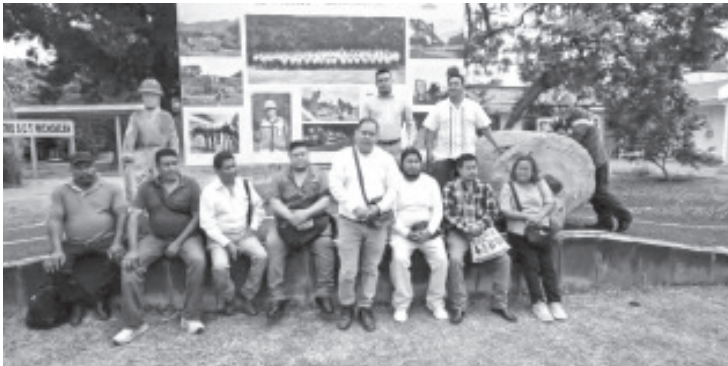
Representantes de las tenencias de Zitácuaro se trasladaron a Morelia para exigir que se reubique la rampa de frenado de emergencia de la autopista Lengua de Vaca, luego de múltiples percances registrados en el tramo del Polvorín.

Los jefes de tenencia llamaron a la población a sumarse a la petición y mantener la presión ciudadana hasta que se concrete la obra, al considerarla un tema de seguridad colectiva que no admite esperas.