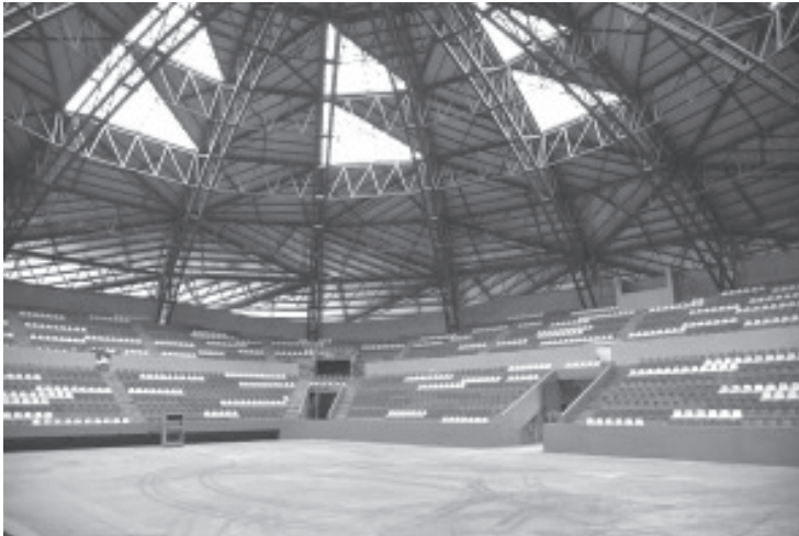
La Secretaría de Comunicaciones y Obras Públicas (SCOP) concluyó la rehabilitación integral del auditorio del Complejo Deportivo Bicentenario, enfocándose en la recuperación técnica de su domo, con recursos del Fondo de Aportaciones Estatales para la Infraestructura de los Servicios Públicos Municipales (Faeispum).

- La autoridad municipal continúa con el trabajo de los detalles interiores