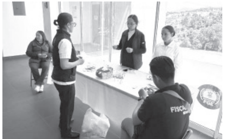
Como parte de las acciones orientadas al fortalecimiento del bienestar integral del personal, la Fiscalía General del Estado (FGE), a través de la Coordinación de Previsión y Salud, llevó a cabo una jornada de salud en las instalaciones de la Fiscalía Regional de Zitácuaro, con la finalidad de acercar servicios médicos preventivos y promover hábitos saludables entre las y los trabajadores.