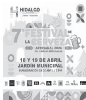
La séptima edición del Festival de Cerveza Artesanal reunirá a 12 productores en el jardín principal del municipio de Hidalgo, el 18 y 19 de abril. Además, se realizará el Rally Epic Motors Sports Cumbres de Hidalgo, informó la Secretaría de Turismo de Michoacán (Sectur), dependencia dirigida por Roberto Monroy García.