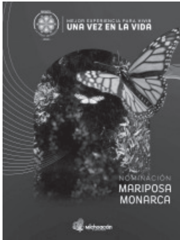
La majestuosidad de la Mariposa Monarca posiciona nuevamente a Michoacán en el escenario nacional e internacional, tras ser nominado a los premios Lo Mejor de México 2026.

- En la categoría Mejor experiencia para vivir una vez en la vida