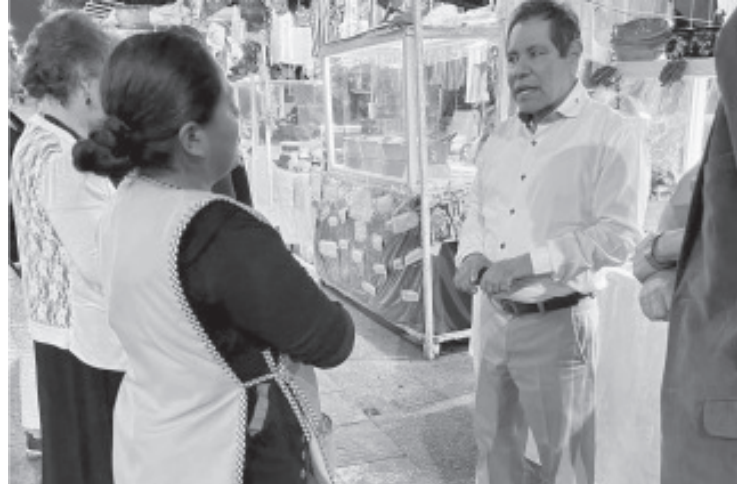
Los productores y vendedores de frutas en conserva, alimento, postre y golosina tradicional que ha logrado importante aceptación a nivel local, estatal y hasta en otros países, recibieron consejos y orientación sobre cómo mejorar su trabajo, distribuirlo y mejorarlo.

Pichardo invitó a la sociedad a cuidar a las abejas y a no matarlas cuando lleguen a sus hogares. "No las maten, no las acaben", dijo. "Llámennos, nosotros las cuidaremos", aseguró, ya que cuando llegan a alguna casa, por el miedo que tienen de algún piquete les avientan agua con jabón para espantarlas.