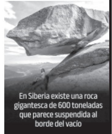
En Siberia existe una roca gigantesca de 600 toneladas que parece suspendida al borde del vacío

Apoyada sobre un punto mínimo al borde de un precipicio, da la impresión de que caerá con el más leve empujón. Sin embargo, ha mantenido ese delicado equilibrio durante miles de años, convirtiéndose en una de las formaciones naturales más sorprendentes de la región.