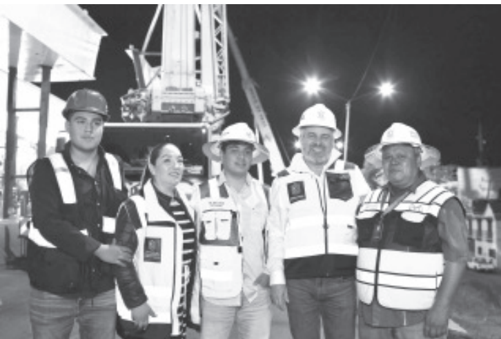
Tras la reforma constitucional aprobada por el Senado que reduce la jornada laboral de 48 a 40 horas a la semana, el gobernador Alfredo Ramírez Bedolla señaló que este es un paso decisivo hacia la justicia social y el bienestar de todas y todos los trabajadores.

La reforma también establece que el trabajo extraordinario voluntario será de 12 horas a la semana, y las personas menores de 18 años, no podrán desarrollar tiempo extraordinario.