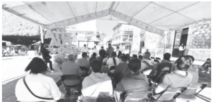
Por segunda ocasión, en el centro de la ciudad se instaló un módulo de vacunación para atender a la población y reforzar las acciones de inmunización.

Hay que mencionar que la instalación de este puesto de vacunación, se debió a la coordinación del municipio con el nivel estatal y federal de salud; es una medida por reducir el riesgo que existe de casos de sarampión, ya que a nivel estado ha ido aumentando la presencia de esta enfermedad viral y las autoridades han dejado claro que la mejor forma de prevenir es la vacunación.