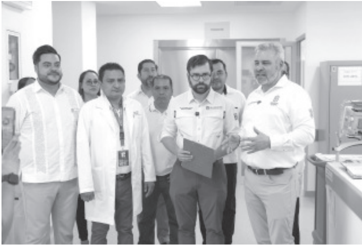
Michoacán cuenta con 771 mil vacunas disponibles para la prevención del sarampión, las cuales se encuentran en los 364 centros de salud de la entidad, así lo señaló el gobernador Alfredo Ramírez Bedolla.