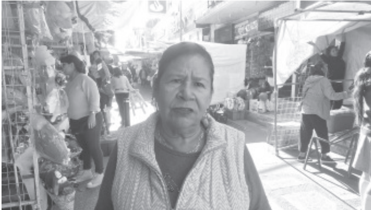
Con motivo del Día de Amor y la Amistad que se celebra cada año, comerciantes de temporada se instalaron en el centro de la ciudad: sobre la 5 de mayo, Lerdo de Tejada y Dr. Emilio García.

- Se instalan comerciantes en 5 de mayo, Lerdo de Tejada y Dr. Emilio García