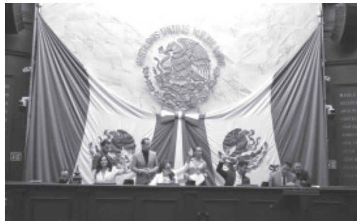
Con el objetivo de fortalecer los mecanismos de seguridad vial, ahora las personas mayores de 80 años que soliciten la expedición o renovación de licencias y permisos para conducir deberán acreditar mediante evaluaciones médicas y psicológicas, así como una prueba práctica de manejo, que conservan las capacidades físicas, sensoriales, cognitivas y psicomotrices necesarias para conducir de manera segura.

Finalmente, el Pleno Legislativo puntualizó que la regulación diferenciada para personas mayores de 80 años no constituye discriminación, sino una acción normativa de protección reforzada, orientada a salvaguardar su integridad, autonomía y dignidad, sin imponer prohibiciones automáticas ni efectos retroactivos.