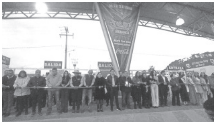
En un ambiente de fiesta y celebración, el Presidente Municipal de Zitácuaro, Juan Antonio Ixtláhuac, inauguró hoy, la Feria "Monarca Fest 2026" un evento que busca promover la cultura, la tradición y el turismo en la región, coincidiendo con la temporada de hibernación de la Mariposa Monarca.