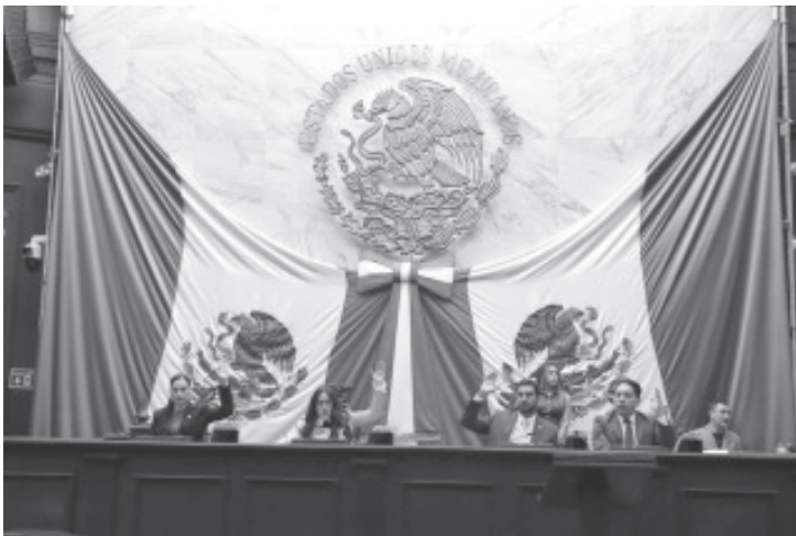
La Septuagésima Sexta Legislatura, aprobó por unanimidad declarar el ha lugar para admitir a discusión, una iniciativa que pretende reformar la Constitución del Estado de Michoacán, con la finalidad de establecer la prohibición general para contratar deuda pública de largo plazo que rebase el periodo constitucional de la administración en funciones, tanto para los ayuntamientos, como para el Poder Ejecutivo del Estado.

Con esta apertura para estudiar, analizar y discutir esta iniciativa enviada al Poder Legislativo por el titular del Ejecutivo Estatal, el Congreso del Estado, ratifica su compromiso de legislar en favor de Michoacán y su gente, además de que refrenda su institucionalidad para trabajar de manera coordinada con el Ejecutivo.