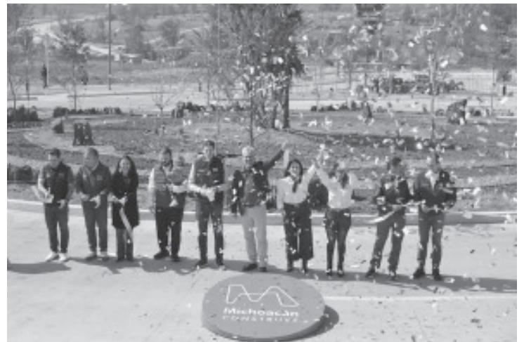
La recién inaugurada avenida Amalia Solórzano, en el sur de Morelia, tendrá una vida útil superior a los 50 años, gracias a que fue construida con materiales de alta calidad, durables y resistentes, destacó el gobernador Alfredo Ramírez Bedolla.

La avenida Amalia Solórzano beneficiará de manera directa a las y los habitantes de las tenencias Morelos, Jesús del Monte, Santa María y San Miguel del Monte, y de 86 colonias vecinas, así como a 6 mil 162 estudiantes y 2 mil 189 docentes de 35 instituciones educativas ubicadas en la zona.