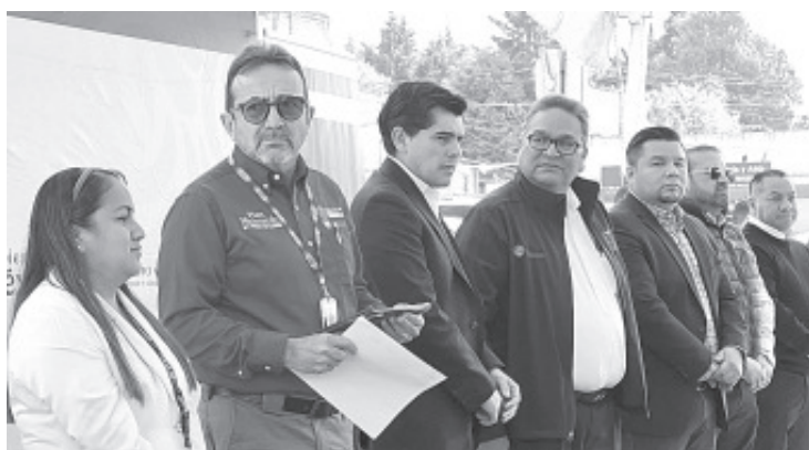
Autoridades federales, estatales y municipales atestiguaron la conformación del Comité Ciudadano Proconstrucción del Hospital del IMSS en esta ciudad.

El comité ciudadano quedó conformado por zitacuarenses representantes de diferentes sectores.