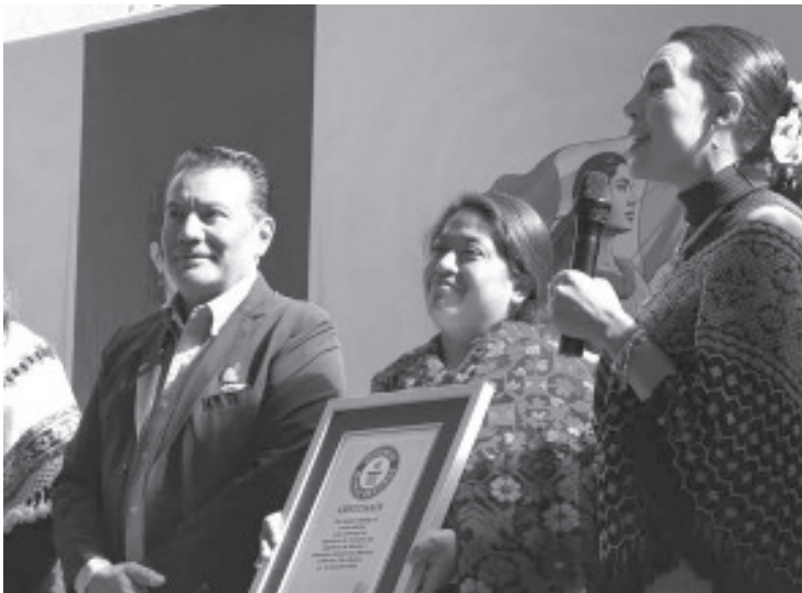
México logró el récord Guinness por la exposición de bordados más grande del mundo, el acervo compuesto por más de 3 mil 800 piezas artesanales, representa la unidad y diversidad de los 32 estados del país, reafirmando la excelencia de los saberes tradicionales de Michoacán y de todo México.