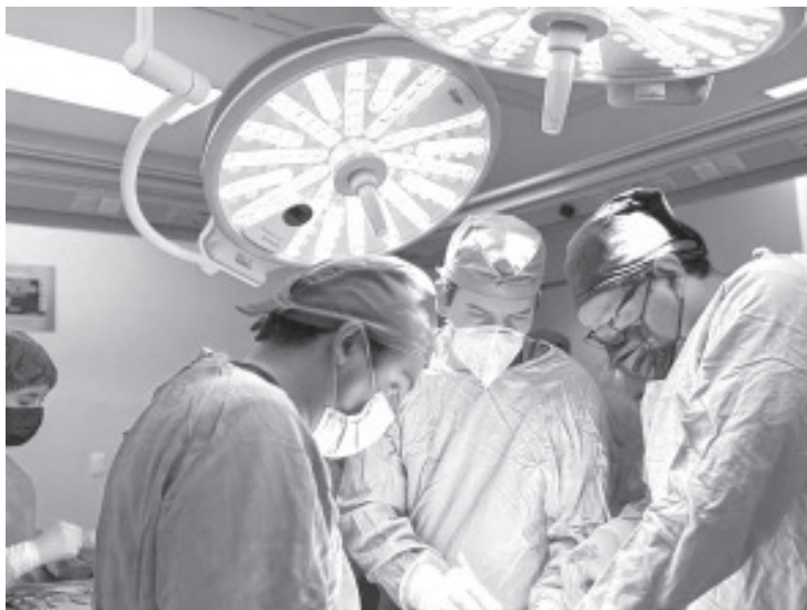
El equipo multidisciplinario del Hospital General "Dr. Miguel Silva", de la Secretaría de Salud de Michoacán (SSM), llevó a cabo la procuración multiorgánica de un donante de 33 años de edad originario de Pátzcuaro.

- Se concretó la donación de corazón, hígado, riñones, córneas y piel