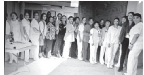
¡MUCHAS FELICIDADES! A todas LAS ENFERMERAS Que Celebraron su DÍA En este 6 de ENERO DE LA CLÍNICA HOSPITAL DEL ISSSTE ZITÁCUARO.