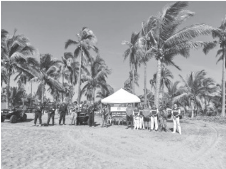
La Operación Salvavidas Invierno 2025 avanza con reforzamiento en las principales playas de Lázaro Cárdenas, donde corporaciones de los tres órdenes de gobierno mantienen presencia constante ante el incremento de turistas por la temporada decembrina.