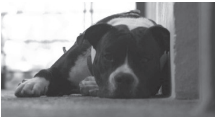
La Secretaría del Medio Ambiente hace un llamado a la población para evitar el uso de pirotecnia durante los festejos decembrinos, ante los efectos negativos que tienen en la biodiversidad y ecosistemas del estado.

En el caso de los animales domésticos, los perros son los más vulnerables con el uso de pólvora, ya que altera su comportamiento, sufren infartos o huyen de sus casas por ataques de nervios. Por ello, la Secretaría del Medio Ambiente recomienda a la población celebrar en estas fechas de manera responsable para cuidar también de la flora y la fauna.