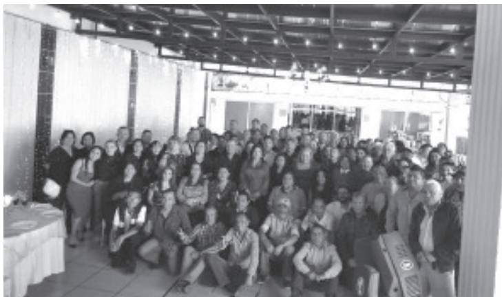
El Sindicato de Empleados del H. Ayuntamiento de Zitácuaro (S.E.H.A.Z.) llevó a cabo su Convivio Navideño 2025, un espacio de encuentro, convivencia y reconocimiento para las y los trabajadores del Ayuntamiento de la Heroica Zitácuaro.

Zitácuaro, Mich., 23 de diciembre de 2025.- El Sindicato de Empleados del H. Ayuntamiento de Zitácuaro (S.E.H.A.Z.) llevó a cabo su Convivio Navideño 2025, un espacio de encuentro, convivencia y reconocimiento para las y los trabajadores del Ayuntamiento de la Heroica Zitácuaro.