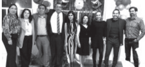
POSADA ANUAL 2025. Organizada por el Personal de las SALAS COLEGIADAS Juzgados en Materia CIVIL y FAMILIAR Del Dto. de ZITÁCUARO. ;FELICITACIONES A TODOS!."