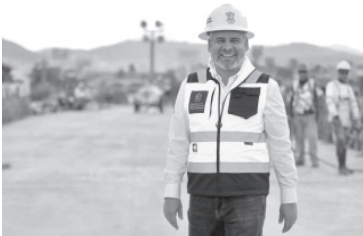
Sin necesidad de generar deuda pública, Michoacán alcanzó en 2025 una inversión histórica de 40 mil millones de pesos en obras de infraestructura para todo el estado, destacó el gobernador Alfredo Ramírez Bedolla.

Mientras que para la Universidad Michoacana de San Nicolás de Hidalgo (UMSNH), la inversión se ha visto reflejada en la rehabilitación y construcción de campus en Zamora, Uruapan y Huetamo.