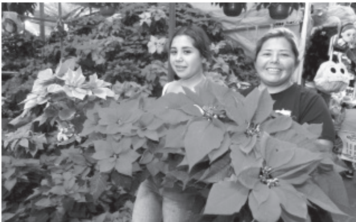
Con una producción anual de ocho millones de plantas, Michoacán se ubica en el segundo lugar nacional en el cultivo de flores de Nochebuena, un regalo que México le dio al mundo, destacó el gobernador Alfredo Ramírez Bedolla.

El rojo es el color predominante y con mayor demanda, representa aproximadamente el 90 por ciento de la producción y el consumo en el mercado nacional. El resto se diversifica en tonos como rosa, blanco, amarillo, mármol y jaspeado.