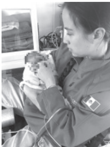
Una operadora del C5 Michoacán de la Secretaría de Seguridad Pública (SSP) brindó indicaciones de primeros auxilios a familiares de un bebé con complicaciones respiratorias; maniobras de atención inmediata que lograron preservar su vida para posteriormente recibir atención especializada.

El personal especializado del C5i Michoacán se encuentra permanentemente alerta para brindar auxilio. A través de las líneas 911 Emergencias y 089 Denuncia Anónima, se garantiza atención profesional las 24 horas del día.