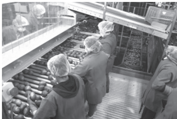
La Secretaría de Desarrollo Económico (Sedeco) informó que el Certificado Laboral para la Agroexportación iniciará operaciones el 1 de abril de 2026 a través de la plataforma VELAGRO.