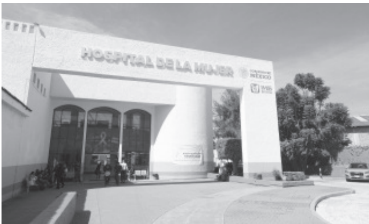
La Secretaría de Salud de Michoacán (SSM) garantiza la continuidad operativa y la cobertura médica ininterrumpida en sus unidades hospitalarias durante las festividades de Navidad y Año Nuevo.

La SSM reafirma su compromiso de brindar servicios de salud oportunos a la población, al tiempo que exhorta a la ciudadanía a extremar medidas preventivas contra la influenza, el COVID-19 y otras enfermedades respiratorias propias de la temporada invernal.