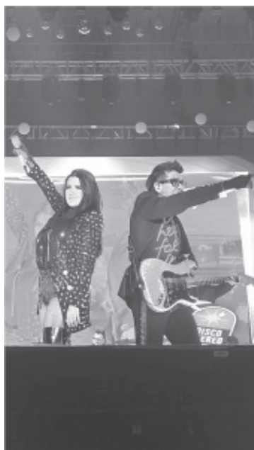
La noche de este domingo la Arena Heroica de Zitácuaro se convirtió en el escenario de un espectáculo vibrante con la presentación del grupo Matute.