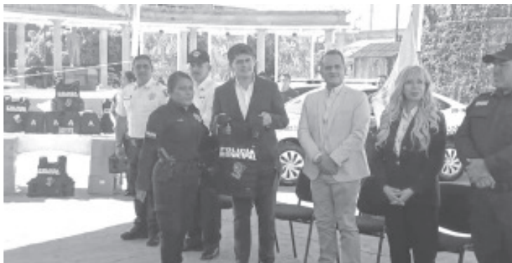
Con miras a fortalecer a la Policía Municipal, Juan Antonio Ixtláhuac Orihuela alcalde de Zitácuaro entregó patrullas, equipo así como uniformes para la corporación.

"Tenemos dos funciones: servirles a la gente y luchar contra la inseguridad", finalizó el edil.