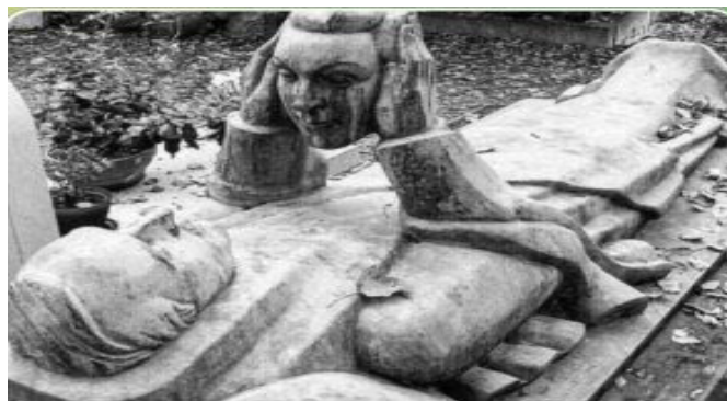
La tumba del músico y actor Fernand Arbelot, quien pidió como último deseo mirar el rostro de su esposa para siempre después de su muerte.