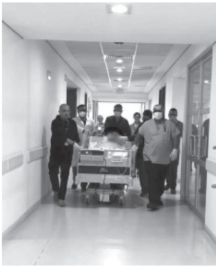
Joven de 25 años que perdió la vida en un accidente de motocicleta, dio vida a cuatro personas que recibirían una nueva oportunidad, gracia a la donación de sus órganos.

La Secretaría de Salud de Michoacán reconoce la decisión solidaria de la familia del donador y reitera el llamado a dialogar en familia sobre la donación de órganos, un acto que puede transformar la vida y la historia de otras personas.