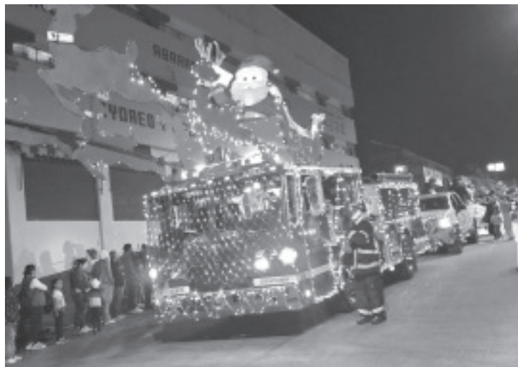
La tarde noche de este sábado se encendió de luces, colores y música cuando el tradicional Desfile Navideño tomó las calles de la ciudad. Más de 30 instituciones y empresas de todos los giros se unieron para regalar a la comunidad un espectáculo que quedará en el recuerdo de grandes y chicos.