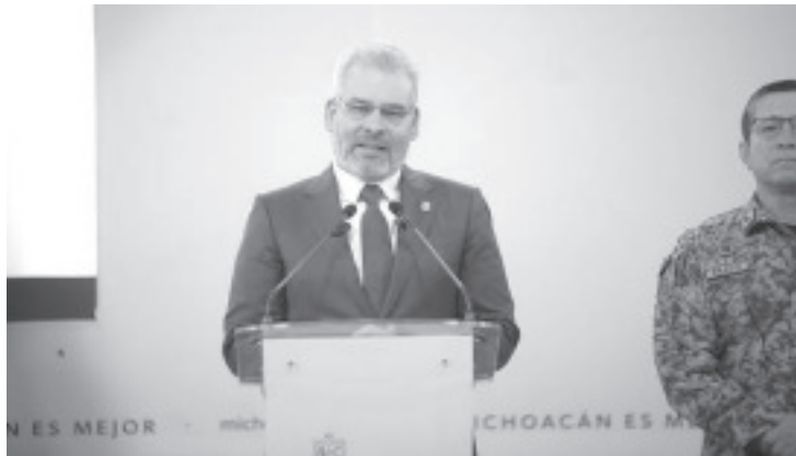
Con 60 casos de homicidio doloso ocurridos durante el mes de noviembre, como parte del Plan Michoacán el estado registró la cifra más baja durante los últimos 10 años, así lo refirió el gobernador Alfredo Ramírez Bedolla.

ascenso descontrolado en este delito, ya que en ese año ocurrieron 964 casos, y en el 2021 fueron 2 mil 761 hechos, pero desde entonces, la tendencia es a la baja.