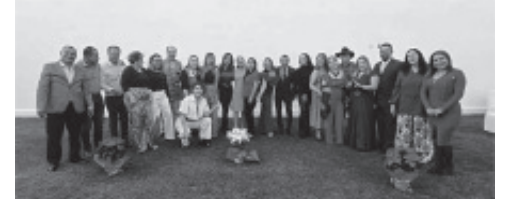
CUMPLIERON Su 30 ANIVERSARIO El Grupo Profesional en CONTADURÍA PÚBLICA De la ASOCIACIÓN A.C.- ZITÁCUARO El 28 de noviembre en el Salón el «SAUZI» CELEBRARON Con una COMIDA. ¡FELICIDADES!