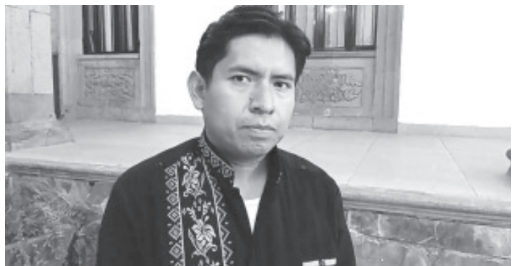
Con el fin de rescatar la originalidad de lo que es el baile de tierra caliente, el próximo sábado 6 de diciembre a las 5:00 de la tarde en la Casona de la Estación, se llevará a cabo el Primer Concurso de Baile en Pareja de Tierra Caliente.

Asimismo, agregó que el evento será abierto al público, tendrá una duración de 5 horas aproximadamente y promete ser una actividad interesante digna de ser vista por los zitacuarenses a los que les interesa el tema del folklora.