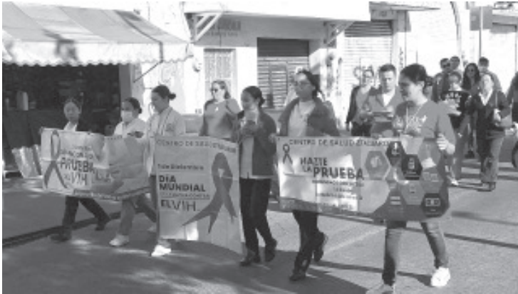
Representantes del sector salud así como estudiantes de enfermería conmemoraron el Día Mundial de la Lucha contra el VIH Sida con una marcha de concientización de esta enfermedad.

- Llevan a cabo marcha de concientización