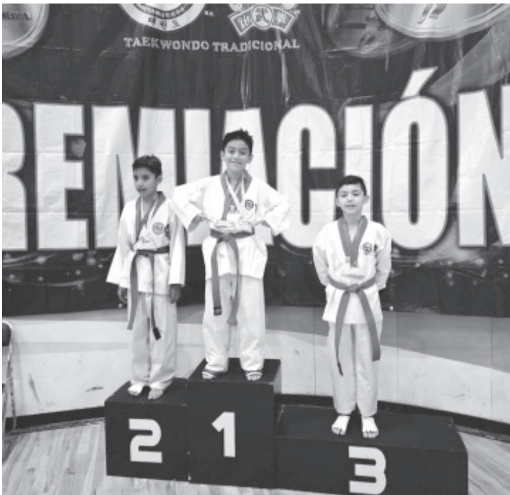
La Escuela de Tae Kwan Do "Moo Duk Kwan" participó en el Torneo Nacional de Escuelas y cosecho diferentes exitos, ya que los alumnos regresaron con medallas.

Cualquier duda, comuníquese vía WhatsApp al 715 145 8430.