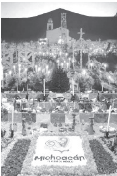
La Noche de Muertos en Michoacán conquista al mundo entero por la cosmogonía purépecha, y eso está quedando en claro en el Parque Xcaret, donde “el alma de México” cautiva al mundo entero que ve esta representación que se encuentra por distintas áreas de este recinto.

También la presencia de cocineras tradicionales, artesanos y artistas continúa atrayendo la mirada de los más de 50 mil asistentes que se esperan para estos días.