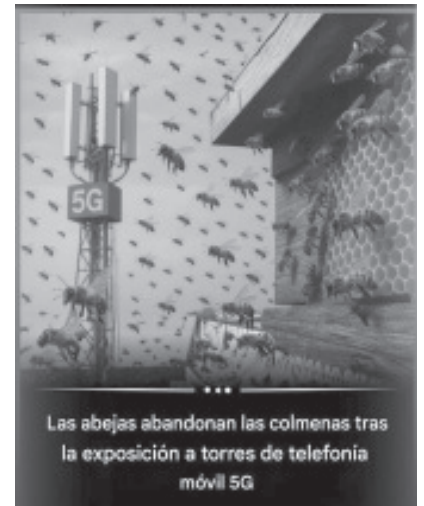
Las abejas abandonan las colmenas tras la exposición a torres de telefonía móvil 5G

Publicado por Gaston Rubinski M. Cuando la señal se eleva, las abejas desaparecen. En una observación preocupante que ha provocado un debate global, los investigadores han informado que las abejas melíferas están abandonando sus colmenas cuando se exponen a una fuerte radiación electromagnética de las torres de teléfonos móviles 5 Lo que estaba destinado a conectar el mundo podría estar interrumpiendo sile