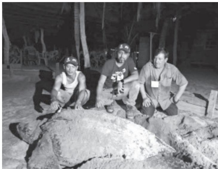
La Comisión de Pesca de Michoacán (Compesca), en coordinación con recolectores del campamento Taracosta, reportó el arribo del primer ejemplar de tortuga laúd ( Dermochelys coriacea ) de la temporada de anidación 2025-2026. Este hecho, ocurrido en las playas de Playa Azul, Lázaro Cárdenas, subraya el trabajo coordinado en favor de la conservación de esta especie.

La Compesca invita a la ciudadanía y visitantes a contactar y visitar los campamentos tortugueros para vivir la experiencia del desove y liberación de tortugas marinas. Esta actividad permite conocer de cerca el esfuerzo de conservación de las especies laúd, golfina y negra, que son emblema de Michoacán.