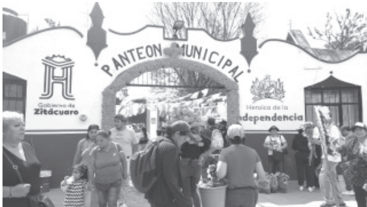
Como marca la tradición de día de muertos, miles de personas abarrotaron los panteones del municipio para visitar la tumba de sus familiares este 1 y 2 de noviembre. En el caso de la zona urbana, el Panteón Municipal San Carlos desde las primeras horas del día registro la presencia de visitantes a este lugar.

Al término de los días principales de la celebración que son el 1 y 2 de noviembre, el panteón se llenó de vida y color con los diferentes arreglos, ramos, coronas y más.