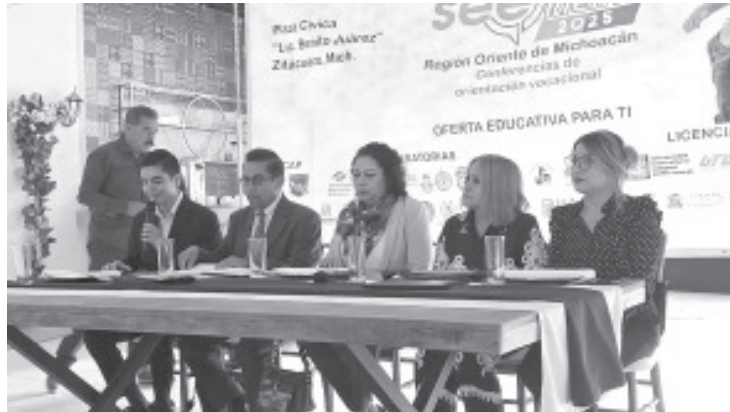
Con el propósito de brindar orientación vocacional a alumnos de secundaria y preparatoria, se llevará a cabo el evento See Orienta 2025.

Durante la conferencia, los representantes de las instituciones educativas participantes, reiteraron el compromiso de llevar la información necesaria a los jóvenes, ya que si reciben la orientación vocacional, les da mayor oportunidad de que estudien y terminen satisfactoriamente.