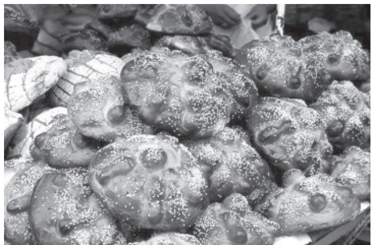
Con la participación de más de 30 productores, este jueves comenzó la Feria de Pan de Muerto con motivo de la celebración de Día de Muertos. Desde el este 30 de octubre y hasta el 3 de noviembre los panaderos tradicionales está en la plaza cívica Licenciado Benito Juárez.