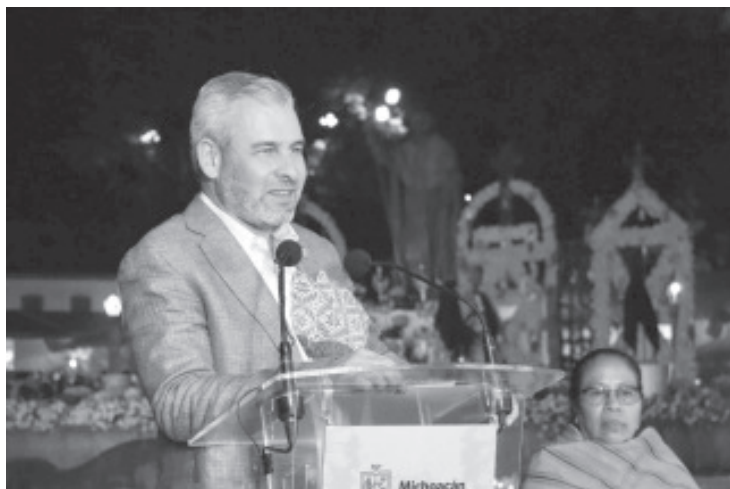
El gobernador michoacano, Alfredo Ramírez Bedolla, informó que el esplendor de la Noche de Muertos conquistará el viejo continente con la representación de un panteón purépecha y altar monumental que el Gobierno de Michoacán instalará durante el mes de noviembre en la Embajada de México en España.

Miles de familias de comunidades indígenas adornan las tumbas de sus difuntos. Las visten con aromáticas flores de cempasúchil, o esparcen sus pétalos sobre las lápidas, encienden velas para facilitar el retorno de las almas a la tierra, y sirven la comida y las bebidas favoritas de los difuntos para alimentarlos después del camino recorrido.