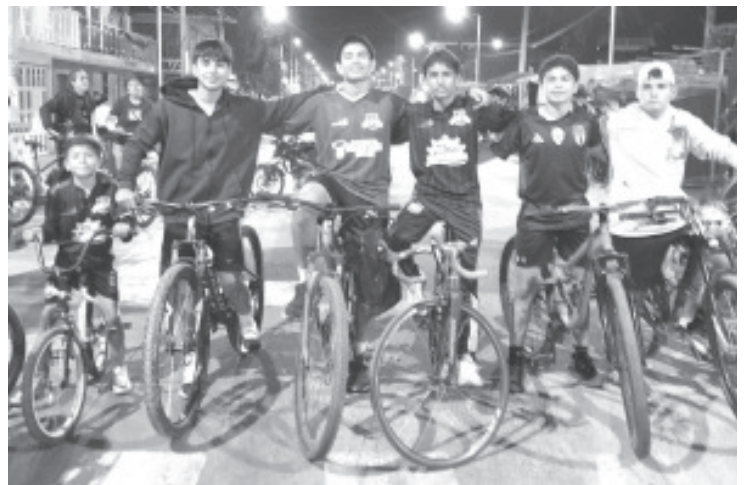
La Rodada del Terror que se realizó la noche de este jueves causó la curiosidad de Zitacuarenses de todas las edades y los motivó a participar en esta actividad llena de emoción y misterio.

El recorrido incluyó un trayecto por las calles Hidalgo, Revolución, Zaragoza, Benedicto López, Degollado y Juan de Dios Peza y el punto final fue cruzar el pasillo principal del cementerio.