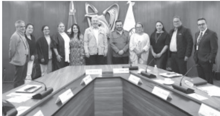
A septiembre de este año, Michoacán registró 499 mil 134 personas afiliadas al Instituto Mexicano del Seguro Social (IMSS), lo que representa un incremento de 7 mil 768 puestos en comparación al mes de agosto, informó el gobernador Alfredo Ramírez Bedolla.

“Es un avance sostenido hacia la generación de trabajo formal en Michoacán, siendo el comercio y los servicios los que concentraron casi la mitad del empleo formal en el estado”, comentó Ramírez Bedolla.