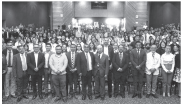
El Instituto Michoacano de Oncología, de la Secretaría de Salud de Michoacán (SSM), celebra tres décadas ininterrumpidas de servicio y compromiso con los pacientes michoacanos.

Con el firme respaldo del Gobierno de Michoacán, el Instituto Michoacano de Oncología continúa su proceso de expansión y modernización, consolidándose como un referente y reafirmando su liderazgo en la atención oncológica en la región.