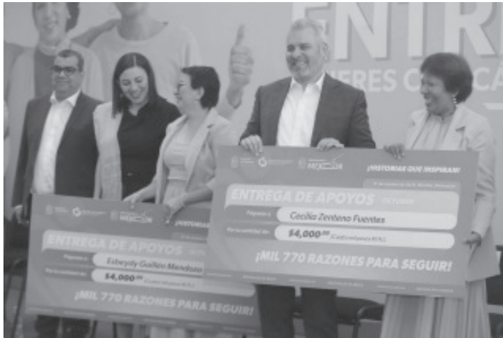
En Michoacán las mujeres no están solas, tienen apoyo para su tratamiento y se cuenta con tecnología de punta para tratar y detectar el cáncer, señaló el gobernador Alfredo Ramírez Bedolla al entregar mil 770 apoyos del Programa para el Bienestar de mujeres con cáncer de mama y cervicouterino invasor.