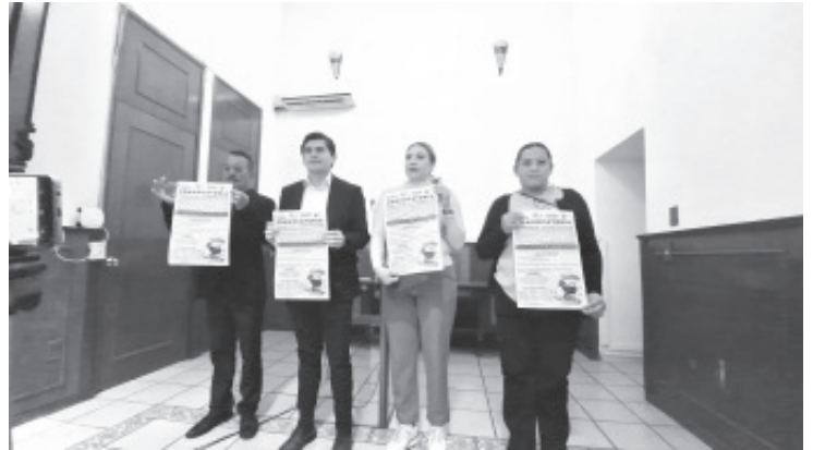
El próximo viernes 24 del presente mes en el centro de la ciudad, se realizará la "Feria de la Construcción", en la que negocios y empresas ofrecerán a los ciudadanos promociones, descuentos y hasta créditos en cuanto a material de construcción. Así lo anunció el Presidente Municipal Juan Antonio Ixtláhuac Orihuela,

El horario de atención será de 10:00 de la mañana a 4:00 de la tarde y cualquier zitacuarenses puede acudir, conocer los diferentes precios y preguntar por el material de construcción que requiera