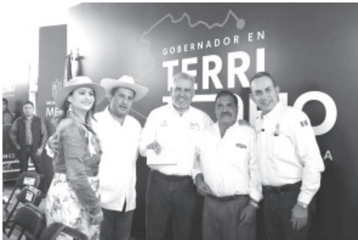
El gobernador Alfredo Ramírez Bedolla llevó audiencia pública al municipio de Uruapan para atender personalmente las necesidades de la población. Ahí anunció que avanza la ampliación a cuatro carriles de la autopista Siglo XXI y que próximamente se abrirá la circulación del tramo Pátzcuaro-Uruapan.

Durante la audiencia pública se desarrolló una feria de la salud, en la cual se aplicaron vacunas para la prevención de hepatitis b, sarampión, COVID- 19 e influenza, así como mediciones de glucosa, registro de presión arterial, toma de medidas de talla y peso, y difusión de recomendaciones para evitar la proliferación del dengue.