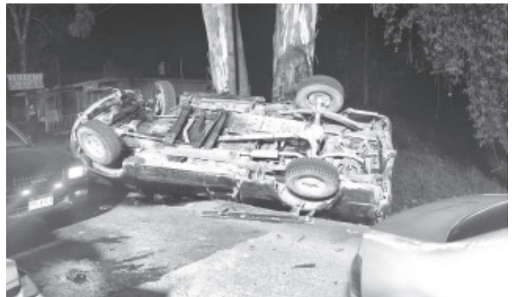
Dos hombres fallecieron y otros tres resultaron lesionados tras un aparatoso choque que protagonizaron un auto compacto y una camioneta sobre la carretera Zitácuaro-Morelia, informaron autoridades policiales.