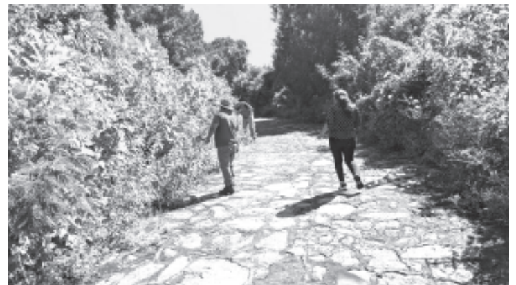
Con la participación de solo 7 personas, este domingo la Brigada Civil de Reforestación llevó a cabo su jornada de limpieza en el acceso a la zona Arqueológica de Ziráhuato -San Felipe los Alzati.

"Es normal, cuando no hay un beneficio personal inmediato el bien colectivo pasa a tercer lugar", expresó.