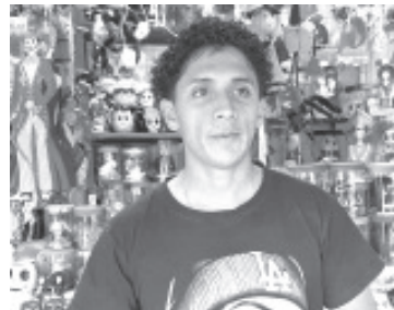
Para la celebración de Día de Muertos, ya se instalaron comerciantes de calaveras de chocolate y azúcar en el Jardín Constitución. Son en total 25 puestos los que estarán en este lugar a partir del 12 de octubre hasta el 3 del mes de noviembre.

Confirió que la respuesta sea positiva y las ventas de este año superen las anteriores ya que se trata de producto de calidad, a la altura de las exigencias de los ciudadanos.