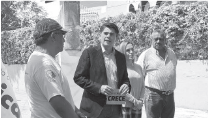
"Dentro de nuestra misión por recuperar espacios públicos, este espacio será remodelado, la Mora del Cañonazo y otros mas para que todos los sitios tengan este toque de jardín polinizador", expresó.