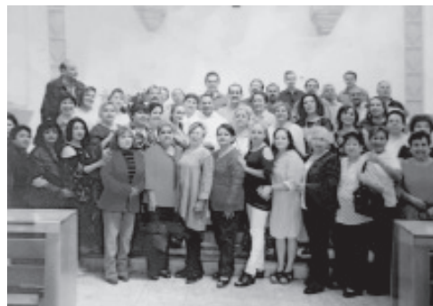
1º. DE OCTUBRE ¡DÍA DEL TRABAJADOR DEL ISSSTE! Trabajadores de la Clínica Hosp. ISSSTE Zitácuaro ¡FELICITACIONES! Médicos, Enfermeras, Paramédicos, Amvos, Choferes, Cocineras.