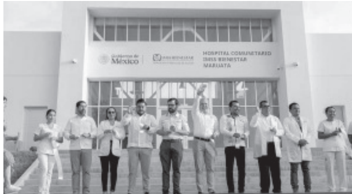
Actualmente ya atienden 11 médicos especialistas, 55 enfermeras y enfermeros, tres radiólogos y dos odontólogos, pero en total será una plantilla de 392 profesionales de la salud.

especialistas, 55 enfermeras y enfermeros, tres radiólogos y dos odontólogos, pero en total será una plantilla de 392 profesionales de la salud que brindarán una atención cercana y de calidad, con espacios modernos y equipados.