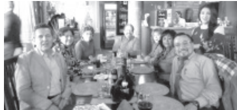
1º. OCTUBRE 2025 «DÍA DEL TRABAJADOR DEL ISSSTE» ¡¡MUCHAS FELICIDADES! A los Trabajadores de la Clínica Hosp del ISSSTE ZITÁCUARO En su DÍA.