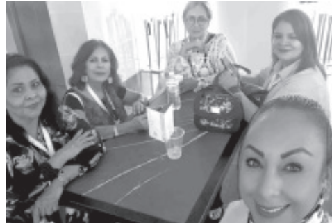
REUNIÓN DE MUJERES EMPRESARIAS De Zitácuaro que Asistieron al 3er.CONGRESO INTERNACIONAL DE Mujeres y Líderes Empresariales 2025 En León, Gto. CONCANACO SERVYTUR.