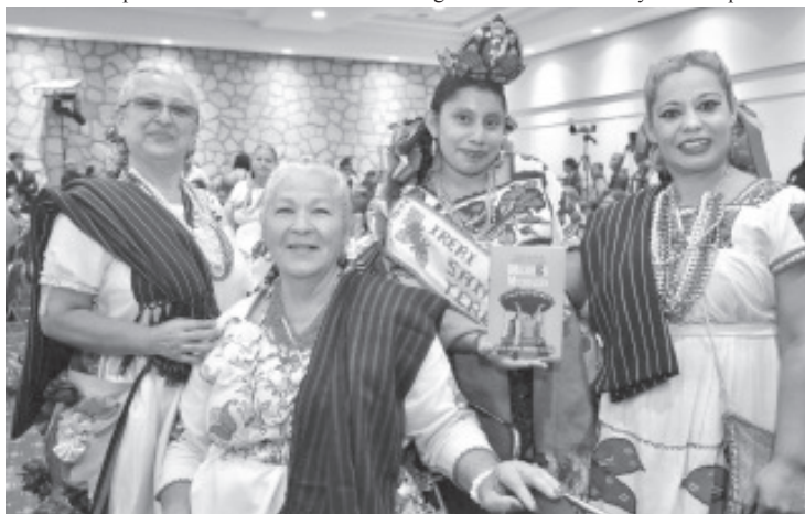
La senadora agradeció a las mujeres que participaron en la publicación por compartir sus historias en la lucha contra la violencia de género y adelantó que habrá una segunda edición para contar más testimonios.

participaron en la publicación por compartir sus historias en la lucha contra la violencia de género y adelantó que habrá una segunda edición para contar más testimonios.