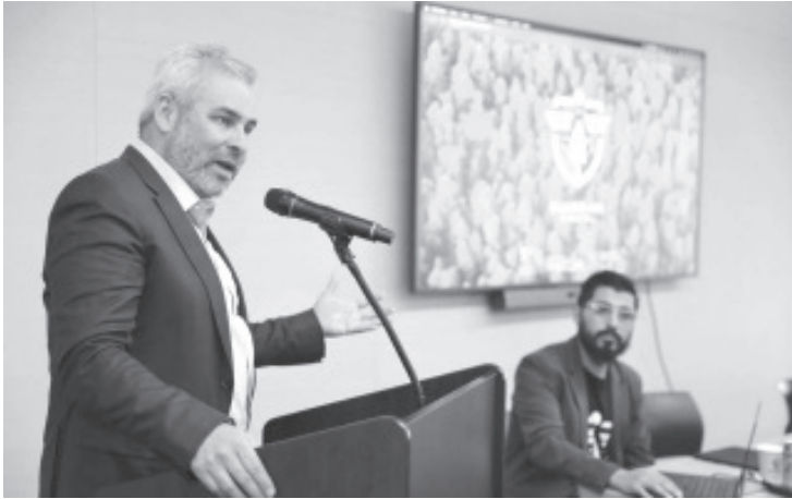
El Guardián Forestal fue reconocido por Climate Rights Internacional como el mejor sistema de vigilancia satelital en el mundo para defender la conservación de los bosques, luego de la presentación que realizó el gobernador Alfredo Ramírez Bedolla durante la semana del clima (Climate Week) realizada en Nueva York, Estados Unidos.

Nueva York, Estados Unidos, 24 de septiembre de 2025.- El Guardián Forestal fue reconocido por Climate Rights Internacional como el mejor sistema de vigilancia satelital en el mundo para defender la conservación de los bosques, luego de la presentación que realizó el gobernador Alfredo Ramírez Bedolla durante la semana del clima (Climate Week) realizada en Nueva York, Estados Unidos.