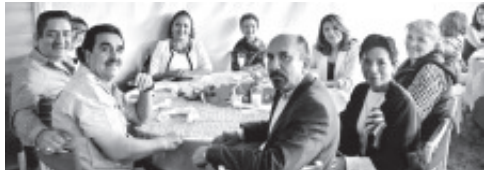
DESAYUNO MEXICANO En el mes de SEPTIEMBRE OFRECIDO Por el Grupo de DAMAS ROTARIAS-ZITÁCUARO. En la "QUINTA ESTEFANÍA" Intercambiando Acciones Altruistas. ¡FELICITACIONES!