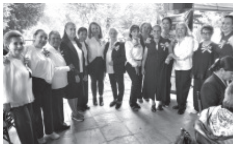
INTEGRANTES DEL CLUB ROTARIO-ZITÁCUARO. SUMÁNDOSE Mas de 200 AMIGOS Para realizar actividades ALTRUISTAS y acciones colectivas. Con su LEMA "UNIDOS PARA HACER EL BIEN".