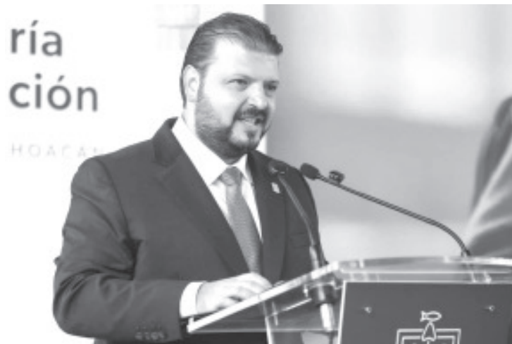
Tras el hallazgo de un artefacto artesanal en instalaciones del Instituto Nacional de Migración (INM), el secretario de Gobierno, Raúl Zepeda Villaseñor, informó que se ha reforzado la coordinación con instancias federales y locales ante cualquier posible suceso.

Finalmente, reiteró que el Gobierno de Michoacán continuará impulsando este modelo de trabajo interinstitucional como la vía más efectiva para preservar la seguridad y dar seguimiento puntual a las investigaciones en curso.