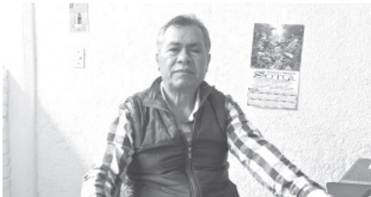
En entrevista Abel Cardenas titular del Servicio Nacional del Empleo (SNE), señaló que este 25 de septiembre en el centro de la ciudad, se llevará a cabo la cuarta feria de empleo del año. Con esta actividad se pretende dar respuesta a buscadores que necesitan un empleo así como a empresas que tienen vacantes disponibles.