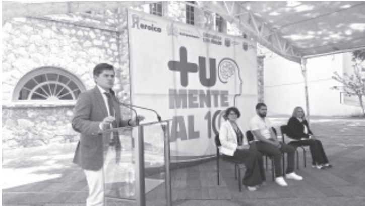
El Gobierno Municipal de Zitácuaro a través de la oficina de Desarrollo Humano y Grupos Vulnerables presentó el programa "Tu mente al 100", a través del cual se busca promover la importancia de la salud mental de la población

- Habrá conferencias, eventos y otras actividades para promover la importancia de la salud mental