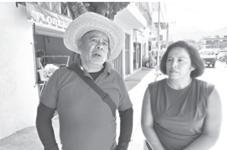
Con el propósito de reducir riesgos a la población que visita el Panteón Municipal San Carlos o que camina por la zona, Personal de Parques y Jardines desbrazó el árbol que se encuentra en la entrada principal.

Aseguraron que en todos los trabajos que se realizan cuidan que no haya accidentes y para ello se pide la coordinación de otras dependencias.