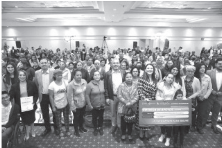
En Michoacán, las familias mejoraron sus ingresos y 500 mil personas lograron salir de la pobreza, una cifra mayor a la que registró el promedio nacional, destacó el mandatario Alfredo Ramírez Bedolla, en el marco de su cuarto informe de gobierno.

- Y el apoyo de la presidenta Claudia Sheinbaum