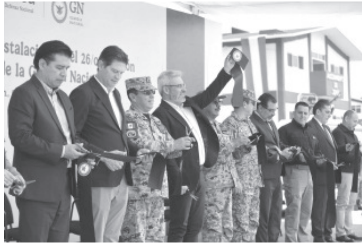
Con 50 cuarteles de la Guardia Nacional y de la Guardia Civil estatal, en Michoacán se refuerza la estrategia de seguridad que se implementa de manera coordinada entre efectivos de seguridad federales y estatales, así lo resaltó el gobernador Alfredo Ramírez Bedolla.

Con el fortalecimiento de las fuerzas policiales, el estado ha bajado la incidencia delictiva, principalmente en homicidio doloso, delito que registra una disminución del 65 por ciento durante la administración estatal, iniciada en octubre de 2021.