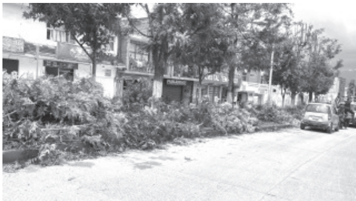
De forma drástica, este miércoles comenzaron trabajos de poda de los árboles que se encuentran en la ciclovía de Avenida Revolución. Los trabajos se harán de Matamoros a Miguel Carrillo.

Agregó que los trabajos estarán concluyendo el lunes y son realizados por Medio Ambiente, Alumbrado Público y personal de Limpia para recoger los residuos y darles un destino final adecuado.