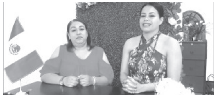
El próximo 24 de septiembre en el municipio de Ocampo se llevará a cabo una campaña de regularización del estado civil de las personas, por lo que los interesados ya se pueden acercar a las oficinas del Registro Civil a conocer los diferentes requisitos.

Coincidieron que no es la primera vez que el Registro Civil lleva a cabo este tipo de campañas, y en las realizadas la población ha respondido de una forma satisfactoria, la idea es beneficiar a la población y ayudar a que regularicen su situación civil.