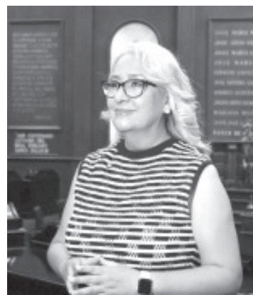
La diputada local Emma Rivera anunció que el próximo 20 de septiembre realizará un ejercicio de rendición de cuentas a la población en la ciudad de Zitácuaro, para compartir los avances y resultados de su trabajo como representante del pueblo.

“Este ejercicio es una oportunidad para rendir cuentas y demostrar que el trabajo que hacemos es con y para el pueblo”, concluyó Emma Rivera