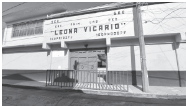
Por la realización de una obra de rehabilitación en los sanitarios, alumnos de la Escuela Primaria Leona Vicario iniciaron clases de forma virtual y será hasta el 22 de septiembre cuando regresen a las aulas de forma normal.

Aseguró que se cuenta con el respaldo de padres de familia, aunque nunca faltan los malos comentarios pero están conscientes que el fin es otorgar buenas condiciones para los alumnos. En este sentido agradeció la comprensión de todos y aseguró que se trabajará para cumplir con los programas educativos.