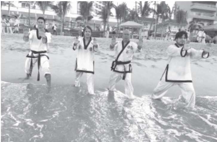
Durante el fin de semana, se llevó a cabo el 110 Seminario Nacional de Instructores y aspirantes de Moo Duk Kwan. El evento se realizó en Acapulco Guerrero, este año estuvo planeado para los días 5, 6 y 7 de septiembre y Zitácuaro estuvo presente.

Durante el seminario se vieron temas como el arbitraje, técnicas de Dyung Dan Bong, Kigong, Como evaluar el desarrollo motor del niño a partir del Tae Kwan Do; Yoga aplicado al Tae Kwan Do, que nos hace diferentes, entre otros.