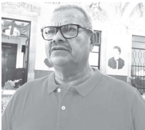
Félix Reyes Posadas, titular de Cultura Física y Deporte, señaló que todo está listo para que el próximo 16 de septiembre se lleve a cabo el tradicional desfile cívico.

Cómo cada año, el desfile se llevará a cabo sobre Avenida Revolución, de El Monumento a la Bandera a la esquina de la calle Moctezuma y arrancará en punto de las 11:00 horas.