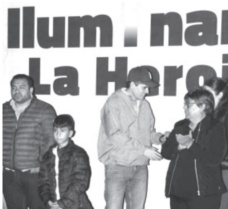
El presidente municipal de la Heroica Zitácuaro, Juan Antonio Ixtláhuac, encabezó la inauguración de la remodelación del sistema de alumbrado público en algunas calles de la colonia Zaragoza, donde se instalaron nuevos postes, luminarias LED y cableado eléctrico.