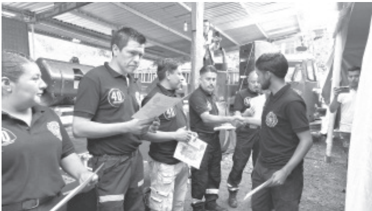
Elementos del Cuerpo de Bomberos celebraron su día y el 40 aniversario de la fundación de este cuerpo de auxilio.