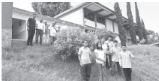
Como parte del seguimiento a los trabajos que se han hecho en pro del medio ambiente, integrantes de Visión Cero presentaron las diferentes actividades que se llevarán a cabo una vez que comience el ciclo escolar.

Agregaron que hay interés de los jóvenes alumnos en este tipo de actividades de reforestación urbana, y cada vez más instituciones y jóvenes se sienten interesados en integrado a las actividades.