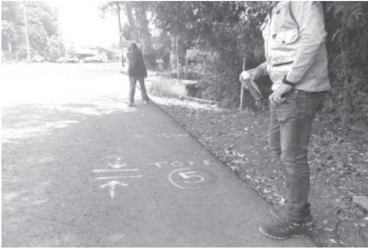
En la salida a Morelia, en el tramo de Curungueo a Valle de Verde sí habrá topes y serán 9 a base de asfalto. Así lo acordaron en reunión representantes de la tenencia de Curungueo con las empresas RCO y IXA, los cuales dejaron claro que estos topes por el momento serán provisionales.

para colocar los topes, de lo contrario sigue en pie la reunión del pueblo ese mismo día y podrían tomar la carretera.