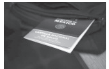
Con el próximo inicio del ciclo escolar, la Secretaría de Salud de Michoacán (SSM) invita a madres y padres de familia a aprovechar los últimos días de vacaciones para asegurar que los niños y niñas tengan su esquema de vacunación completo.

La SSM recuerda que contar con esquemas de vacunación completos no solo protege a cada estudiante de forma individual, sino que también contribuye a la salud colectiva de toda la comunidad escolar.