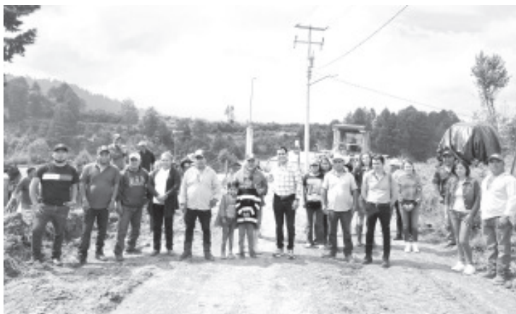
El pasado jueves dimos inicio a la obra en la segunda manzana de Donaciano Ojeda. Gracias a la gestión eficiente y a la buena organización, este proyecto se realiza con el presupuesto directo que llega a nuestra comunidad.

El Concejo estuvo presente, trabajando de la mano con todos aquellos que han confiado en este proyecto, demostrando que la colaboración comunitaria es la fuerza detrás de cada logro.