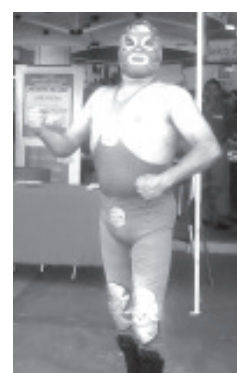
CUMPLIO AÑOS El Conocido LUCHADOR Zitacuareño «ESPIRITU DE LA MUERTE» Y Recibió Parabienes y mejores deseos de compañeros luchadores de la Arena Zitácuaro, ¡FELICIDADES!