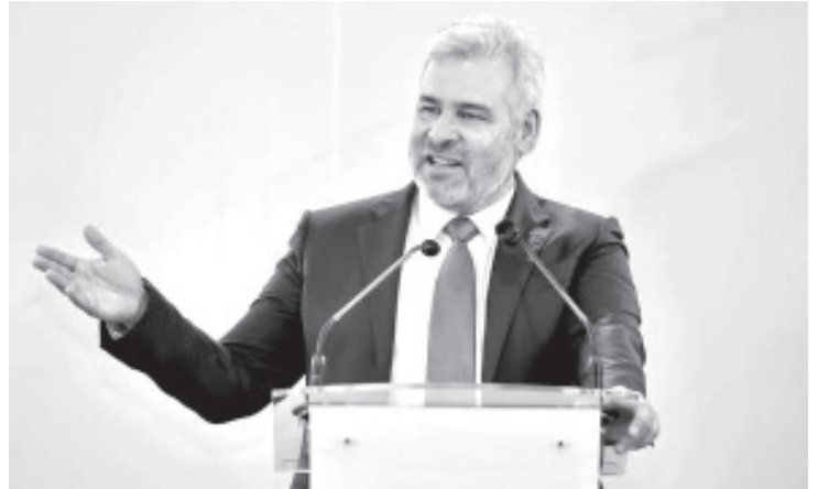
En conferencia de prensa, el mandatario informó que hoy la entidad cuenta con un mejor nivel educativo al que tenía antes de la pandemia de COVID-19.

Expuso que en los años 2018 y 2020 la entidad registraba un rezago educativo del 27 y 29.4 por ciento, respectivamente, de acuerdo con las mediciones elaboradas por el Consejo Nacional de Evaluación de la Política de Desarrollo Social (Coneval) y del Instituto Nacional de Estadística y Geografía (Inegi).