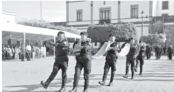
La Suprema Junta Nacional Americana se instaló en Zitácuaro en 1811 y jugó un papel fundamental en la lucha por la independencia de México.

Durante la ceremonia, se destacó la importancia de este acontecimiento histórico en la lucha por la independencia de México. La Suprema Junta Nacional Americana,