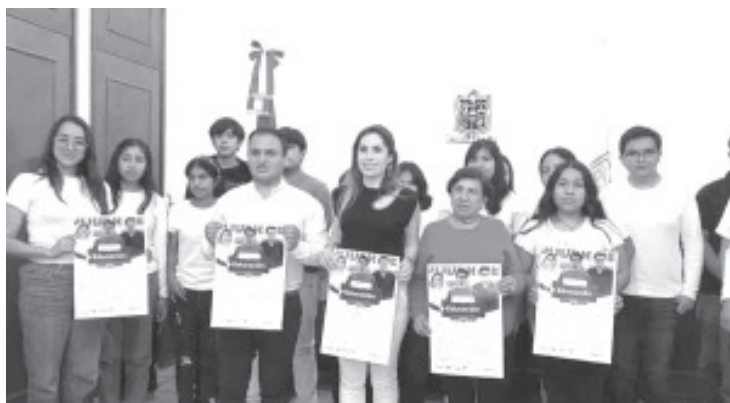
Jóvenes que estudien fuera del municipio como Morelia', Estado de México, Ciudad de México y Toluca podrán acceder a una beca de transporte que consiste en el 50% de descuento en su traslado.

La recepción de la documentación será a partir de la publicación de la convocatoria y hasta el 28 de agosto en las instalaciones del Instituto de la Juventud, de lunes a viernes de 9:00 de la mañana a 3:00 de la tarde. Tentativamente la entrega de las tarjetas que los harán acreedores a dicho beneficio será el 30 de agosto.