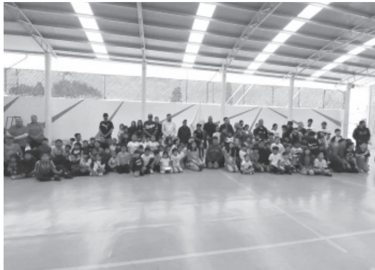
De forma oficial, más de 350 niños y niñas del municipio, culminaron sus cursos de verano llevados a cabo en las diferentes Unidades Deportivas del Municipio. Juan Antonio Ixtláhuac Orihuela, Presidente Municipal de Zitácuaro encabezó la clausura de estas actividades deportivas organizadas por la Dirección de Cultura Física y Deporte.