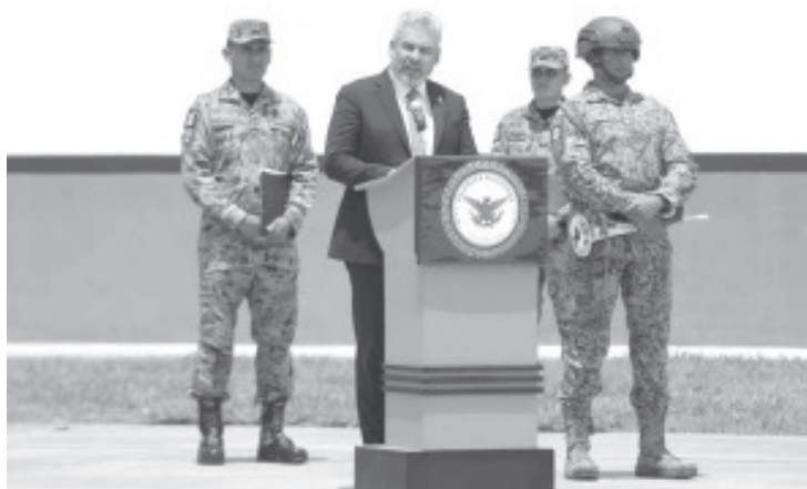
Con un llamado a no bajar la guardia contra la delincuencia y la violencia en Michoacán, el gobernador Alfredo Ramírez Bedolla pidió a las instituciones en materia de seguridad y procuración de justicia, mantener la coordinación necesaria para garantizar la paz social a la ciudadanía.

Morelia, Michoacán, 12 de agosto de 2025.- Con un llamado a no bajar la guardia contra la delincuencia y la violencia en Michoacán, el gobernador Alfredo Ramírez Bedolla pidió a las instituciones en materia de seguridad y procuración de justicia, mantener la coordinación necesaria para garantizar la paz social a la ciudadanía.