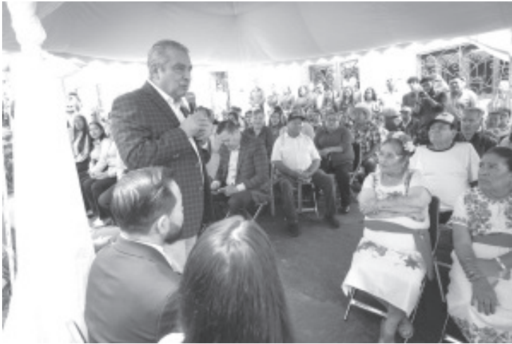
"Raúl Morón ha sido trascendental en gestiones que han permitido el avance de la transformación en diversos municipios, incluido el nuestro", destacó el alcalde de Panindícuaro, Manuel López Meléndez, durante la presentación de su primer informe de gobierno, el cual contó con la presencia del senador de la República.

Previo al evento de presentación del informe y como un ejemplo del apoyo que ha conseguido para los municipios, Raúl Morón acompañó al alcalde de Panindícuaro a la inauguración de la Casa de Protección a la Mujer, al Infante y al Adulto Mayor, espacio que fungirá como un refugio para personas en condición de vulnerabilidad y que ofrecerá además alimentación, atención médica y psicológica, así como orientación jurídica.