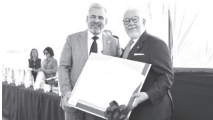
El gobernador Alfredo Ramírez Bedolla presentó a integrantes de la Confederación de Cámaras de Industriales de los Estados Unidos Mexicanos (Concamin), beneficios y ventajas competitivas para la inversión en el Polo de Desarrollo para el Bienestar Parque Bajío.

Acompañaron al gobernador los secretarios de Gobierno, Raúl Zepeda Villaseñor y de Desarrollo Económico, Claudio Méndez Fernández, así como integrantes de la Asociación de Industriales del Estado de Michoacán (AIEMAC).