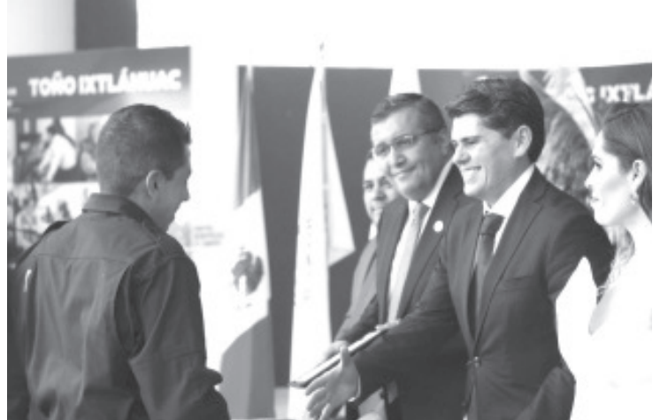
Con el compromiso de profesionalizar a quienes integran la administración municipal, se llevó a cabo la entrega de constancias al personal de los Juzgados Cívicos, la Secretaría de Seguridad Pública y Vialidad, así como de la Secretaría de Servicios Ciudadanos del H. Ayuntamiento de Zitácuaro 2024-2027, tras concluir el taller en Mecanismos de Solución de Controversias.

Agregó que todas las actividades primarias son fundamentales para la alimentación de las familias, por ello, dijo que en el campo es vital que la gente no pierda la costumbre de producir algo ya sea desde hortalizas o hasta algún animal o ave, esto ayuda a la economía y además a la auto sustentabilidad.