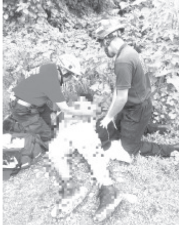
La tarde de este miércoles, el Heroico Cuerpo de Bomberos de Zitácuaro logró evitar que un hombre de 40 años se lanzara desde el conocido Puente de Fierro, ubicado sobre la carretera Zitácuaro-Morelia.

Gracias a la rápida intervención de los cuatro elementos a bordo, se logró preservar la vida del ciudadano. El equipo retornó a base sin más novedades.