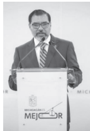
La Secretaría de Seguridad Pública (SSP) fortalece su estrategia operativa con la entrega de equipo tecnológico para la detección de artefactos explosivos, cuya inversión asciende a cerca de 8 millones de pesos, destacó su titular Juan Carlos Oseguera Cortés.

La estrategia para el combate frontal contra la delincuencia es contundente, sostuvo Oseguera Cortés, quien señaló que, mediante equipo, adiestramiento, capacitación, además de trabajos de inteligencia y operatividad táctica, la SSP se consolida para tener uno de los agrupamientos antibombas más efectivos en todo México.