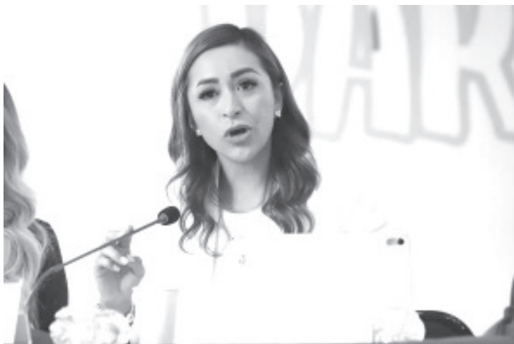
El Congreso del Estado de Michoacán, a través del Comité Organizador del Parlamento Juvenil incluyente, en su versión 2025, presentó de manera oficial la convocatoria pública para todos aquellos jóvenes que quieran participar en este ejercicio democrático, plural e incluyente.

Morelia, Michoacán, a 08 de agosto del 2025.- El Congreso del Estado de Michoacán, a través del Comité Organizador del Parlamento Juvenil incluyente, en su versión 2025, presentó de manera oficial la convocatoria pública para todos aquellos jóvenes que quieran participar en este ejercicio democrático, plural e incluyente.