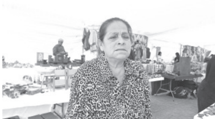
Un prometió de 90 artesanos locales se instalaron en la explanada de la plaza cívica Licenciado Benito Juárez, esto con el objetivo de exhibir y vender artículos que elaboran a lo largo del año.

Aseguró que los precios son accesibles para todos, por lo que zitacuarenses y visitantes se deben dar la oportunidad de acudir al centro de la ciudad y ver los artículos que venden, seguramente habrá alguno de su preferencia. Al ser ellos quienes elaboran los productos, esto permite que sus costos no sean tan elevados, además el recurso se queda aquí en el municipio porque son artesanos locales los que participan.