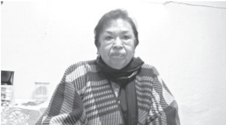
La unión de Contribuyentes "Grupo Dos" ha visto un declive en la formalización de negocios debido a los cambios en el régimen fiscal y los altos costos de los trámites y licencias.

- De 120 integrantes ahora representan solo a 70 contribuyentes