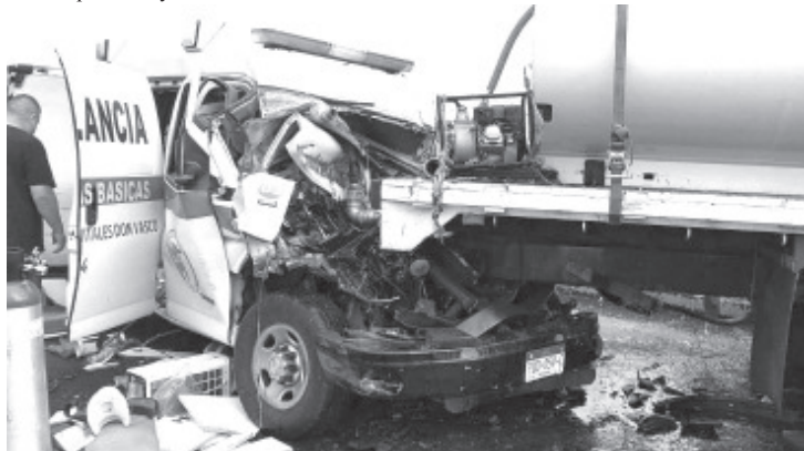
Falleció en el Hospital Civil de Morelia la joven paramédico que sufrió severas heridas tras el choque de una ambulancia de "Servicios Vitales Don Vasco" contra la retaguardia de una pipa de agua, accidente registrado sobre la carretera Morelia-Pátzcuaro.

Las identidades de las otras dos personas que perdieron la vida no han sido expuestas por las autoridades policiales. Elementos de la Fiscalía General del Estado (FGE) se encargaron de las investigaciones respectivas y trasladaron los cadáveres a la morgue para la práctica de la necropsia de ley