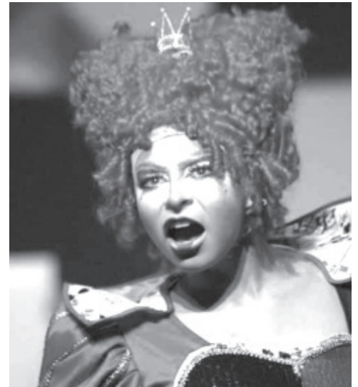
CHARACTERIZACIÓN PRINCIPAL En la OBRA MUSICAL "ALICIA EN EL PAÍS DE LAS MARAVILLAS" Presentada por la ACADEMIA DE DANZA "NATALIA MAKAROVA". ¡FELICIDADES A TODOS!