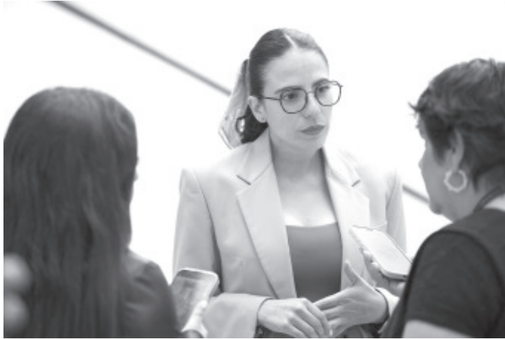
La presidenta del Congreso del Estado, Giulianna Bugarini Torres, informó que concluyó el periodo de inscripción para aspirar a la titularidad de la Fiscalía General del Estado, con un total de 16 personas registradas entre el 14 y el 17 de julio.

Con este paso, el Congreso del Estado avanza en un proceso clave para el fortalecimiento del sistema de procuración de justicia en Michoacán, reafirmando su compromiso con la legalidad, la equidad y la confianza ciudadana.