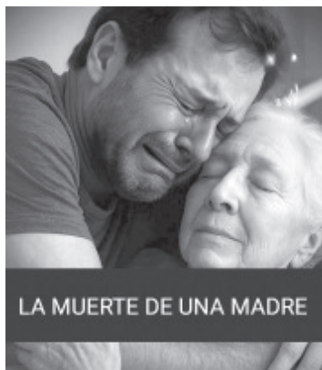
LA MUERTE DE UNA MADRE

Tu sangre, su sangre. Tu cuerpo es una prolongación del suyo. Cuando ella se va, no es el cordón umbilical lo que se rompe...es tu raíz. Es la muerte tocando tu puerta... como un susurro de lo inevitable. Y por eso yo... quise detener ese momento. Quise alargar su aliento, aunque fuera unas horas más. Para evitar su final...me mantuve despierto. Y para no quedarme dormido...la mantuve despierta también. Hablé. Le conté todo lo que nunca me atreví a decirle. Le hablé de mis miedos, de mis errores, de mis culpas. Y aún con todo ese peso...era hermoso. Porque era vida. Era nuestra historia, puesta al fin sobre la mesa... sin máscaras, sin orgullo. Le confesé que, a pesar del dolor, yo amaba intensamente la vida. Que me alegraba de haber nacido. Y ahí, quebrado por dentro, me arrodillé, le di las gracias. Gracias por darme este regalo sagrado: la existencia. Recuerda esto: Ningún amor te forma tanto como el de una madre. Y cuando ella parte...no muere sola. Algo dentro de ti también se apaga. Si aún la tienes cerca, abrazala. Si ya no está... honra su vida viviendo la tuya con amor, gratitud y coraje. ??