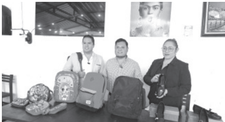
A través del programa "Monarca", padres de familia podrán adquirir mochilas y zapatos a bajo precio para sus hijos para el próximo regreso a clases.

- La actividad es impulsada por jóvenes preocupados por las familias Zitácuarenses