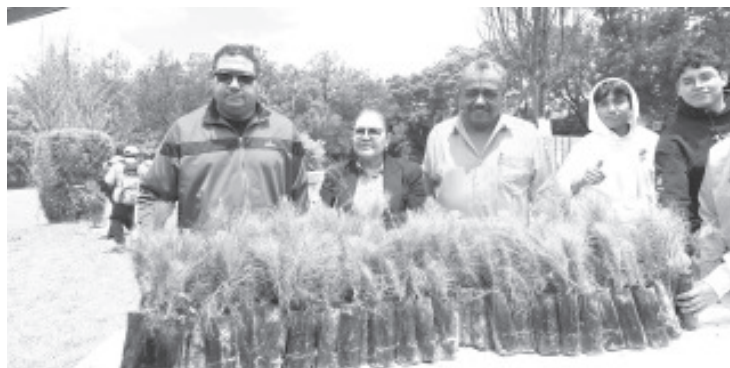
La Universidad Contemporánea de las Américas UNICLA se suma a las iniciativas del Gobierno Municipal de apoyar en la esterilización de mascotas y en la campaña anual de reforestación.

Asimismo invitó a los jóvenes a no solo reforestar, sino llevar a cabo otras acciones en favor del medio ambiente, esto permitirá que sea considerada una institución verde que es una iniciativa que se viene impulsando para hacer que instituciones se involucren.