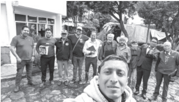
Este fin de semana se llevó a cabo con mucho éxito el curso introductorio de protagonistas del cambio verdadero en el municipio, el cual tenía el objetivo de hablar sobre el inicio y lo que ha sido el movimiento de Morena así como destacar sus valores y principios.