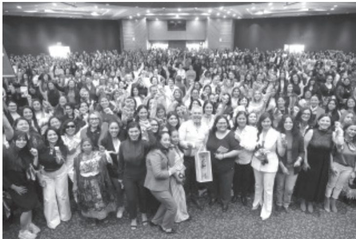
Las mujeres están imparables y listas para gobernar Michoacán, afirmó el mandatario Alfredo Ramírez Bedolla, al señalar que será el último hombre gobernador del estado.

- Están llamadas a ser las protagonistas del cambio verdadero, dijo el gobernador