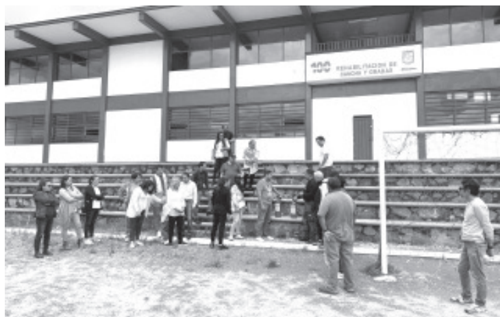
Desde el pasado mes de mayo, el personal docente, administrativo y de apoyo de la Escuela Secundaria General N.º 2 “Suprema Junta Nacional Americana” recibe capacitación intensiva en materia de seguridad escolar y protección civil.