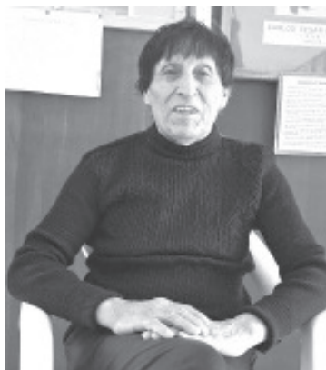
El próximo 2 de agosto se llevará a cabo una carrera atlética para conmemorar el 39 aniversario del Salón de la Fama y el Deporte de Zitácuaro A.C. El registro será completamente gratis.

Asimismo recordó que sigue abierta la convocatoria para que más deportistas sean parte del Salón de la Fama, para ello deben presentar una solicitud así como testimonios de sus triunfos.