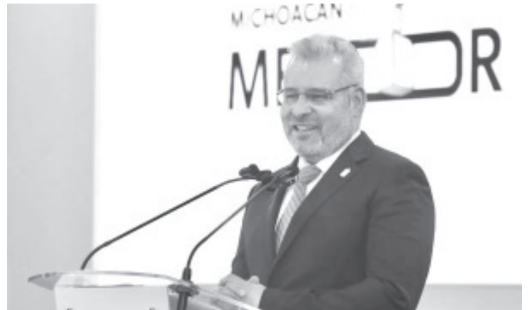
Las labores de prevención y atención de incendios forestales le permitieron a Michoacán rescatar este año más de 62 mil hectáreas de bosque, en comparación con el 2024, destacó el gobernador Alfredo Ramírez Bedolla.

Así como la participación de mil 270 brigadistas de las comisiones nacional y estatal Forestal, y de Áreas Naturales Protegidas; así como ayuntamientos, autogobiernos, Protección Civil, silvicultores, voluntarios y mujeres, quienes conformaron 127 grupos.