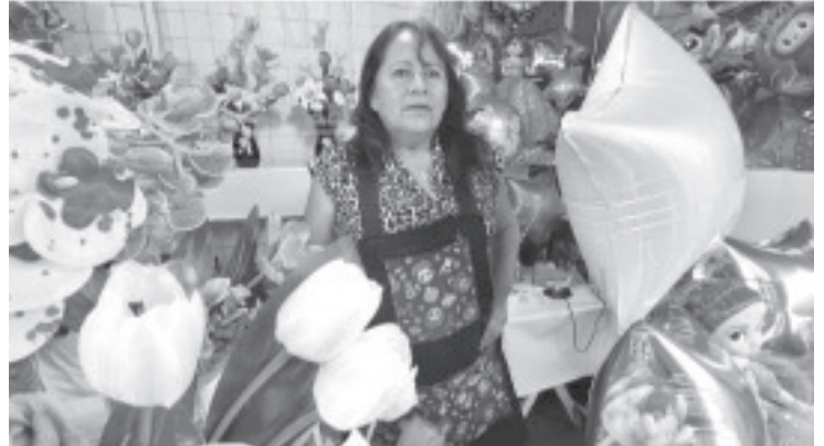
Comerciantes de temporada de arreglos de graduación reportan ventas mínimas, esto se debe a que la mayoría de escuelas decidieron suspender sus eventos de clausuras por el tema de seguridad.

Invitó a la población que requiera este tipo de arreglos, que se acerquen al Jardín Constitución, seguramente habrá algo de su agrado.