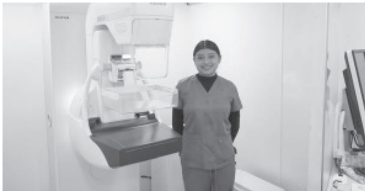
La Secretaría de Salud de Michoacán (SSM) hace un llamado a las mujeres a estar alertas ante las señales de advertencia del cáncer de mama, ya que la detección temprana de esta patología es curable y permite una óptima calidad de vida.

- Más de 21 mil estudios realizados, 102 nuevos casos detectados oportunamente