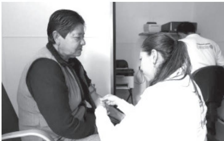
La Secretaría de Salud de Michoacán (SSM), realiza diagnóstico oportuno de alzheimer en el Hospital General "Dr. Miguel Silva", lo que permite prevenir el deterioro neurológico en las y los pacientes.

- Pone a disposición de la población Hospital Civil