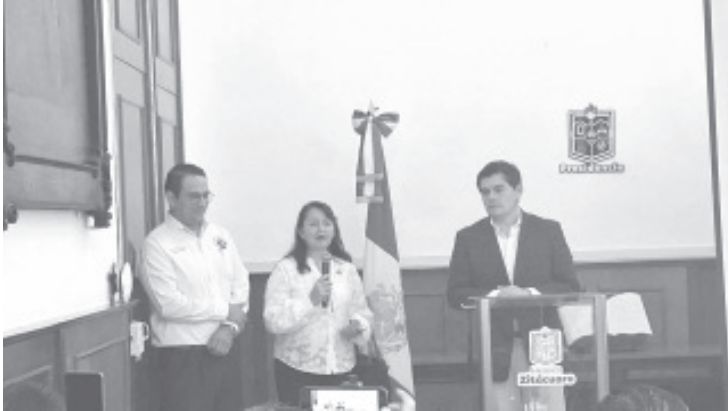
En el marco de la conmemoración del Día Internacional de la Mujer, el Gobierno Municipal llevará a cabo durante este mes de marzo la estrategia denominada "Catálogo de beneficios para mujeres heroicas". Así lo anunció el Presidente Municipal, Juan Antonio Ixtláhuac Orihuela,

Ixtláhuac Orihuela, señaló que en estos beneficios están diversas dependencias del Gobierno Municipal, Servicios de la Clínica de Salud Municipal, establecimientos comerciantes de diferentes rubros y además clínicas privadas que estarán ofertando importantes descuentos. El catálogo completo de los lugares que ofrecerán estos beneficios puede ser consultado en la oficina de Atención Ciudadana.