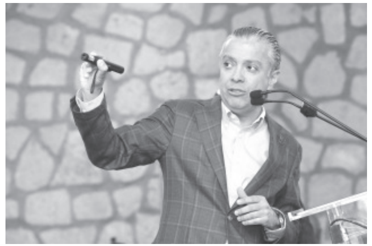
De octubre de 2021 a la fecha se invierten más de 20 mil millones de pesos en infraestructura en todo el estado, sin comprometer con deudas el futuro financiero de los michoacanos, a diferencia de administraciones pasadas, informó el gobernador Alfredo Ramírez Bedolla.