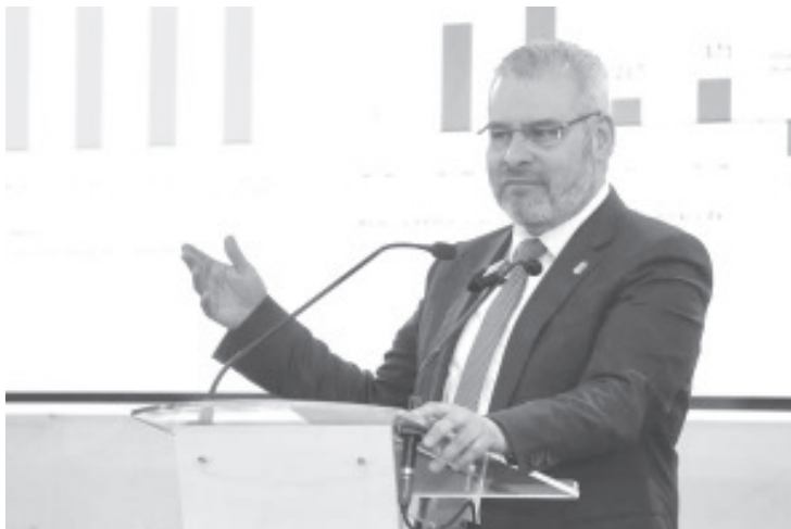
Con la reforma a la Ley Orgánica de la Universidad michoacana de San Nicolás de Hidalgo, aprobada por el Congreso del Estado, los derechos de sus trabajadoras y trabajadores están garantizados, entre los que destaca el sistema de jubilaciones y pensiones, así lo señaló el gobernador Alfredo Ramírez Bedolla.

Detalló que la reforma permitirá que la universidad siga creciendo, al anunciar que está por iniciar la construcción de dos campus más en Huetamo y Zacapu.