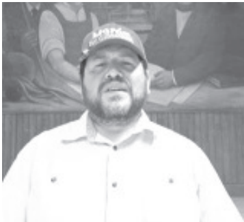
Este fin de semana iniciaron las actividades de la organización Fuerza Mujeres Michoacán y el Enlace Distrital del Senador Raúl Morón Orozco.

H. Zitácuaro Michoacán, 11 de marzo de 2025.- Este fin de semana iniciaron las actividades de la organización Fuerza Mujeres Michoacán y el Enlace Distrital del Senador Raúl Morón Orozco.