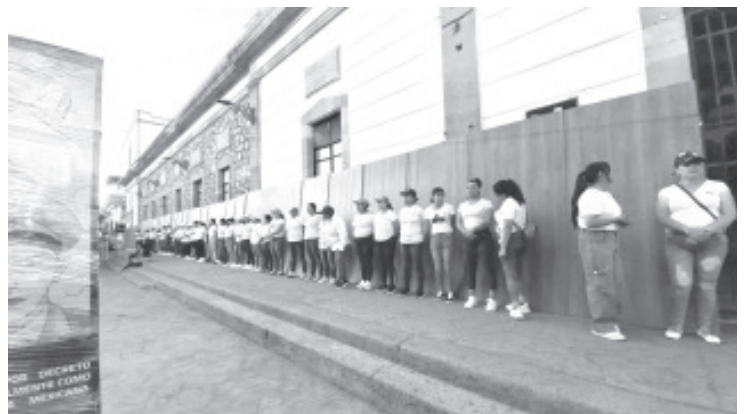
En el marco del 8 de marzo, Día Internacional de la Mujer, poco más de medio centenar de mujeres de todas las edades protagonizaron una marcha de protesta. La acción tuvo como punto de reunión el Jardín de la Mora del Cañonazo.