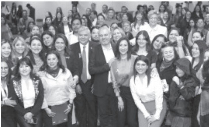
Hoy Michoacán pone fin a una deuda histórica con las mujeres, señaló el gobernador Alfredo Ramírez Bedolla, luego de que este sábado el Congreso del Estado aprobara el paquete de reformas en materia de obligaciones alimentarias con el que se garantiza un acceso oportuno a alimentos, el desarrollo físico, educativo y psicológico de niños, niñas y adolescentes del estado.

Destacó que, ahora jueces y magistrados deberán reportar de manera directa los movimientos en el Registro Nacional de Obligaciones Alimentarias, lo que fortalecerá el control y la vigilancia sobre quienes intenten evadir sus responsabilidades. Asimismo, las sanciones por incumplimiento se incrementarán de tres a cinco años de prisión y las multas se elevarán de 100 a 400 días de salario.