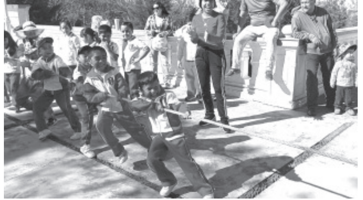
La Escuela Primaria 18 de Marzo comenzó dio inicio a las actividades por el 86 aniversario de su fundación en la ciudad. Este lunes alumnos de 1er y 2do grado de los diferentes grupos participaron en una caminata que comenzó sobre la calle Leandro Valle y culminó en el Cerrito de la Independencia.