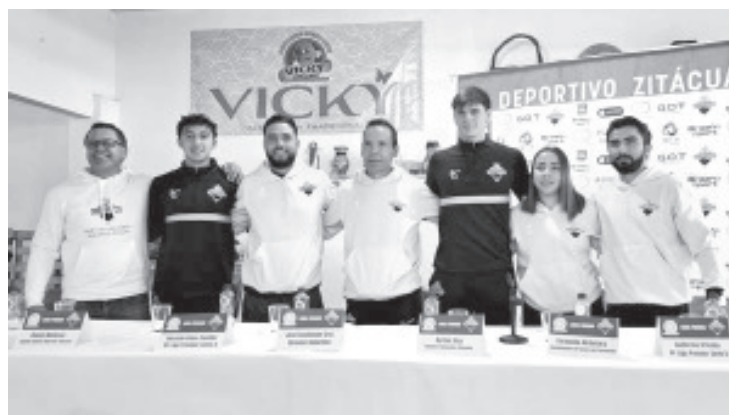
El Deportivo Zitácuaro da a conocer detalles sobre el próximo partido correspondiente a la jornada siete de la Liga Premier, el cual se llevará a cabo en el marco del "Lunes Premier". Dicho encuentro se jugará el próximo lunes a las 20:00 horas en el estadio Ignacio López Rayón, enfrentando al equipo líder del torneo, Deportivo Mérida.