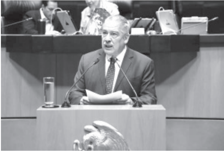
El senador morenista por Michoacán, Raúl Morón Orozco, presentó ante el Pleno del Senado su iniciativa de reforma a la Ley de Seguros y Fianzas, así como a la Ley de Contrato de Seguro.

- Ante el Pleno del Senado, aseguró que esta iniciativa dará acceso a seguros a sectores históricamente excluidos, como personas con discapacidad, mujeres y comunidades indígenas