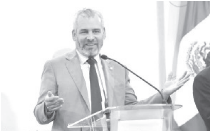
Con la reforma constitucional para la obligatoriedad de implementar el Gobierno Digital en todos los niveles de gobierno, órganos autónomos y Poderes, se eficientizarán los recursos públicos y se fortalece la participación y confianza ciudadana, destacó el gobernador Alfredo Ramírez Bedolla.

La iniciativa reforma constitucional de Gobierno Digital, firmada y enviada al Congreso local el miércoles de esta semana, forma parte del Plan Morelos presentado el año pasado por el gobernador de Michoacán