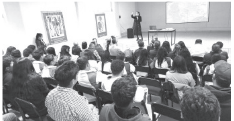
Con una jornadas de conferencias con temas alusivos al medio ambiente, la Asociación de Agrónomos del Oriente de Michoacán, celebraron su día.

Auguró que la actividad será un éxito, y se tratará de llevarlo a cabo de forma organizada por tratarse de niños pequeños y al mismo tiempo dejar un buen sabor de boca a quienes presencien el desfile.