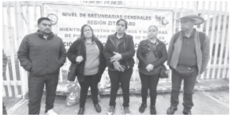
Integrantes de la CNTE tomaron este miércoles por varias horas las instalaciones de Servicios Regionales Educativos. La acción fue para demandar que se respeten los derechos laborales de compañeros. Fue a nivel estado que se llevó a cabo diversas acciones como toma de oficinas, de presidencias municipales y otras acciones de protesta. A nivel local, el acuerdo fue la toma de Servicios Regionales Educativos así como una reunión de trabajo con el Gobierno Municipal de Zitácuaro.