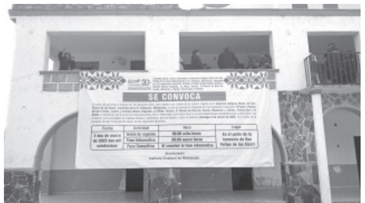
Con apoyo de representantes de algunas instancias de gobierno, personal del Instituto Electoral de Michoacán (IEM), llevó a cabo la pega de convocatoria e información para la consulta que se tendrá en San Felipe los Alzati el próximo 2 de marzo.

En la actividad participaron autoridades del lugar y se desarrolló sin ningún incidente. Por lo que se espera la participación de la mayoría de los habitantes de este lugar, ya que esto definirá los destinos de todos los que conforman la tenencia de San Felipe los Alzati.