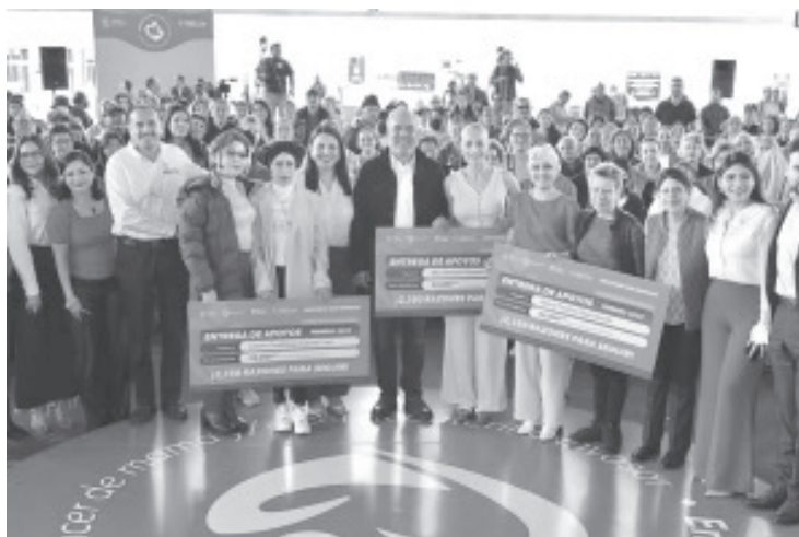
Al otorgar mil 713 apoyos económicos a mujeres con cáncer, el gobernador Alfredo Ramírez Bedolla señaló que la entrega de este beneficio está garantizada para todo el año, con el propósito de que no abandonen su tratamiento médico.

- Gobernador pide brindar red de apoyo para que no abandonen tratamiento