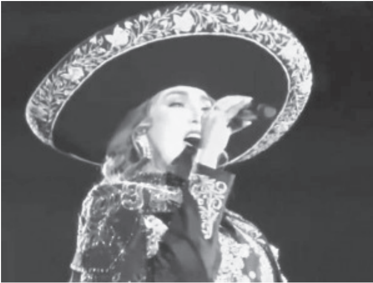
El cierre de la feria estuvo engalanado por la presentación de grandes exponentes de la música regional. Alicia Villarreal, con su carisma y potente voz, hizo cantar a los asistentes con sus éxitos más recordados. El Poder del Norte puso a vibrar a los fanáticos del género norteño, mientras que Banda Roja se encargó de mantener la energía al máximo con su inconfundible estilo.

- Durante la noche, la emoción del público se hizo sentir con cada interpretación de los tres artistas invitados.