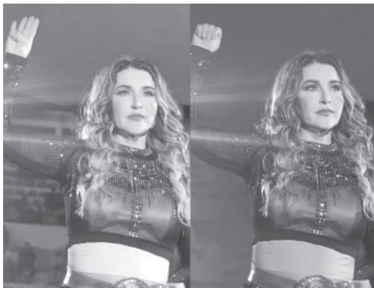
La noche de este Domingo, la cantante, Alicia Villarreal, causó revuelo entre su público en la ciudad de Zitácuaro al pedir auxilio con conocida señal durante su concierto en la Arena Heroica.

Hasta el momento no se ha dado más información por parte de la artista, de Cruz Martínez, ni de medios de comunicación oficiales que den información certera de lo que sigue aconteciendo.