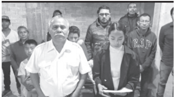
Por la Semana Santa, el grupo "ViaCrucis" de la parroquia del Señor Más Grande Amor se prepara para la escenificación de la pasión, muerte y resurrección de nuestro señor Jesucristo.

Los interesados pueden contactar a los coordinadores en la parroquia del Señor Más Grande Amor, los ensayos se realizan de lunes a viernes de 7 a 9 de la noche al interior de la parroquia.