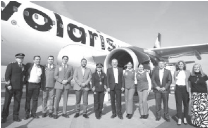
Michoacán tendrá una mayor conectividad aérea con destinos internacionales con las ocho nuevas rutas Volaris que comenzarán operaciones de manera directa y sin escalas a partir del 4 de julio, destacó el gobernador Alfredo Ramírez Bedolla.

Con las tres nuevas rutas nacionales y cinco internacionales, el Aeropuerto Internacional Francisco J. Múgica llega en total a 17 destinos.