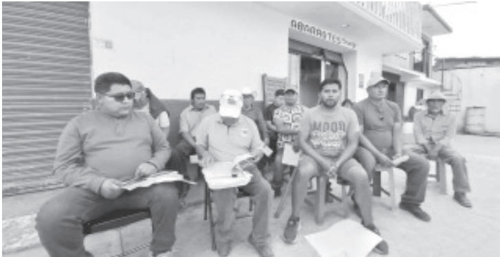
En conferencia de prensa, habitantes de San Felipe los Alzati pidieron a los pobladores de este lugar que acudan el próximo 2 de marzo a la tenencia donde se llevará a cabo la consulta para decidir si acceden al autogobierno y al presupuesto directo.