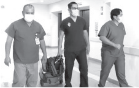
El trabajo realizado por la Secretaría de Salud de Michoacán (SSM) a través del Consejo Estatal de Trasplantes (Coetra), para concientizar sobre la importancia de la donación de órganos, permitió que durante el 2024 se realizarán 73 trasplantes en el estado.

- 163 personas en la entidad, a la esperan de un trasplante