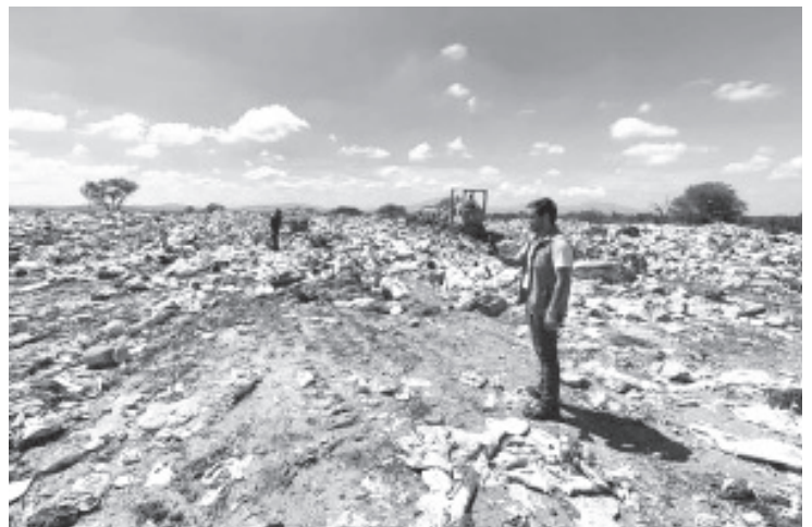
La gestión integral de los residuos sólidos urbanos es uno de los retos ambientales en el estado, ya que al menos 87 de los 113 municipios disponen su basura en sitios que no cumplen con las medidas que indica la legislación ambiental y la NOM-083-SEMARNAT 2003, por lo cual se les ha iniciado un procedimiento administrativo en esta dependencia.

- Proam tiene 87 procedimientos contra ayuntamientos por operación inadecuada