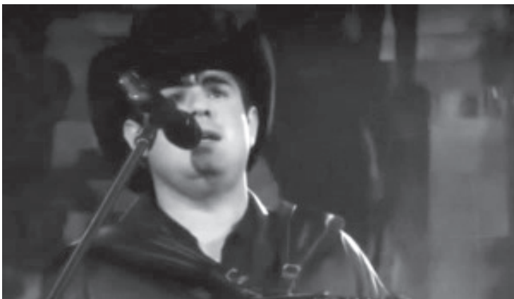
Este sábado, la Arena Heroica fue el punto de reunión de uno de los eventos más esperados de la Expo Feria Monarca Zitácuaro 2025, con la presentación estelar de Alfredo Olivas. El cantante y compositor mexicano cautivó a miles de asistentes con su inconfundible estilo, consolidando su lugar como uno de los artistas más populares del género regional mexicano.

Alfredo Olivas, con su carisma y talento, brindó a los asistentes una experiencia única que quedará en la memoria de los fanáticos