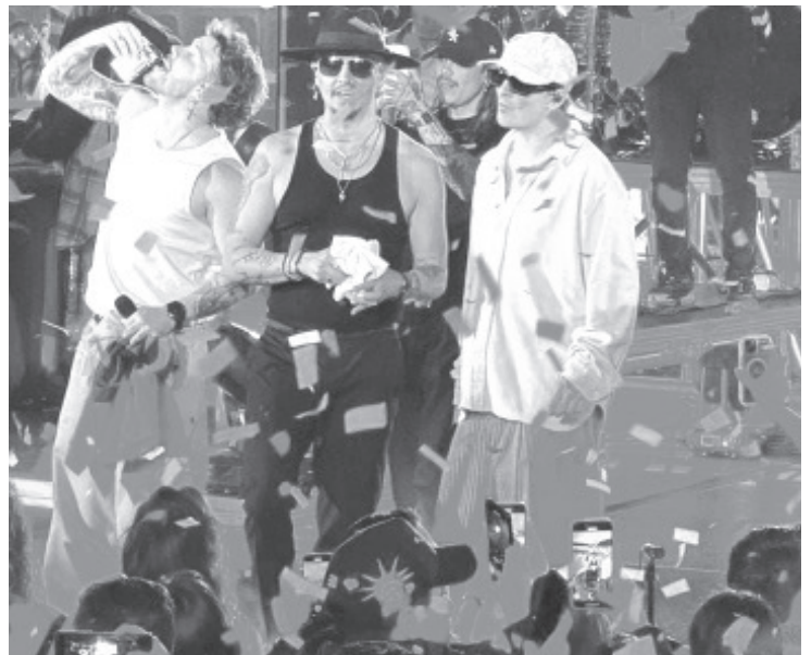
Durante la noche de este viernes, la Arena Heroica fue el escenario de un evento que reunió a fanáticos de Piso 21, quienes disfrutaron de una noche llena de música, energía y romance, en el marco del Día del Amor y la Amistad.

El evento resultó ser una combinación perfecta de buena música y el espíritu festivo que caracteriza a esta fecha especial. Piso 21 reafirmó su lugar como uno de los artistas más queridos de la música latina, dejando a todos los asistentes con la promesa de más sorpresas en futuras presentaciones.