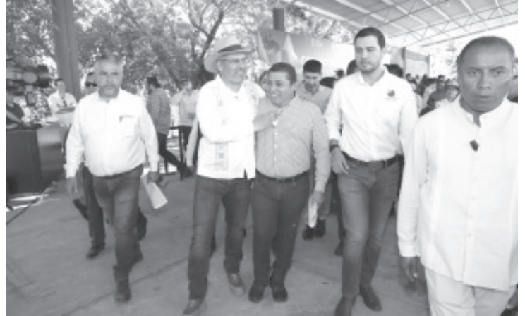
El gobernador Alfredo Ramírez Bedolla informó que con la colaboración del Centro de Investigación y Desarrollo Agroalimentario de Michoacán (CIDAM) se trabajó el proyecto con el que los productores michoacanos podrán transformar su producción en polvo con altos niveles de rendimiento.