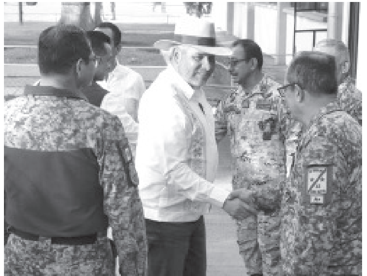
El gobernador Alfredo Ramírez Bedolla encabezó mesa de seguridad en Apatzingán donde se evaluó la estrategia y se acordó consolidar la coordinación institucional con la Secretaría de la Defensa Nacional y la Guardia Nacional para fortalecer las acciones de atención y prevención a la violencia.