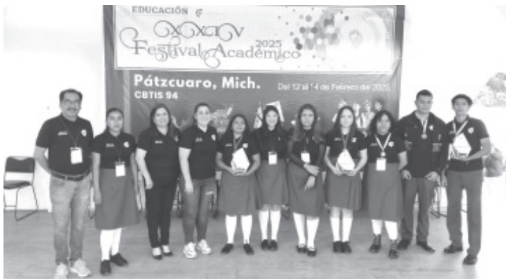
Dos alumnas del CETIS 28 participarán representarán a Michoacán en el XXIV Festival Académico 2025 de la DGETI en su etapa nacional, que se llevará a cabo en el mes de marzo.