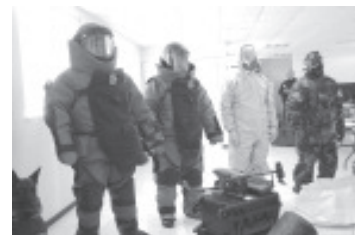
Con la finalidad de reforzar las acciones de protección a la integridad de la población, en el gobierno de Alfredo Ramírez Bedolla fue creado el Agrupamiento Especializado en Artefactos Explosivos y Materiales Peligrosos, equipo altamente capacitado y a la vanguardia, destacó el titular de la Secretaría de Seguridad

Mientras que en lo que va de los primeros meses de este 2025, las tareas preventivas efectuadas en coordinación con fuerzas federales han permitido decomisar más de 200 explosivos, derivado de las operaciones