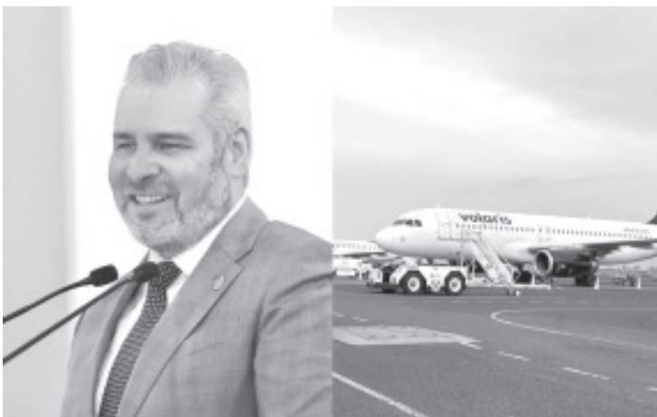
El gobernador Alfredo Ramírez Bedolla anunció la apertura de ocho nuevos vuelos con la empresa Volaris que conectarán a Michoacán con el mundo a través del Aeropuerto Internacional Francisco J. Múgica.