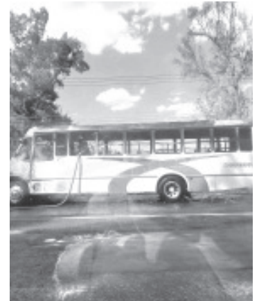
Debido a una aparente falla mecánica, un camión de pasajeros comenzó a incendiarse cuando circulaba sobre la carretera Charo-Queréndaro. Afortunadamente no hubo personas lesionadas, comentaron autoridades policiales y de rescate.

Se apreció que el automotor es de los denominados Coordinados, el cual terminó parcialmente perjudicado por las llamas. Por último, el vehículo fue retirado por una grúa.