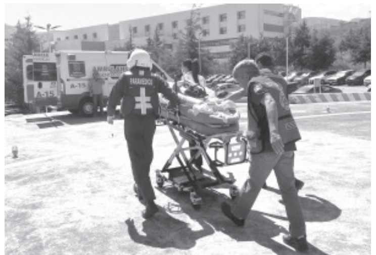
El Hospital General "Dr. Miguel Silva" de Morelia, de la Secretaría de Salud de Michoacán (SSM), llevó a cabo una procuración multiorgánica, gracias a la generosidad de la familia de un joven de 22 años, que falleció a causa de un accidente en motocicleta.

La donación de órganos es un acto de amor que puede salvar vidas, por lo que la Secretaría de Salud de Michoacán invita a la población a reflexionar sobre la importancia de esto y de manifestar su voluntad para ser donantes.