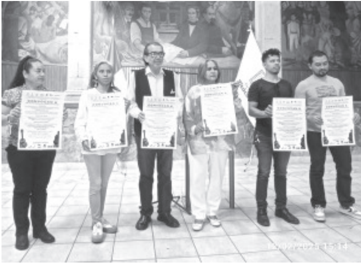
Directivos y maestros de la Escuela de Iniciación Artística afiliada a Bellas Artes presentaron la convocatoria de cursos.

H. Zitácuaro Michoacán, 12 de febrero de 2025.- Por: Guadalupe Solache Rebollo. Directivos y maestros de la Escuela de Iniciación Artística afiliada a Bellas Artes presentaron la convocatoria de cursos.