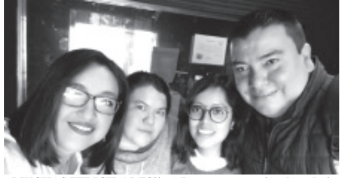
¡¡MUCHAS FELICIDADES!! ¡A Integrantes, equipo de trabajo, Locutores y Personal de «RADIO ZITACUARO»! Que celebraron el DÍA INTERNACIONAL DE LA RADIO.