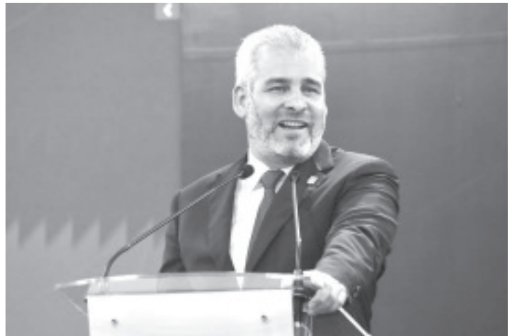
El gobernador Alfredo Ramírez Bedolla señaló que ha sostenido diálogo con los mandatarios de Guanajuato y Jalisco, Libia Dennise García Muñoz Ledo y Jesús Pablo Lemus Navarro, respectivamente, para firmar convenios en materia de seguridad y desarrollo económico.

Detalló que desde el inicio de la presente administración estatal se han realizando convenios con las entidades vecinas por el beneficio de las y los michoacanos.