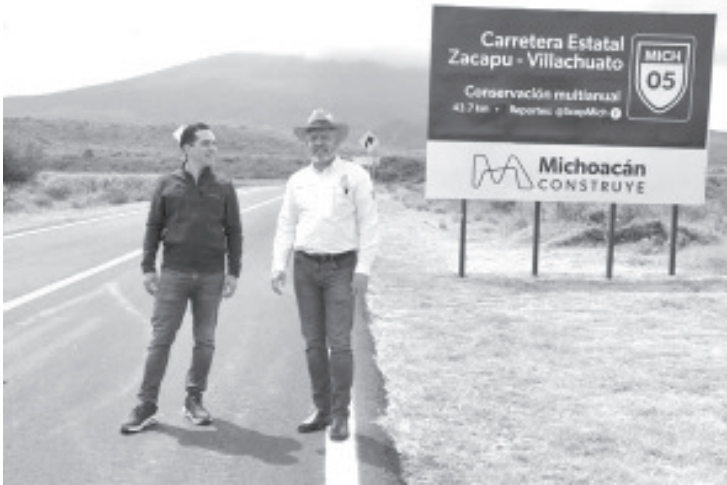
Durante la presente administración, el Gobierno de Michoacán ha invertido 5 mil 996 millones de pesos en la rehabilitación de 18 tramos carreteros multianuales y 4 estructuras elevadas que comprenden más de 680 kilómetros de la red estatal, señaló el gobernador Alfredo Ramírez Bedolla.

Morelia, Michoacán, 28 de enero de 2025.- Durante la presente administración, el Gobierno de Michoacán ha invertido 5 mil 996 millones de pesos en la rehabilitación de 18 tramos carreteros multianuales y 4 estructuras elevadas que comprenden más de 680 kilómetros de la