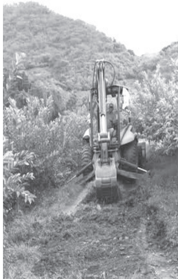
Trabajando incansablemente por un distrito más justo, más equitativo y más digno para todas y todos los ciudadanos, la Diputada Federal Mary Carmen Bernal Martínez, apoya con una máquina (retroexcavadora) a la población del municipio de Zitácuaro, programa que en próximas fechas se extenderá a otros municipios que conforman el distrito 03.

Para las personas que requieran el apoyo de la máquina deben acudir a la casa de gestión de la Diputada, ubicada en la calle Dr. Emilio García norte número 121.