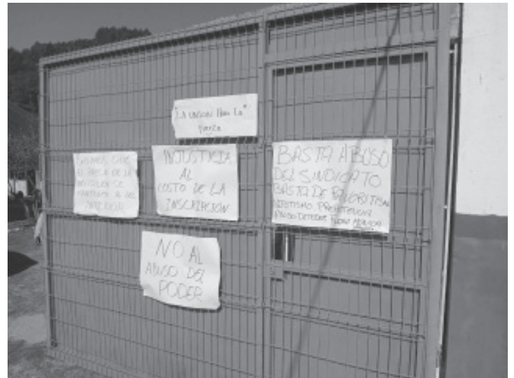
Padres de familia, de aproximadamente 200 alumnos del plantel CECYTEM de Crescencio MORALES, se manifestaron a las afueras de dicha institución educativa.