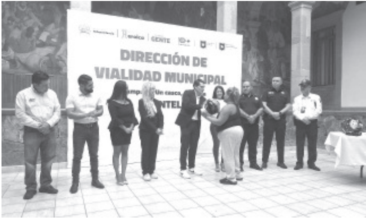
A través del programa "Un casco, una vida" que lleva a cabo la Dirección de Desarrollo Humano y Salud, el Presidente Municipal Juan Antonio Ixtláhuac entregó cascos a motociclistas del municipio.

Durante el evento se entregaron 25 cascos en una primera etapa, esto de forma simbólica.