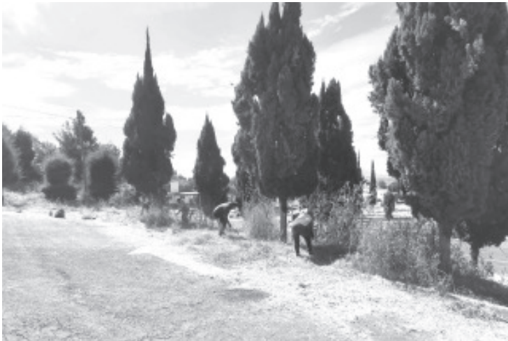
Personal de la oficina de Parques y Jardines comenzó con las acciones de limpieza del recinto ferial, esto previo a la celebración de la máxima fiesta de Zitácuaro que es la tradicional feria del 5 de febrero.