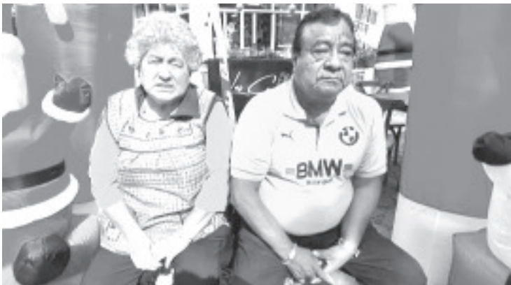
Este domingo la Unión de Jugueteros "5 de enero" llevará a cabo una caravana con motivo de las fiestas decembrinas.

Invitó a toda la población a ser parte de esta caravana y además exhortó a los Reyes Magos a visitar el Jardín Constitución, ya que en adelante habrá juguetes para todos los gustos y para todas las economías.