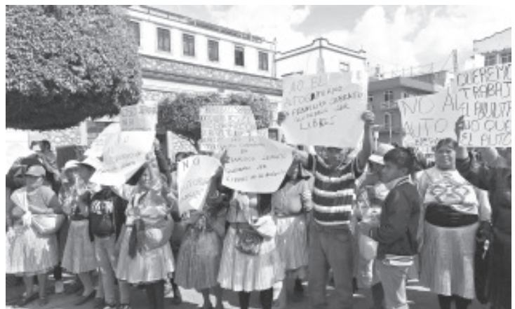
Para exigir que no se implemente el autogobierno, un grupo de habitantes de Francisco Serrato se manifestaron a la Presidencia Municipal. Con pancartas y lonas alusivas al rechazo del autogobierno,