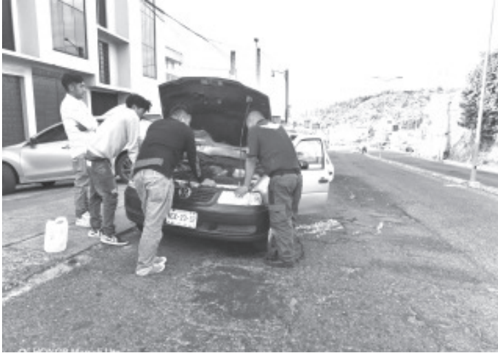
El área de los Ángeles del Camino adscrita a la Secretaría de Seguridad Pública Municipal, para esta temporada navideña lleva a cabo asistencia a conductores que circulan sobre esta demarcación hacia los diferentes destinos turísticos.

Por lo que ponen a su disposición los números de emergencia 715-116-81-23 y 715-120-63-16.