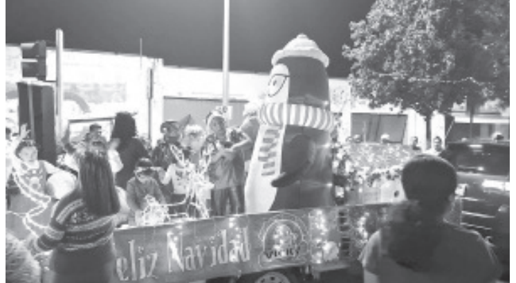
El tradicional desfile navideño en Zitácuaro, se llevó a cabo con gran éxito, reuniendo a familias completas y significó una experiencia mágica para todos los asistentes que fueron familias completas.