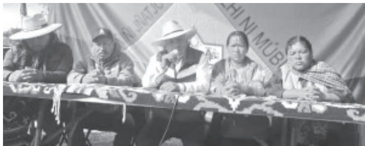
En cuanto el ayuntamiento sesione y acuerde el presupuesto para la comunidad indígena de Francisco Serrato, el bloqueo se retira, así lo anunciaron habitantes de dicha comunidad que están a favor del autogobierno.