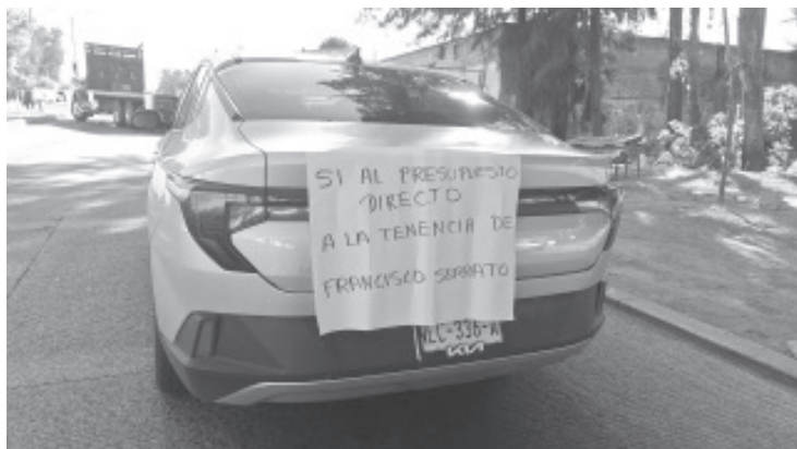
Desde las 8:00 de la mañana, un grupo de 200 personas aproximadamente, que dijeron ser de Francisco Serrato bloquearon la carretera salida a Toluca, a la altura del plantel Conalep.

Se espera que hasta las 5:00 de la tarde se sostuviera una mesa de diálogo entre los manifestantes y autoridades del Gobierno del Estado. Mientras tanto el cierre es total de esta carretera.