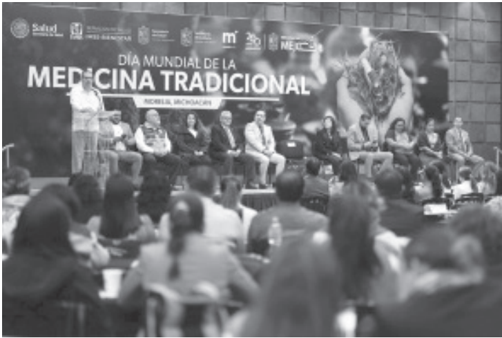
El Centro de Convecciones y Exposiciones de Morelia (Ceconexpo) fue la sede para que la Federación celebrara el Día Mundial de la Medicina Tradicional, con un Encuentro Nacional de Médicos Tradicionales, el 21 y 22 de octubre.

- Los días 21 y 22 de octubre en el Ceconexpo de Morelia se ofrecieron terapias, limpiezas, masajes y sus productos herbolarios.