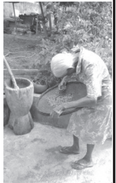
Foto muy original de una mujer de la tercera edad dedicada a las labores de su hogar, sus años no le impiden continuar con el trabajo diario que realiza quizá desde hace muchos años, si no es que durante toda su vida. Escoge los frijoles para su sustento de cada día. Un gran ejemplo.