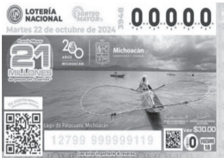
La inigualable belleza del lago de Pátzcuaro llega a todo México a través del "cachito" de lotería que conmemora los 200 años de Michoacán como estado libre y soberano. Tiene un costo de 30 pesos y se encuentra disponible en las tiendas de pronósticos de todo el país.

Este chachito de Michoacán que destaca la cultura del estado y sus bellos paisajes, cuenta con un premio mayor de 21 millones de pesos y su sorteo se realizará el martes 22 de octubre.