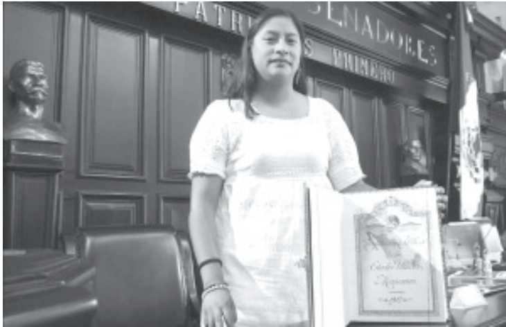
La senadora de la República y presidenta de la Comisión de Derechos Humanos en la Cámara Alta, Celeste Ascencio Ortega, informó que este 22 de octubre se realizará el Parlamento Abierto en el marco de la elección o reelección de la persona titular de la Comisión Nacional de Derechos Humanos (CNDH).

- Ciudad de México, 21 de octubre de 2024 - La senadora de la República y presidenta de la Comisión de Derechos Humanos en la Cámara Alta, Celeste Ascencio Ortega, informó que este 22 de octubre se realizará el Parlamento Abierto en el marco de la elección o reelección de la persona titular de la Comisión Nacional de Derechos Humanos (CNDH).