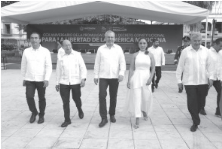
Al encabezar el 210 Aniversario de la Promulgación del Decreto Constitucional para la Libertad de la América Mexicana, el gobernador Alfredo Ramírez Bedolla manifestó que Morelos fue un gran visionario, al sentar las bases de la República, y hoy, en esa línea, en Michoacán avanza un proceso de reformas constitucionales contenidas en el Plan Morelos, cuyo propósito es ampliar y consolidar derechos de los michoacanos.

Apatzingán, Michoacán, 22 de octubre de 2024.- Al encabezar el 210 Aniversario de la Promulgación del Decreto Constitucional para la Libertad de la América Mexicana, el gobernador Alfredo Ramírez Bedolla manifestó que Morelos fue un gran visionario, al sentar las bases de la República, y hoy, en esa línea, en Michoacán avanza un proceso de reformas constitucionales contenidas en el Plan Morelos, cuyo propósito es ampliar y consolidar derechos de los michoacanos.