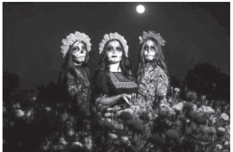
La Semana de Muertos se vivirá en Michoacán del 20 de octubre al 3 de noviembre con distintas experiencias que sumergirán a turistas y visitantes en las tradiciones de la celebración de Noche de Muertos, fecha conocida a nivel internacional.