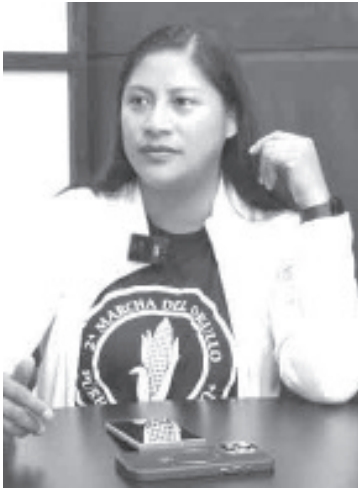
La Senadora de la República, Celeste Ascencio Ortega, afirmó hoy en gira de medios en Morelia que el proceso para la elección o reelección del presidente de la Comisión Nacional de Derechos Humanos (CNDH) garantiza piso parejo para quienes han decidido participar.

- Será un proceso limpio e incluyente, dijo la Senadora de la República en gira de medios