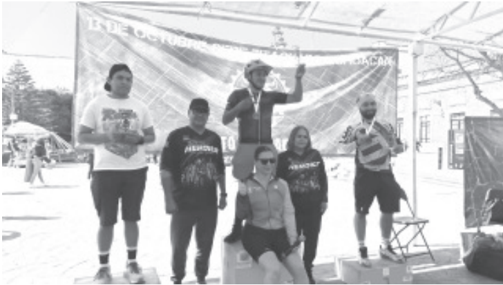
Durante el fin de semana se llevó a cabo el evento "Reto Jabalí" de Ciclismo de Montaña y fue la Plaza Cívica Licenciado Benito Juárez el sitio que fungió como meta y salida.

- Ciclistas recorren en competencia 28 y 56 kilómetros.