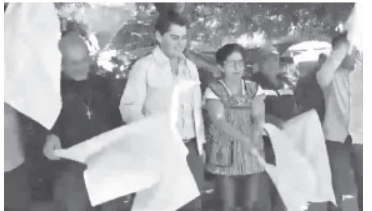
Esta semana, el presidente municipal Juan Antonio Ixtláhuac dio el banderazo de inicio a los trabajos de la tercera etapa del Embellecimiento del Centro Histórico de Zitácuaro.

Este esfuerzo busca consolidar a Zitácuaro como una ciudad con una imagen renovada y atractiva, potenciando su desarrollo turístico y mejorando la calidad de vida de sus habitantes.