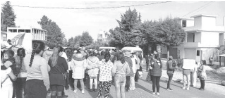
Padres de familia de la escuela primaria Francisco I. Madero de la comunidad de Macho de Agua, bloquearon desde las primeras horas de este lunes la carretera libre Zitácuaro-Toluca a la altura de Macho de Agua.

Por el momento no hay circulación para los automovilistas en esta zona, deben evitar transitar por esta vía y la opción es que circulen por la autopista Zitácuaro Lengua de Vaca.