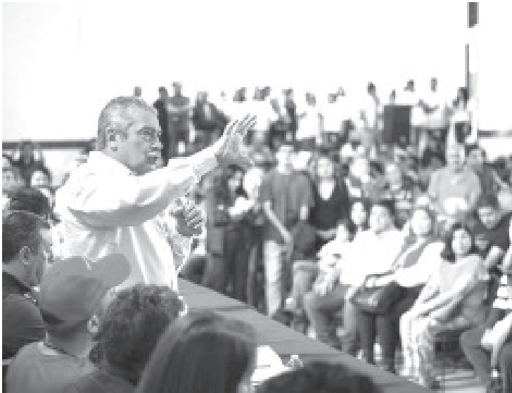
Arropado por grupos políticos, liderazgos de sectores sociales y simpatizantes en general, el senador morenista por Michoacán, Raúl Morón Orozco, agradeció el respaldo de las y los michoacanos en el pasado proceso electoral y expuso el trabajo legislativo que ha realizado para consolidar el avance de la Cuarta Transformación.

- En una asamblea multitudinaria, el senador morenista habló sobre los logros ya alcanzados y los retos venideros dentro de la LXVI Legislatura.