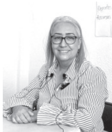
La Diputada Local Emma Rivera Camacho se dijo orgullosa de los recientes avances legislativos que marcan un hito en la historia de Michoacán. Con mucho gusto, la legisladora celebra la aprobación de la iniciativa que despenaliza el aborto, un paso crucial para dejar de criminalizar a las mujeres y promover la igualdad sustantiva.

La Diputada Emma Rivera Camacho reafirma su compromiso con la lucha por la igualdad de derechos y el bienestar de todos