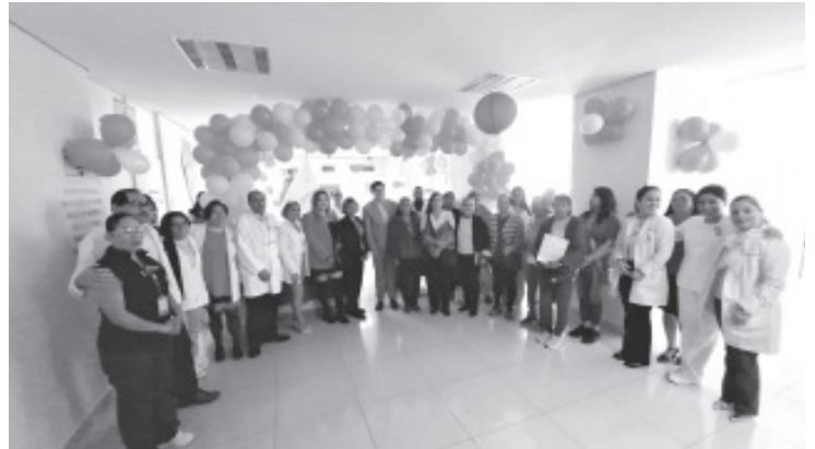
Con una visita al Hospital Regional, donde funciona de forma permanente un mastógrafo, dio inicio la campaña Octubre Rosa para honrar los esfuerzos que se hacen contra el cáncer de mama.

SEPTIEMBRE Y OCTUBRE MESES DEL TESTAMENTO