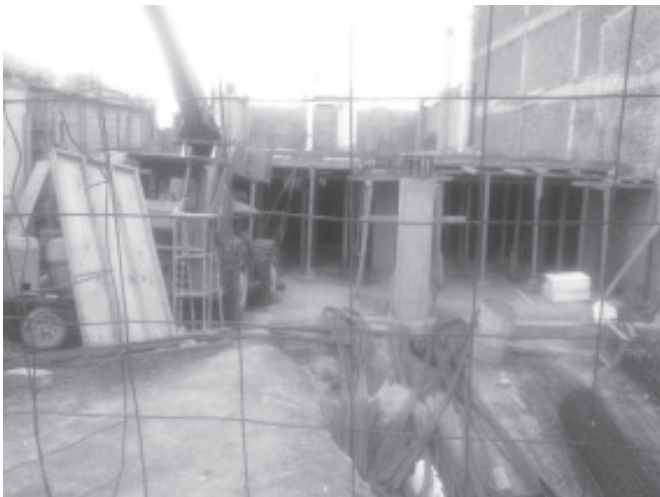
Construcción del hotel Irekua sobre la avenida Revolución en el año de 2016.