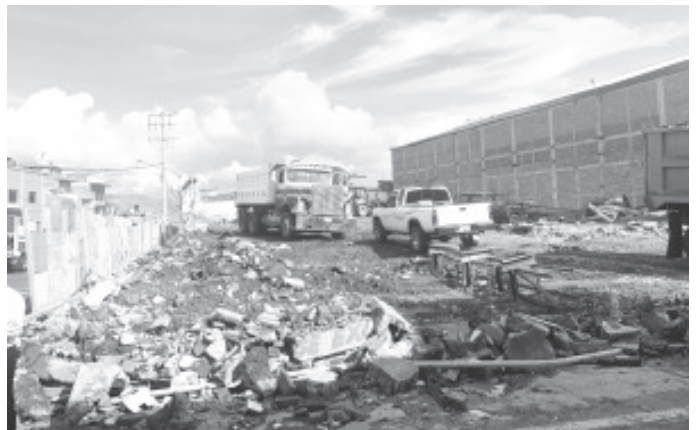
Iniciaba la construcción de la tienda Elektra, en la esquina de Benedicto López y Lerdo de Tejada, año de 2021, vino a cambiar la fisonomía urbana de esa zona comercial.