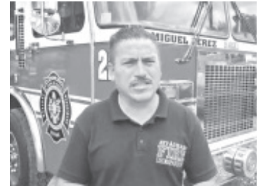
Con el objetivo de enviar ayuda a damnificados de Huetamo y sus alrededores, el Cuerpo de Bomberos de Zitácuaro instaló un centro de acopio en su base que se encuentra en Avenida Revolución Sur.

Comentó que los interesados en ayudar pueden llevarla a la base ubicada en Avenida Revolución Sur o bien, llamar y con gusto los elementos van por la ayuda hasta su domicilio