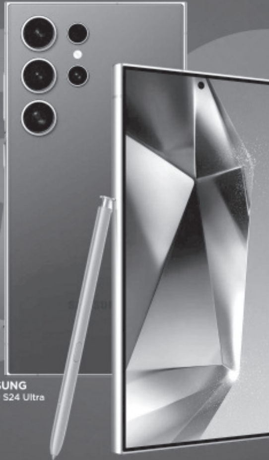
SAMSUNG Galaxy S24 Ultra