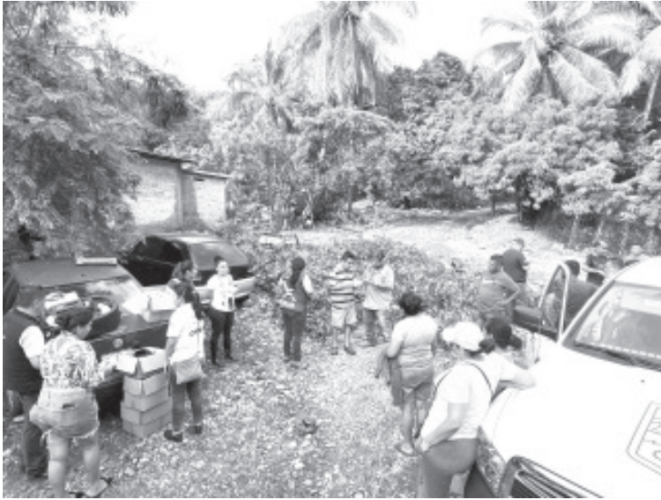
La Secretaría de Salud de Michoacán (SSM) no reporta daños en su infraestructura hospitalaria en los municipios de Lázaro Cárdenas, San Lucas y Huetamo, lo que ha permitido brindar atención médica de manera ordinaria a la población afectada por las lluvias e inundaciones ocasionadas por el fenómeno hidrometeorológico John.

- No reporta daños en su infraestructura hospitalaria en estos municipios.