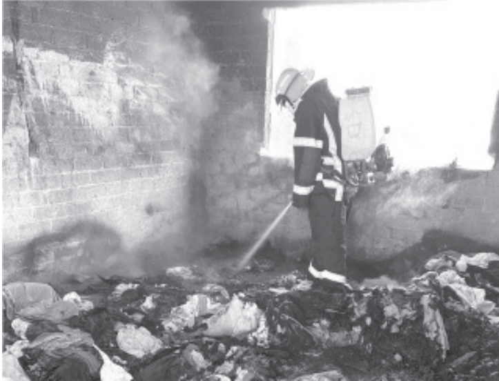
El H. Cuerpo de Bomberos Zitácuaro atendió un incendio en una vivienda abandonada utilizada como bodega, ubicada en el libramiento Samuel Ramos, entre Reforma y Doctor Emilio García Sur.

Para emergencias, los números de contacto son: 7151538742, 7151649432 y 7151008419.