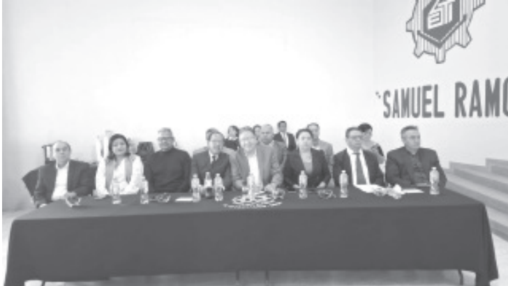
En un evento por demás emotivo, la Escuela Secundaria Técnica 49 "Samuel Ramos" cumplió 49 años de su fundación en Zitácuaro y de formar alumnos en este nivel educativo.

Durante el acto personal que cumplió 20 y 40 años de servicio recibió su reconocimiento respectivo en homenaje a su labor realizada en beneficio de los jóvenes estudiantes y de toda la sociedad.