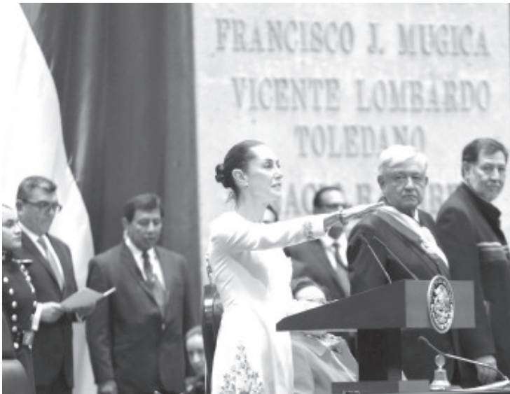
El gobernador Alfredo Ramírez Bedolla acompañó a la presidenta de México, Claudia Sheinbaum Pardo a su toma de protesta en sesión solemne del Congreso de la Unión, en un acto sin precedentes al convertirse en la primera mujer que asume la titularidad del Poder Ejecutivo en el país.

De igual forma, Ramírez Bedolla señaló que en Michoacán se trabaja en el Plan Morelos, proyecto que contempla la propuesta de una serie de reformas para homologar leyes federales y contar en la entidad con un sistema ampliado de derechos.