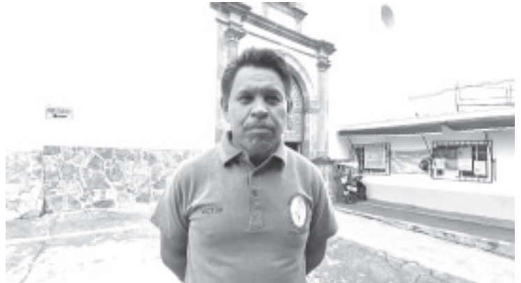
Este año más de 1300 hombres de la región Zitácuaro participarán en la peregrinación a pie al Tepeyac e incluso en el camino se sumarán muchos más.

SEPTIEMBRE Y OCTUBRE MESES DEL TESTAMENTO