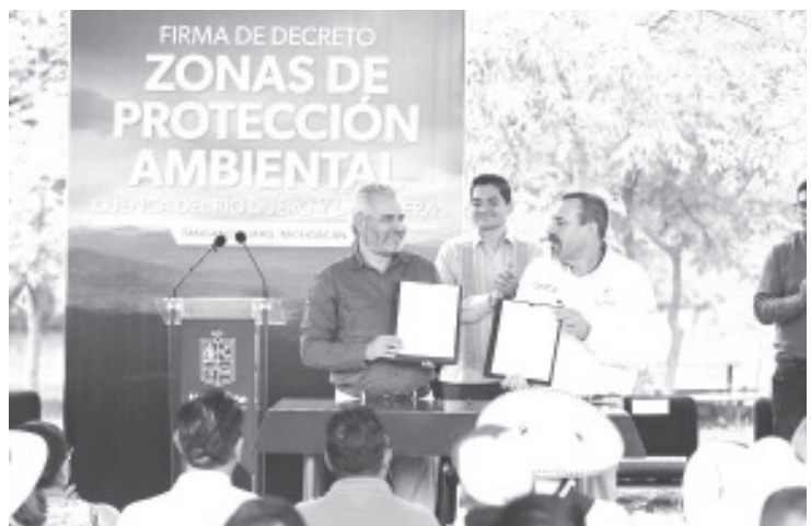
Para proteger los recursos naturales de Michoacán y hacerle frente al cambio climático y la sequía, el gobierno de Alfredo Ramírez Bedolla triplicó la superficie de áreas naturales protegidas en el estado, con lo cual se conservarán los servicios ambientales que estas zonas generan.

La captación e infiltración del agua, regulación del clima, mejora en la calidad del aire, prevención de erosión del suelo, protección de la biodiversidad, generación de oxígeno, control de plagas y mitigación del cambio climático, son algunos de los servicios ambientales que se conservan a través de estas acciones.