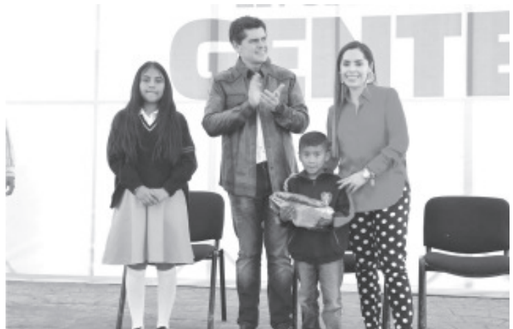
Con la intención de apoyar la formación educativa de la niñez y juventud, así como aminorar la carga económica de las familias zitacuarenses, el alcalde Juan Antonio Ixtláhuac encabezó la entrega de uniformes escolares para estudiantes de distintas escuelas de nivel básico.

Invitó también a toda la población, principalmente a los que tengan hijos menores de 5 años, acudir a la revisión de cartillas, así se darán cuenta que biológico les falta y sin problema se les coloca.