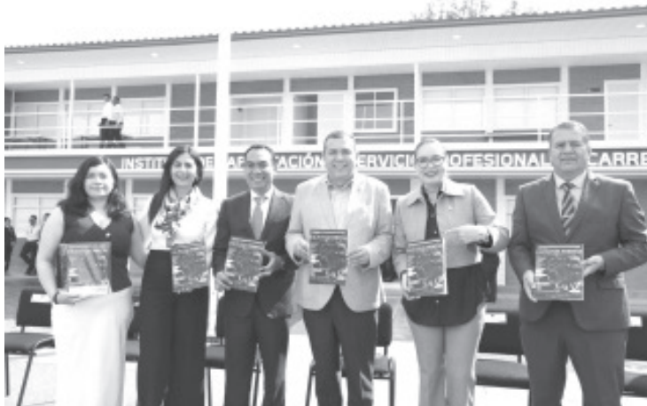
El titular de la Fiscalía General del Estado de Michoacán, Adrián López Solís, presentó la nueva revista especializada Factotum Veritas, una iniciativa que busca enriquecer el debate jurídico y ofrecer información relevante sobre el funcionamiento de la Fiscalía y el ámbito del derecho.

- Esta iniciativa tiene como objetivo alentar la investigación sobre criminalidad y violencia, promoviendo el debate y la reflexión en torno a la realidad que enfrenta el estado