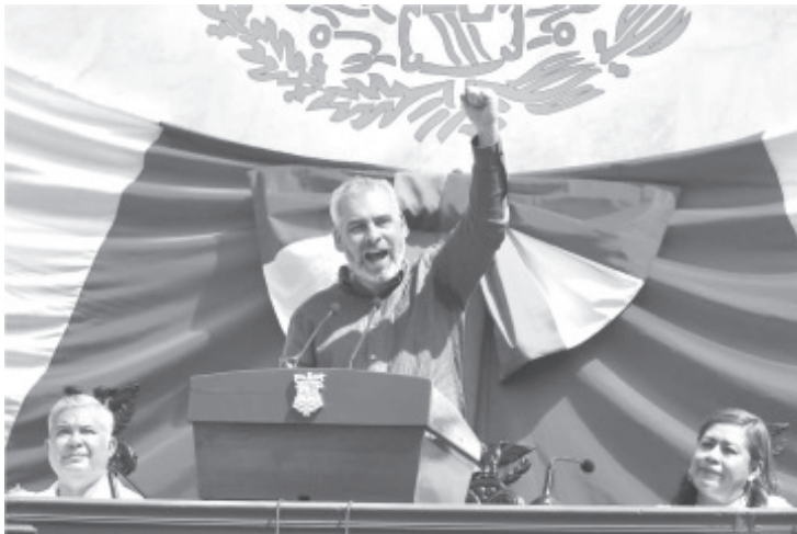
El gobernador Alfredo Ramírez Bedolla rindió su Tercer Informe de Gobierno ante más de 40 mil michoacanos que se dieron cita en el Estadio Morelos de la capital michoacana, donde destacó los avances en materia de infraestructura, seguridad, gobernabilidad, salud, educación y medio ambiente.

- Destaca avances en infraestructura, seguridad, gobernabilidad, salud, educación y medio ambiente