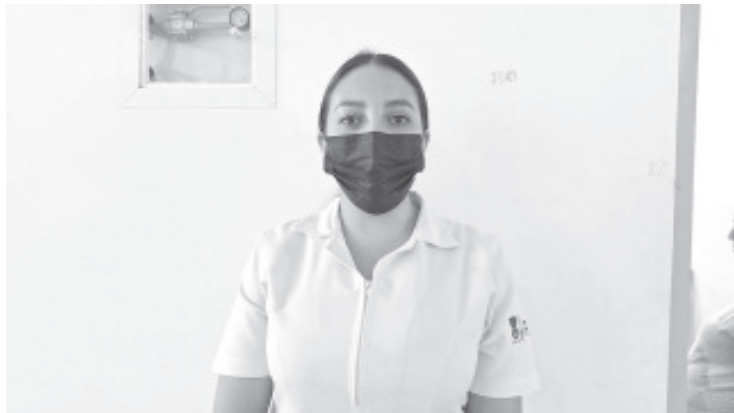
Personal del área de vacunas del Centro de Salud recorre las escuelas para vacunar contra el Virus del Papiloma Humano a niñas de quinto y sexto de primaria; primero, segundo y tercero de secundaria.