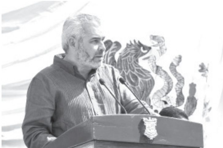
Tras destacar que en Michoacán se han destinado 14 mil 600 millones de pesos para la ampliación de la autopista Siglo XXI y en las nuevas autopistas que conectan a La Piedad con Ecuandureo y Zitácuaro con Maravatío, el mandatario estatal Alfredo Ramírez Bedolla señaló durante su Tercer Informe que estas vialidades impulsan el desarrollo del estado.

Expuso que en solo tres años de este Gobierno se ha invertido más en infraestructura que en las dos administraciones pasadas y refrendó dar continuidad a este modelo para el desarrollo social y la integración regional.