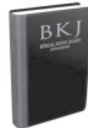
Bible King James