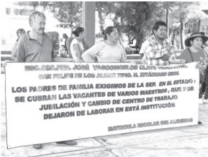
Padres de familia de la Escuela Secundaria Federal José Vasconcelos de San Felipe los Alzati, demandan a las autoridades estatales la atención inmediata a diferentes demandas, principalmente la regulación de claves a maestros que han laborado en esta institución desde hace 16 años sin recibir ningún pago.

Aunado a los problemas, han aceptado sin ningún problema a personal nuevo pero no se ha beneficiado a los docentes, que tienen años frente a grupo, sin recibir pago alguno. Si continúa el desinterés podrían cerrar la carretera así como emprender medidas que atiendan sus demandas.