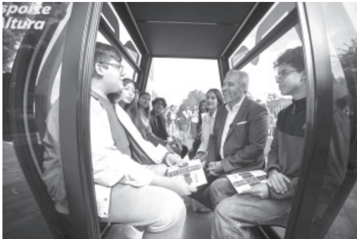
El gobernador Alfredo Ramírez Bedolla visitó Ciudad Universitaria de la Máxima Casa de Estudios de Michoacán, para dar a conocer a estudiantes de diversas licenciaturas, cómo serán las cabinas que conformarán el teleférico de Morelia.

- Beneficiará directamente a los jóvenes al contemplar una estación en Ciudad Universitaria.